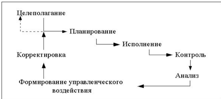
Рис. 2 Этапы цикла управления

Поэтому, под контроллингом понимается комплексный циклический процесс управления, в котором функции планирования, контроля и др. рассматриваются как неотъемлемые этапы, и контроль является продолжением целеполагания, планирования, то есть сопровождает процесс разработки и реализации стратегии, мероприятий, а носители функций контроля – непосредственные участники или заинтересованные лица стратегического управления.