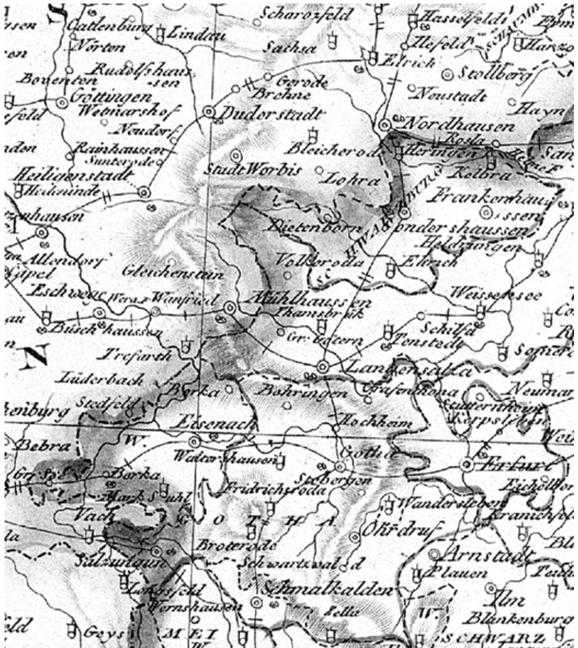
Kartenausschnitt: Die Königreiche von Sachsen und Westphalen 1808. (Reprint im Verlag Rockstuhl).