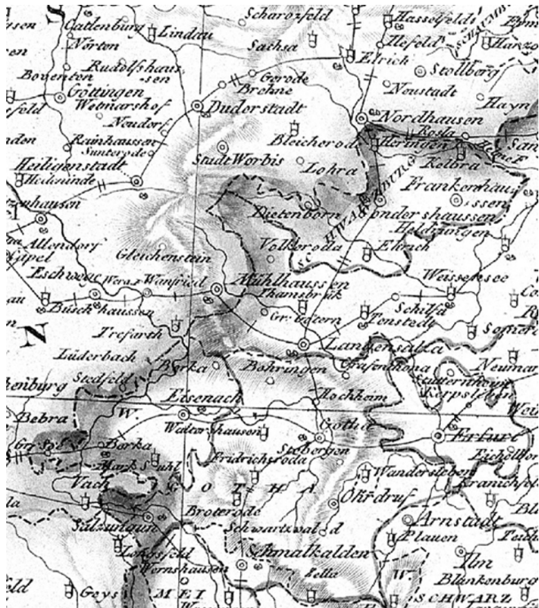
Kartenausschnitt: Die Königreiche von Sachsen und Westphalen 1808. (Reprint im Verlag Rockstuhl). Langensalza gehörte damals zu Sachsen. Nach der Frage,