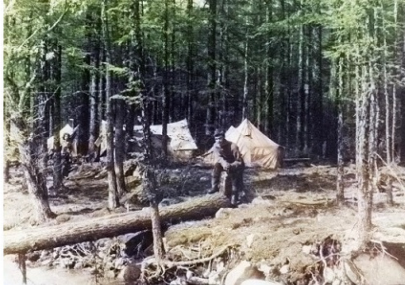
Лагерь на речке Ср. Сакукан

Но вот олени пришли, наш отряд, возглавляемый Юрой Найденовым, перебросили Вертолетом МИ-4 на участок работ на речку Средний Сакукан. Поставили палатки, стали ходить в маршруты.