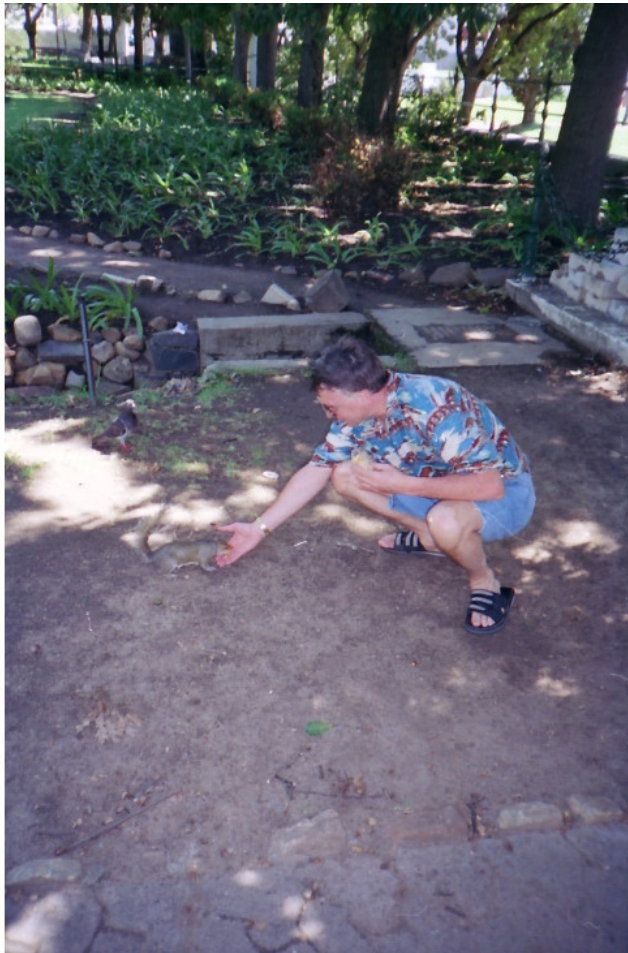
В городском парке Кейптауна