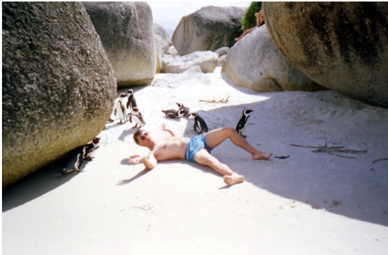
2. Среди пингвинов на пляже Боулдерс в городе Саймонс Таун