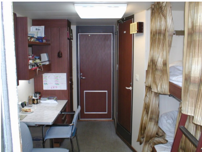
8. Каюта на НЭС «Академик Фёдоров»