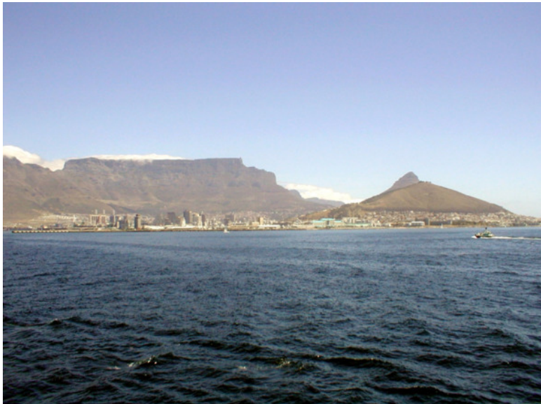
1. Столовая гора (слева) и гора Львиная голова (справа)