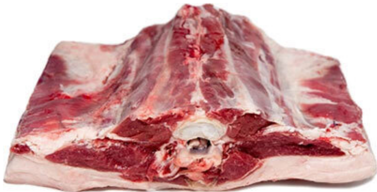
Корейка баранья на кости (седло барашка) (Поясничная часть корейки)