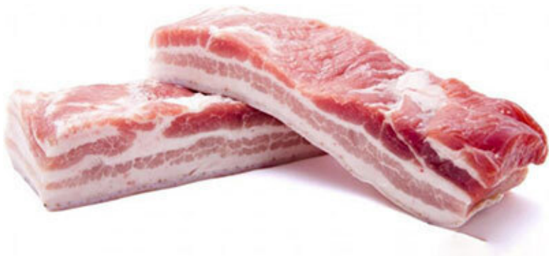
Свиная грудинка. Бескостная часть (пашина)