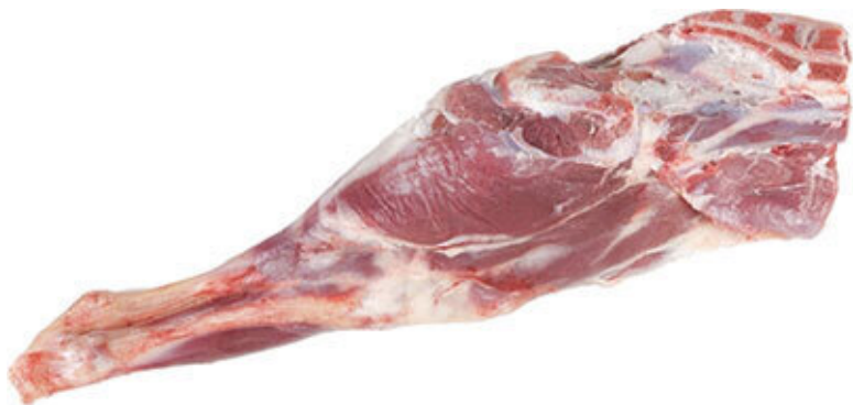
Задняя нога барана