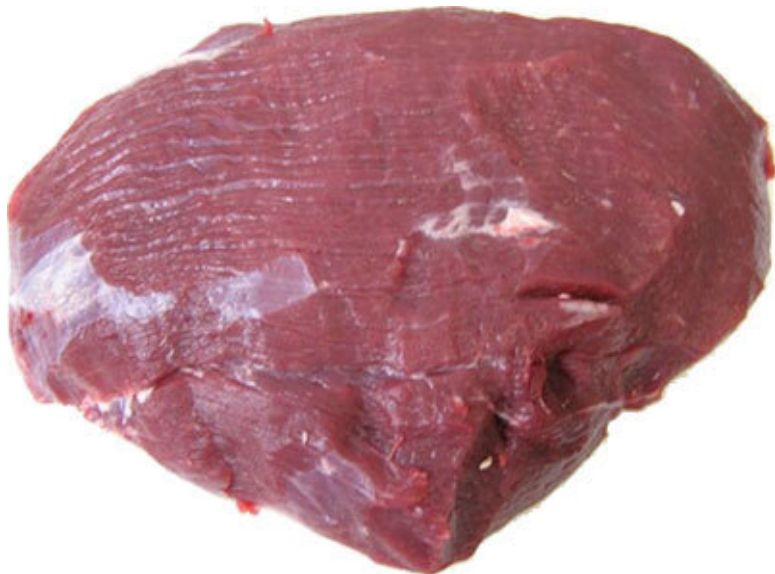
Внутренний кусок заднетазовой части