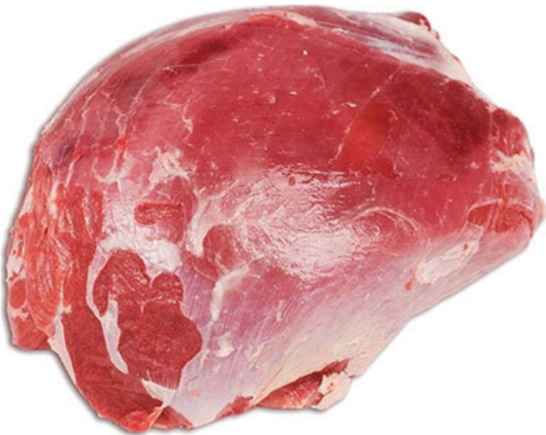
Боковой кусок заднегрудной части

С некоторого времени появилось такое понятие, как «альтернативные стейки»! Я упоминал уже об этом выше, но повторяюсь. Ибо повторенье – мать ученья! Что же имеется в виду под этим интригующим названием?