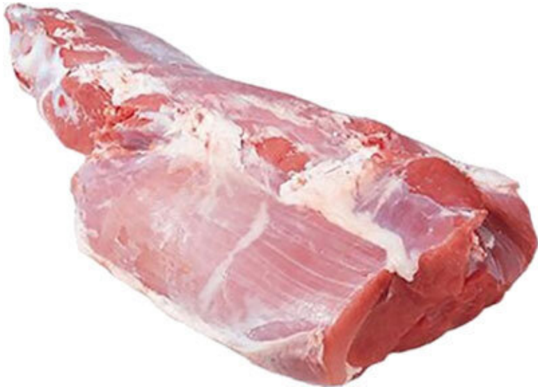
Наружный кусок заднетазовой части