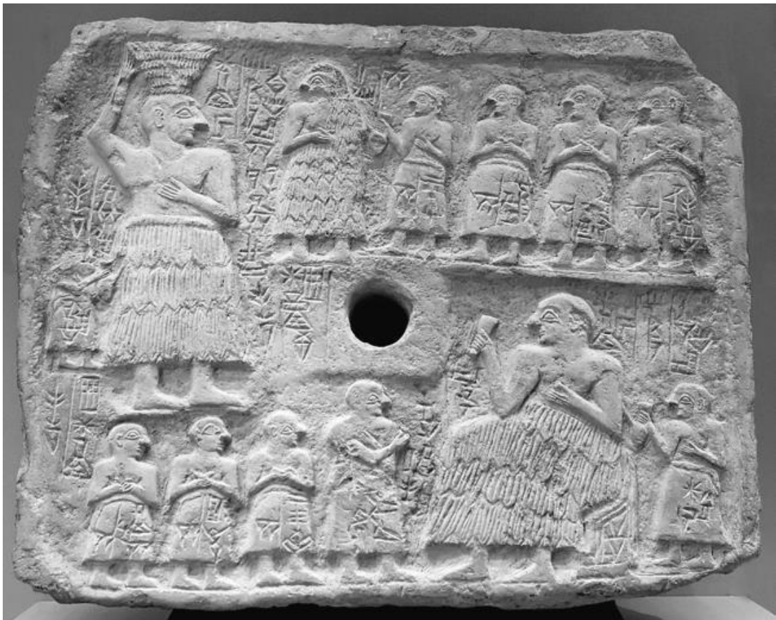
Рельеф с изображением подношений царю Лагаша Ур-Нанше с упоминанием кораблей из страны Дильмун. 2550–2500 гг. до н. э.

Ранние слои городища, относящиеся примерно к 2200–2000 гг. до н. э., находятся в северной части холма. Это было открытое поселение с многочисленными остатками меднолитейного производства. В тот период его можно отнести к протогороду. Около 2000 г. до н. э. были построены каменные стены, защищавшие город площадью около 15 га. Город был разделен на кварталы. Примерно в 1500 г. до н. э. остров был захвачен касситами-вавилонянами. Со временем он обеднел, но сохранил свою стратегическую важность. Обнаружили ирригационную систему, десять курганов правителей и множество дворцов. Это позволило исследователям получить много информации о цивилизации. К этому периоду относится найденное монументальное здание с остатками архива глиняных клинописных табличек. Это здание интерпретируется как дворец правителя или наместника. На городище Саар был раскопан храм с перекрытием на трёх колоннах. Также были обнаружены некрополи, иногда насчитывающие несколько тысяч могил.