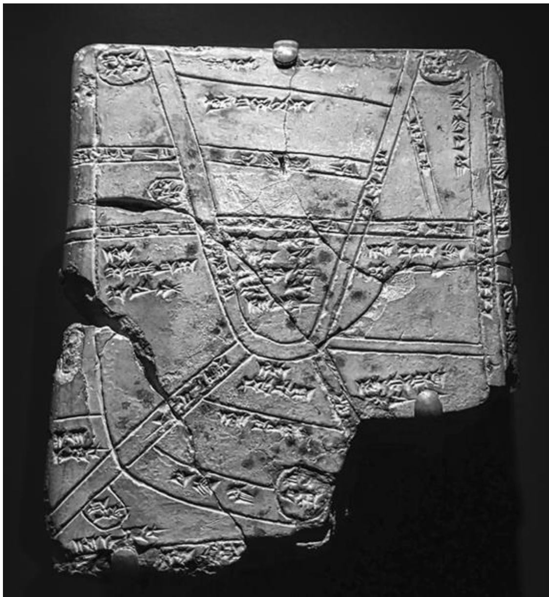
Вавилонская клинописная табличка с картой Ниппура. 1550–1450 гг. до н. э.

Центр Ниппура, храмовый комплекс, сочетал в себе зал собраний, хижину для плугов, высокую лестницу у подножия холма, который некоторые считают тюрьмой или пропастью. Также упоминаются различные ворота, такие как ворота, «где не срезали зерно», «высокие ворота», «ворота мира» и «ворота суда», а также дренажные каналы. Упоминаются и другие места, такие как многоэтажная «гигуна» среди прочих, которая оказалась непонятной даже современным учёным. В гимне Урнинурте упоминается дерево, которое возвышается во дворе Экура. Экур был известен тем, что внушал людям страх, ужас и панику, особенно среди злых и невежественных людей.