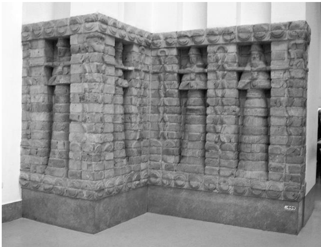
Рельеф на фасаде храма Инанны из Урука. Середина XV в. до н. э.

Начинала процветать в городах при храмах работорговля. Храмы, покупавшие городских женщин, брали их на работу храмовыми проститутками, служившими богиням телом.