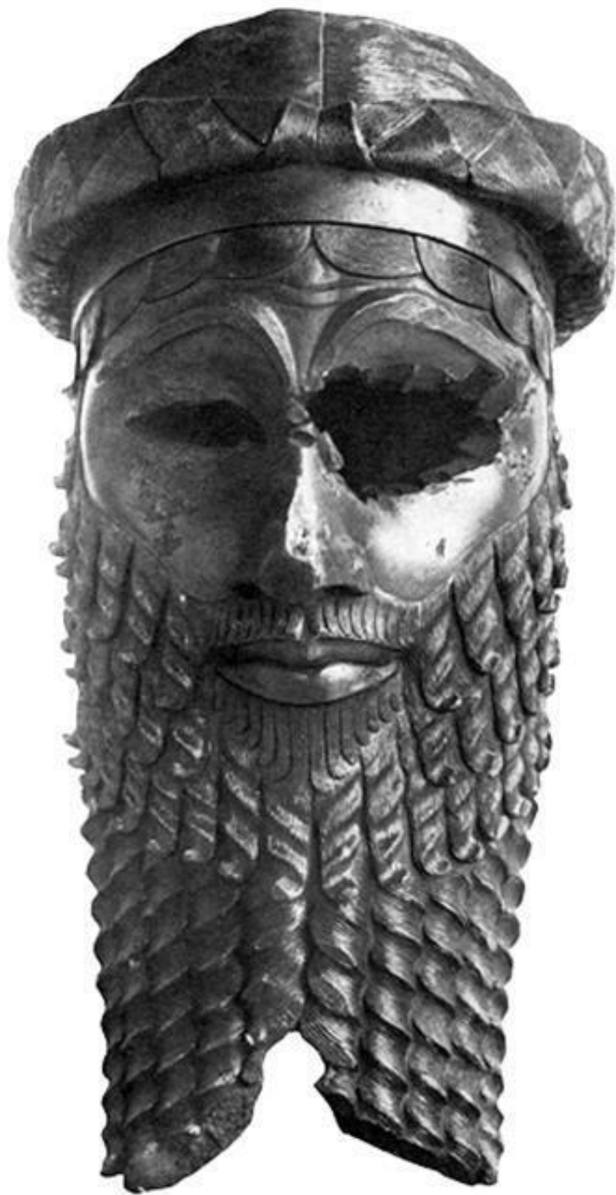
Бронзовая голова статуи царя Аккада Саргона. Около 2300 г. до н. э.