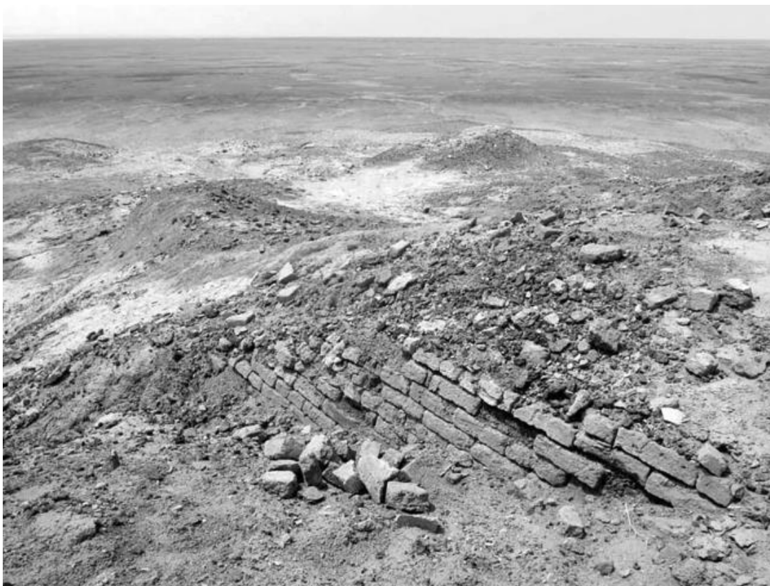
Зиккурат в Эриду. 2123–2106 гг. до н. э.

Основой для Эреду был храм Акифер – дом бога мудрости и подземных вод бога Энки. Как культовое место он просуществовал несколько тысячелетий и был разрушен только в 600-х годах до н. э., в период нашествия киммерийцев и скифов, и позднейшего прихода к владычеству персов при правлении Ахеменидов.