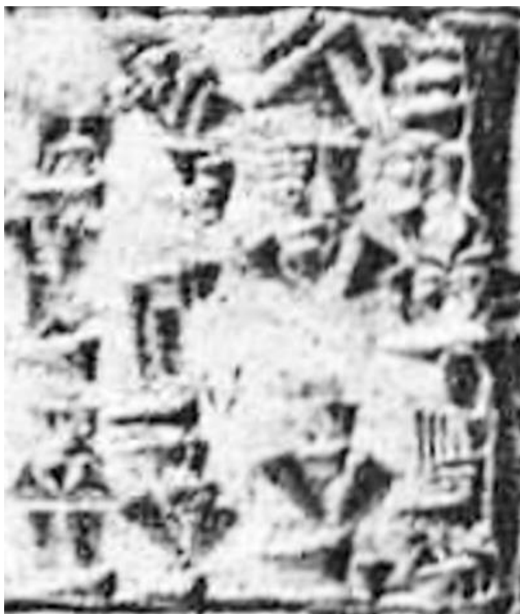
Цилиндр Гудеа (надпись A IX 19) с упоминанием Магана

Первые упоминания о земле Маган в шумерских текстах относятся к 2600–2000 г. до н. э., в этих текстах также говорится о «владыках Магана». Аккадские кампании против Магана проводились в XXIII в. до н. э. Возможно, именно это послужило причиной необходимости строительства укреплений. Нарам-Син и Маништусу, в частности, писали о своих кампаниях против «32 владык Магана». Нарам-Син присвоил побеждённому правителю Магана титул «малек», который имеет родство с семитским словом, обозначающим правителя, – «малик».