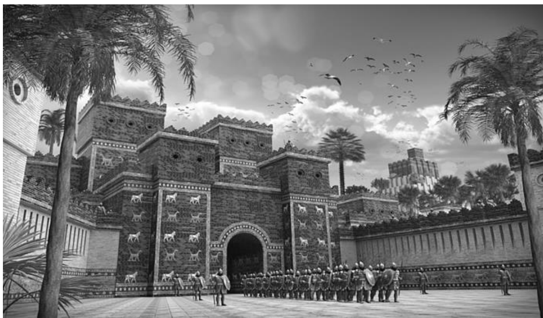
Ворота Иштар в Вавилоне. Реконструкция

Ворота Иштар были построены в 575 г. до н. э. по приказу царя Кишшатим Навуходоносора II (около 605–562 гг. до н. э.) в северной части города. Полное аккадское название этих ворот – Ištar-sākipat-tēbīša – «Богиня Иштар, останавливающая натиск». Ворота представляют собой громадную полукруглую арку, которая выходит на так называемую Дорогу процессий. Стены ворот и дороги покрыты яркими глазурованными плитками синего, жёлтого, белого и чёрного цветов. Стены ворот и Дороги процессий украшены барельефами с изображениями животных, выполненными в очень реалистичной манере. На стенах дороги можно увидеть около 120 барельефов с львами. Стены ворот покрыты чередующимися рядами изображений сиррушей и быков. Всего на воротах изображено около 575 животных. На стенах изображены львы, которые символизируют Иштар – вавилонскую богиню войны, мудрости и сексуальности. На воротах можно увидеть сиррушей и туров.