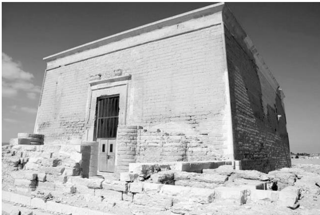
Храм Собека в Файюме

Древние памятники Файюма можно условно разделить на две части: сооружения Среднего царства и эпохи Птолемеев. В знаменитом «Папирусе Меридова озера» упоминается 65 городов и поселений, расположенных возле озера в Позднее время. В Файюме был обнаружен наиболее хорошо сохранившийся храм эпохи XII династии. Этот храм, воздвигнутый Аменемхетом III и IV в Мединет Мади, посвящён богу Себеку и его супруге, богине урожая Рененутет, которая обычно изображалась в облике змеи.