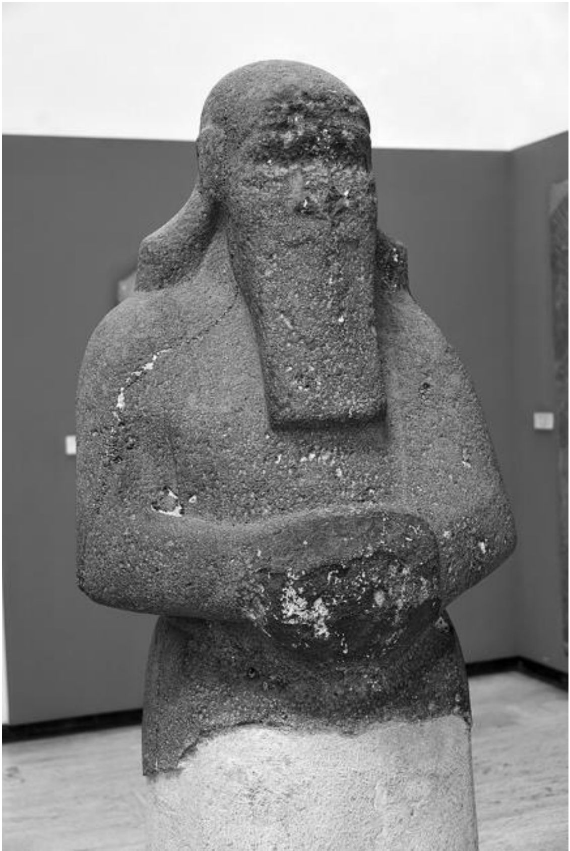
Незаконченная базальтовая статуя Шалманасара III из Ашшура. 858–824 гг. до н. э.

Верховным жрецом города был сам ишшакум, который и был главным жрецом бога Ашшура, считавшегося «отцом богов» и «повелителем вселенной». Хранительницей города