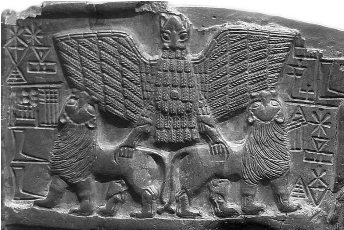
Анзу – мифическая птица, символ города Лагаш. Рельеф около 2400 г. до н. э.

На двух островах сохранились ворота и стены, которые когда-то их обрамляли. Городские улицы были тщательно вымощены, а на площадях находились большие печи. Есть свидетельства того, что жители занимались сельским хозяйством и гончарным ремеслом. Другие острова с гаванями были заняты рыбным промыслом и сбором тростника для строительства зданий. На четвёртом острове обнаружили храм. Было обнаружено шумерское заведение общественного питания. Здание состояло из нескольких комнат и открытой площадки, напоминающей летнюю веранду.