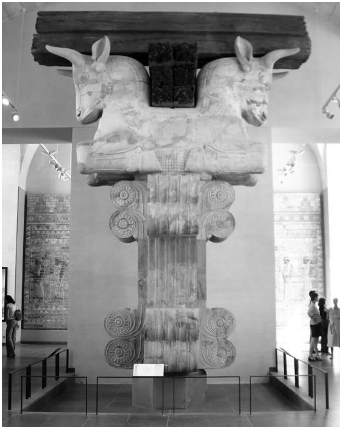
Капитель из дворца Дария I в Сузах. Около 510 г. до н. э.

Сузы были посвящены богине Киририши, ассоциированной с богиней Инанной, богиней любви и войны, имевшей титулы «Мать богов» и «Владычица главного храма». Собственным покровителем города был бог Иншушинак. В Эламе особое почитание заслужили змеи как символы мира мёртвых. Во II–I тыс. до н. э. Хумпан, Иншушинак и Киририша составляли ведущую триаду богов Суз. Правители Элама обычно называли себя «любимыми слугами» Иншушинака. Основными местами почитания Иншушинака были храм в крепости Суз, построенный около 2240 г. до н. э., и храм, расположенный примерно в 40 километрах от города, который был возведён в честь Иншушинака около 1250 г. до н. э. Этот храм носил название Дур-Унташ и представлял собой культовый комплекс. В Сузах проходили религиозные мистерии.