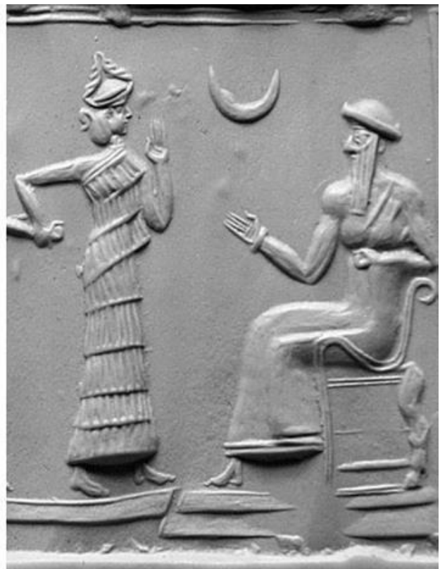
Аэрофотосъемка раскопок Ура. 1927 г. и фрагмент шумерской цилиндрической печати царя Ур-Намму

Храму бога Нанны требовались предметы для богослужений, поэтому развивалась торговля. Вокруг храма возник храмовый комплекс, который привлекал людей разных племён, прибывающих из первобытных стоянок и пещер. Ко времени III династии Ура храм Нанны в