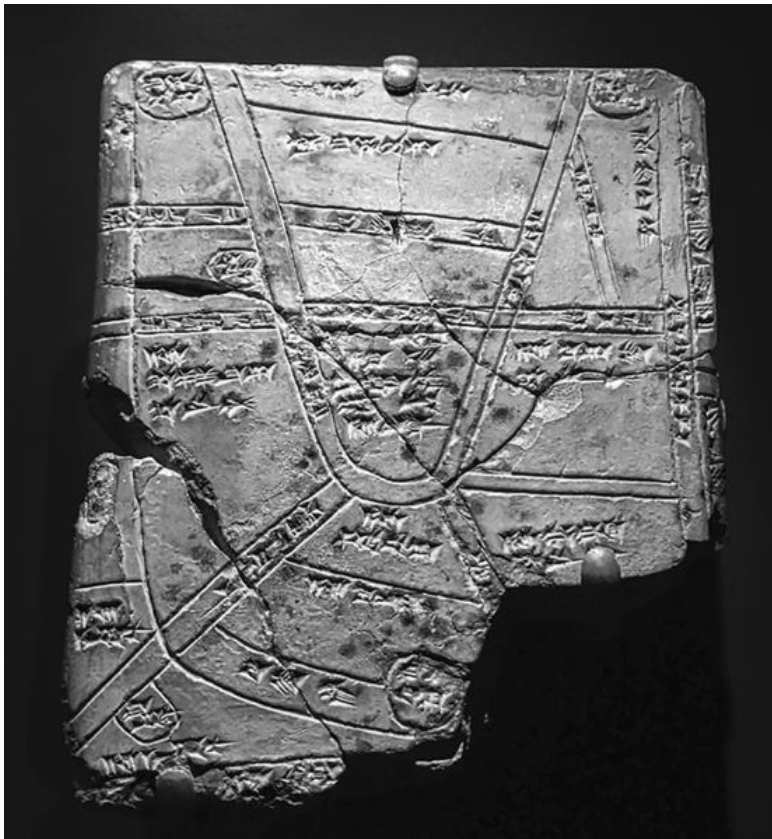
Вавилонская клинописная табличка с картой Ниппура. 1550–1450 гг. до н. э.

Центр Ниппура, храмовый комплекс, сочетал в себе зал собраний, хижину для плугов, высокую лестницу у подно-