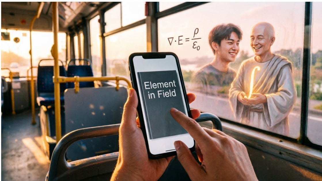
Иллюстрация 1: Автобус, палец, телефон с парящими геометрическими фигурами

Пролог. Автобус, один палец и начало всего