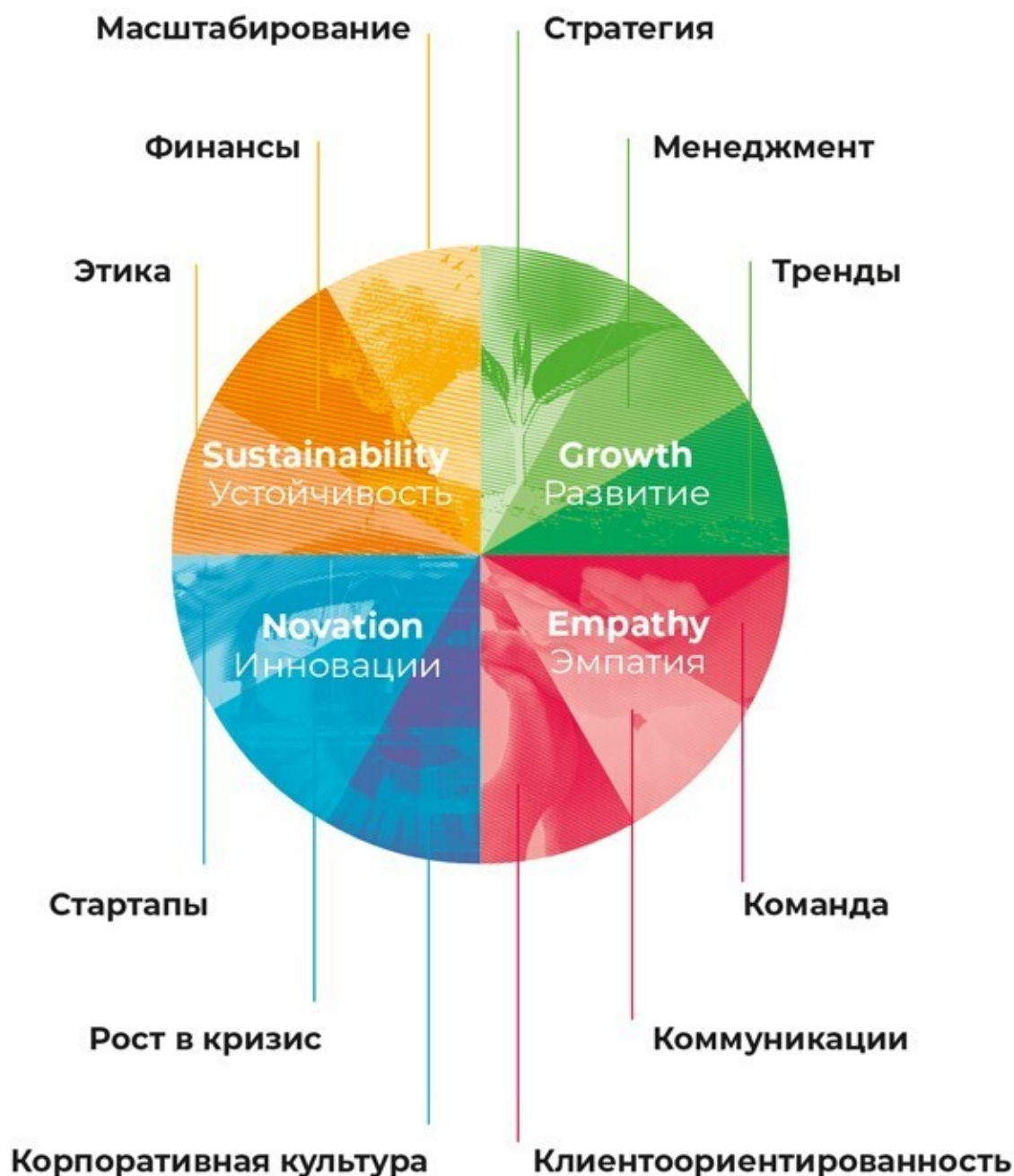
Рис. 2. Двенадцать столпов GENS-лидерства

Каждый из этих блоков, наследуя ценности уровня, построен на практиках, принципах и философии, проверенных опытом ГК ЛАНИТ.