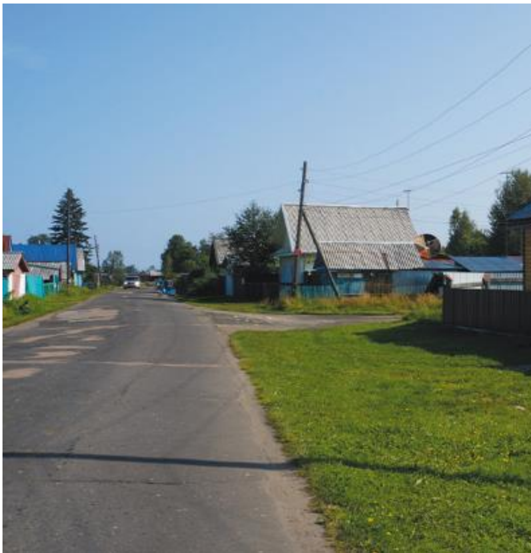
Выдрино, мой дом – крыша на три ската.