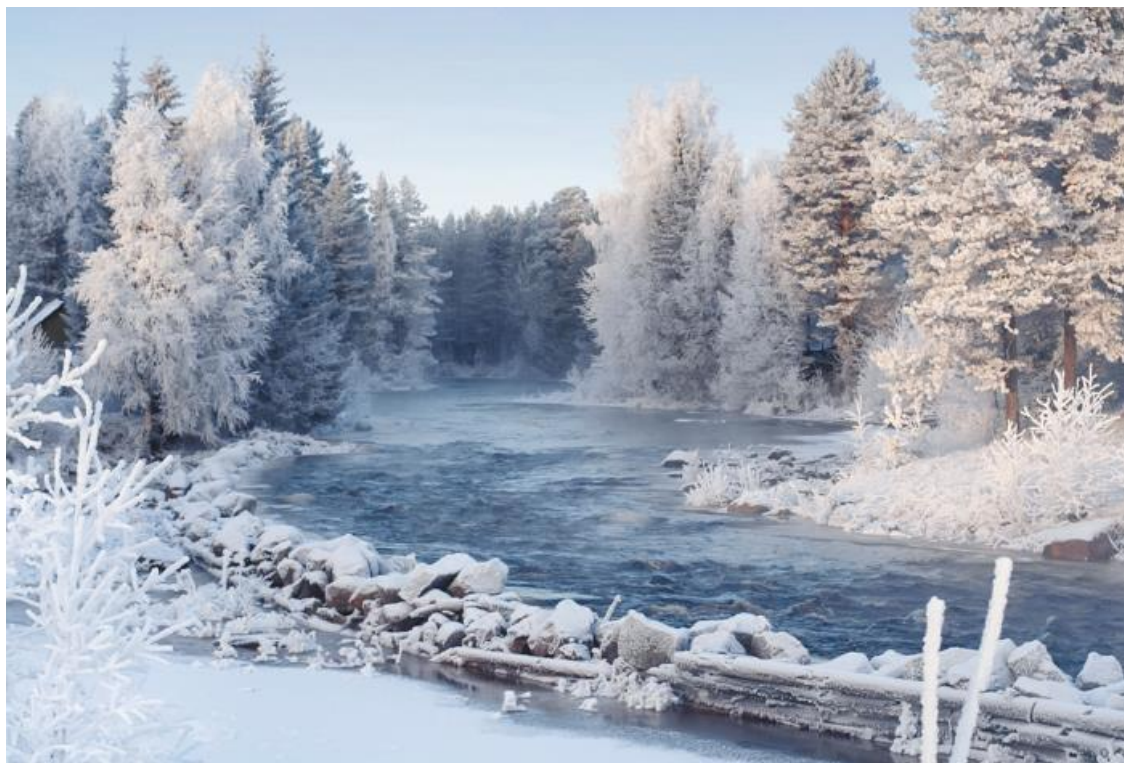
Зима. Приток Ангары.