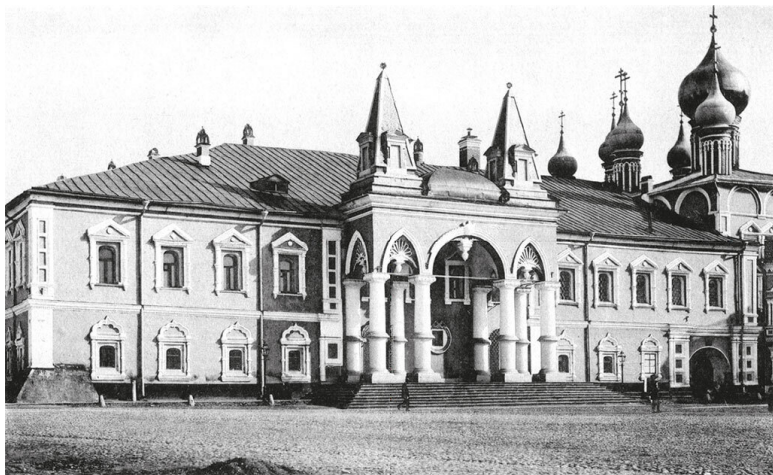
К. Фишер. Здания Чудова монастыря в Московском

Интересно, что в мире существует множество населенных пунктов с названием Москва. Лидируют Соединенные Штаты Америки – там их десятки. Также есть селение Moscow в Шотландии, основанное в память о победе над Наполеоном, район Moscou в бельгийском Генте, названный в честь русской армии, поселок с таким же названием в Индии, в штате Керала. Последний получил название в 1957 году в честь выборов первого коммунистического правительства штата.