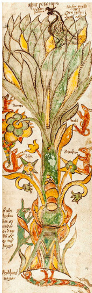
Иггдрасиль из богато иллюстрированного манускрипта