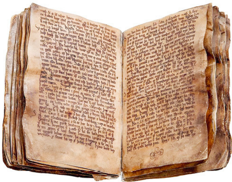
Разворот Codex Regius. Исландия. XIII век. «Королевским» он называется потому, что исландский епископ Бри-

вспомнят, что перед Рагнарёком наступит долгая зима, на исходе которой боги сойдутся в смертельной схватке с разного рода чудовищами. Впрочем, вы имеете полное право всего этого и не знать – тем более что нам будет недостаточно общих фраз для анализа представлений о смерти, которые содержатся в скандинавских мифах о сотворении мира и о его конце. Будем далее называть их космогоническим и эсхатологическим соответственно.