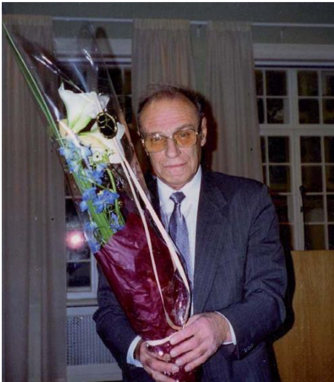
На презентации Большого Норвежско-русского словаря (2003). Словарь был признан в Норвегии лучшим двуязычным словарем года