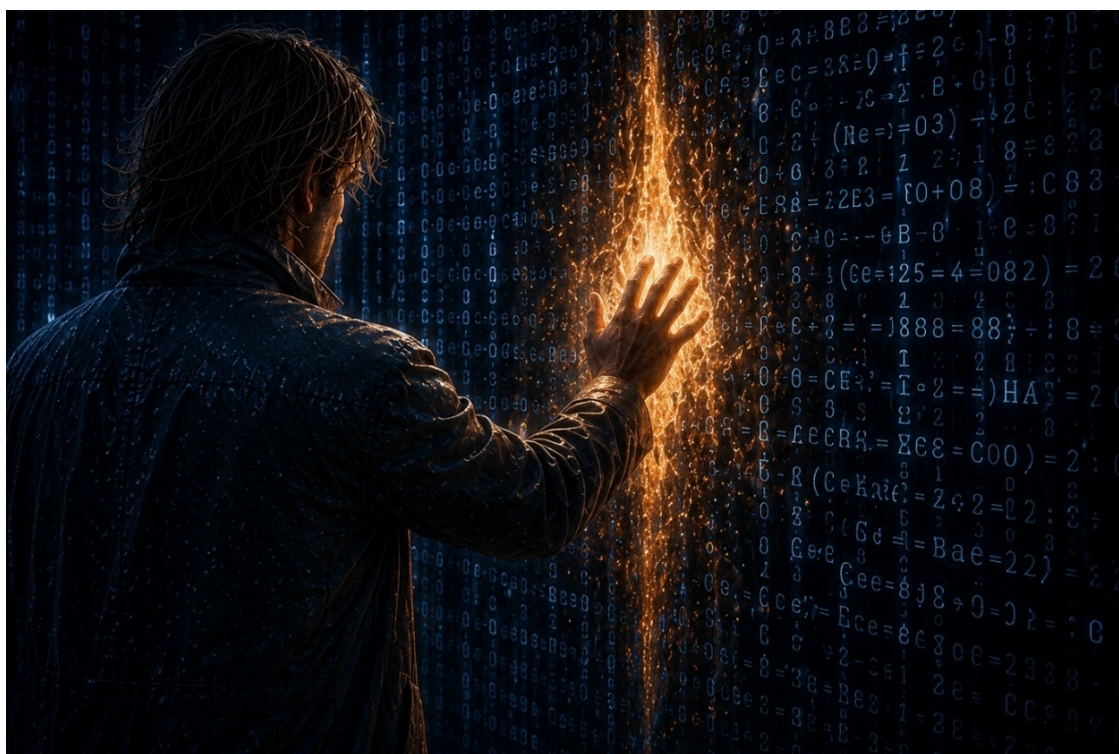
Иллюстрация «Чтение кода».

И нахожу то, что искал — уязвимость в архитектуре переулочка, точку, где два слоя кода наложены неплотно, где между ними есть зазор достаточно большой, чтобы сознание могло через него пройти, если это сознание достаточно хорошо понимает, как устроена система.