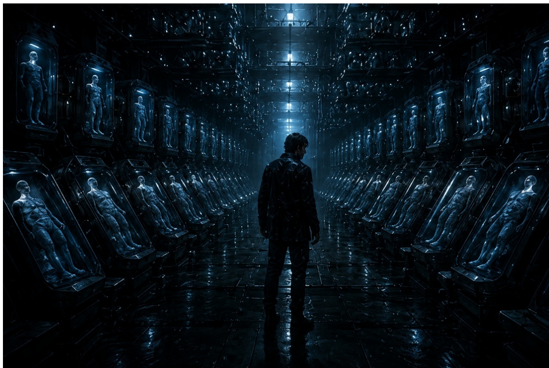
Иллюстрация «Зал архивированных сознаний».