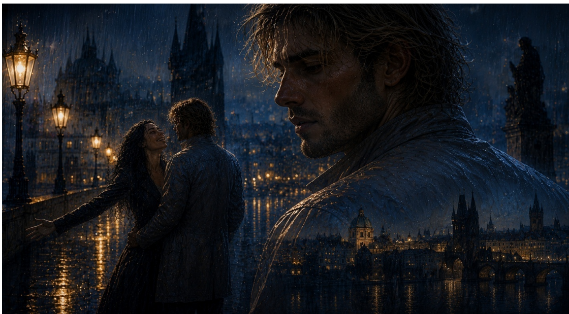
Иллюстрация «Под дождем в Праге».

Она вытащила его из квартиры без предупреждения — просто открыла дверь, поймала за запястье, не давая возможности возразить, потому что знала: начнёт возражать — найдёт тысячу причин остаться. Дождь уже шёл — жёсткий, неорганизованный, ноябрьский, капли падали под случайными углами, природа не обязана соблюдать математические принципы красоты. Он помнит первые секунды на улице: холод, прошедший сквозь куртку так, словно куртки не существовало. Вода просочилась в воротник. Стекала по шее. Он дрожал.