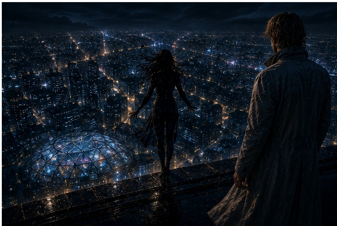
Иллюстрация «На крыше».