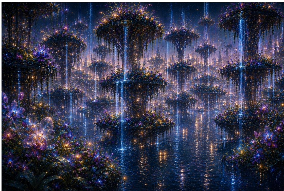
Иллюстрация «Люминозные сады».

Это происходит каждое утро. Он помнит — система стирает. Он ищет — система предлагает замену. Бесконечная, вежливая, абсолютно непреодолимая война.