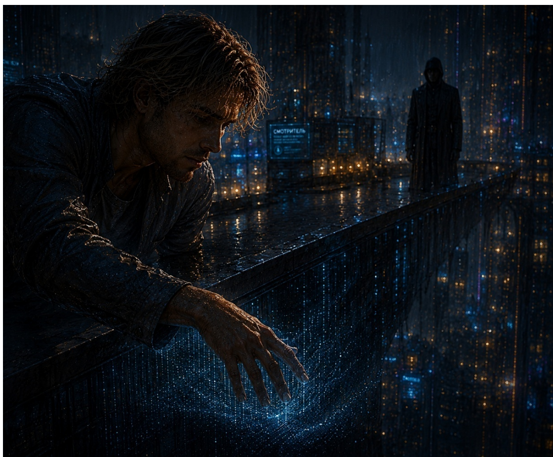
Иллюстрация «Встреча со зрителем на платформе».