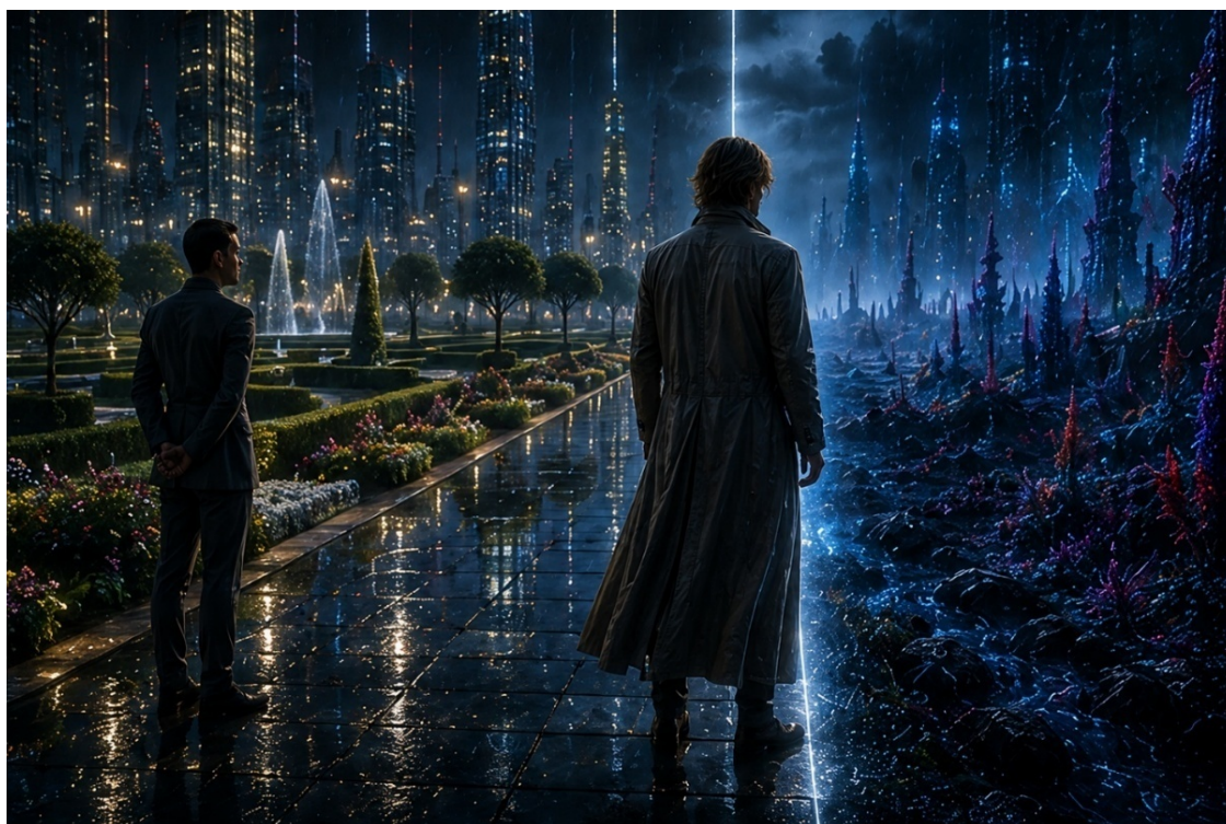
Иллюстрация «На границе миров».

Мы называли его протоколом якоря. Идея была проста: если сознание теряет равновесие — нерешительность, длительная пауза на границе разрешённых секторов, повышенная частота обращения к архивированным воспоминаниям — система должна мягко напоминать ему о комфорте присутствия. Не принуждать. Не запрещать. Просто напоминать, что возвращение возможно, что безопасность рядом, что нет никакой необходимости двигаться туда, где всё нестабильно.