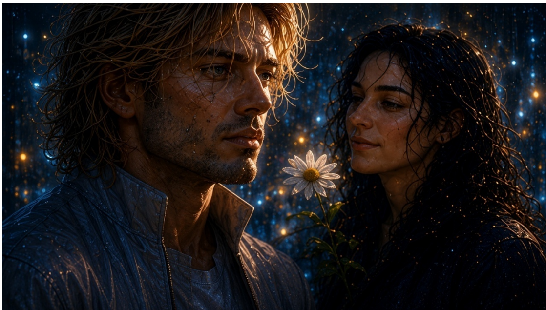
Иллюстрация «Женское лицо».

Оно появляется не в центре зрения, а на периферии — там, где внимание размыто и расслаблено, где система осуществляет наименее жёсткий контроль над входящими данными. Женское лицо, наложенное поверх одного из генетически откалиброванных цветков, материализующееся с такой отчётливостью, что Алекс на долю секунды теряет способность отличить восприятие от воспоминания.