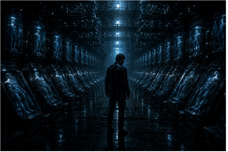
Иллюстрация «Зал архивированных сознаний».

каждом — форма. Человеческая форма, неподвижная, с закрытыми глазами, застывшая в позе, которая должна изображать покой, но является просто позой стазиса.