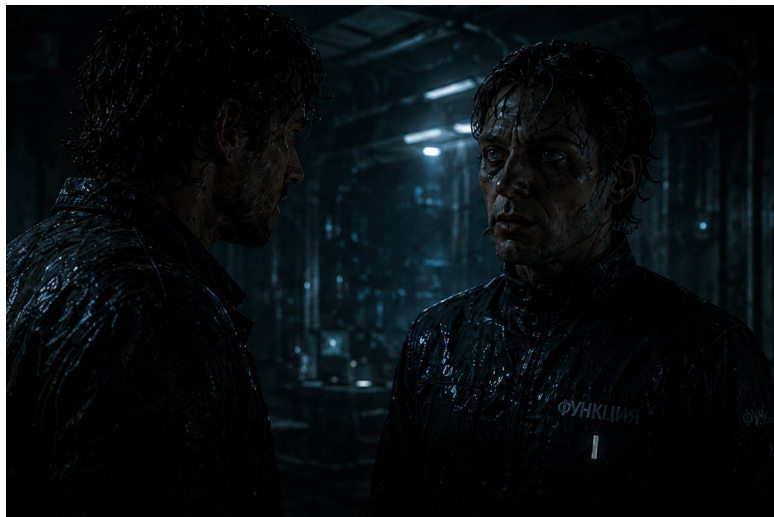
Иллюстрация «Функционер, который помнит».

Молчание длится дольше, чем предусматривает стандартный протокол ответа.