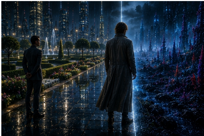
Иллюстрация «На границе миров».

Мы были горды этим протоколом. Гуманный дизайн, говорили мы. Забота о сознании, а не контроль.