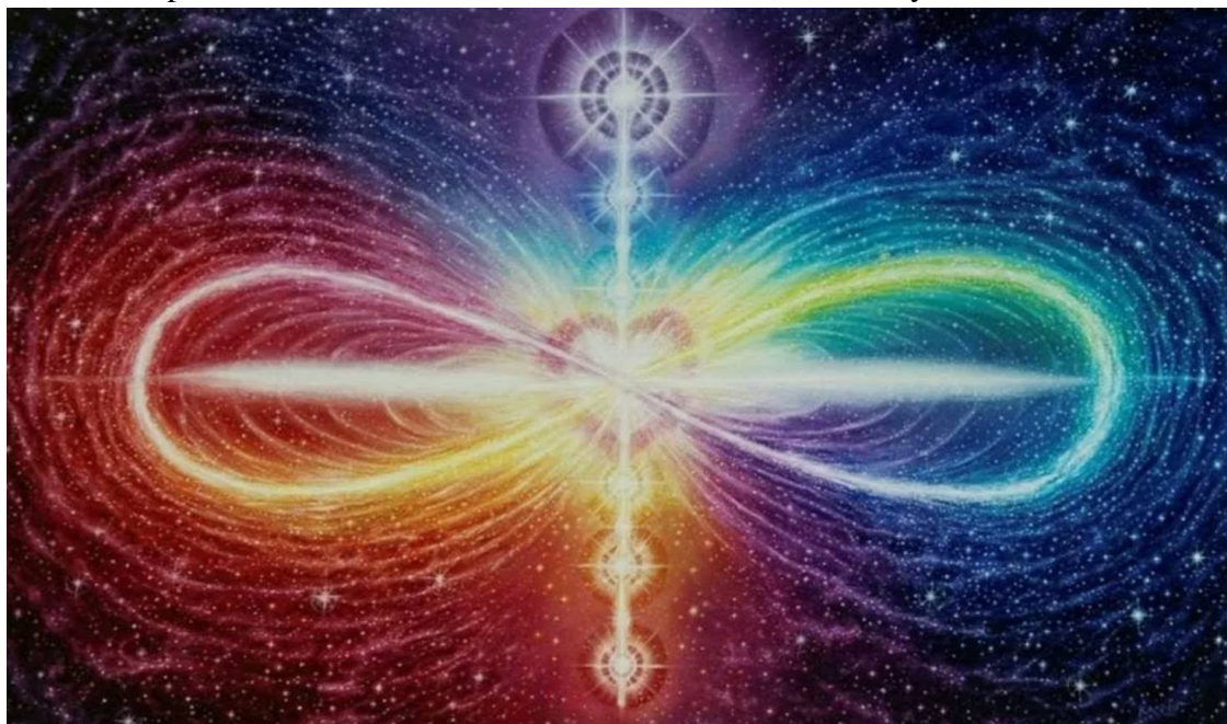
семь фундаментальных звёздных потоков Самого Света

— Договорились сын, - совсем мягко ответил Владыка, — ступай.