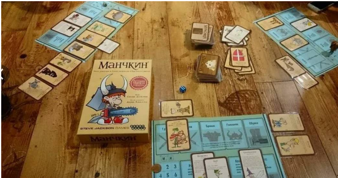
Манчкин - настольная игра

После душа они засыпают обнимая друг друга.