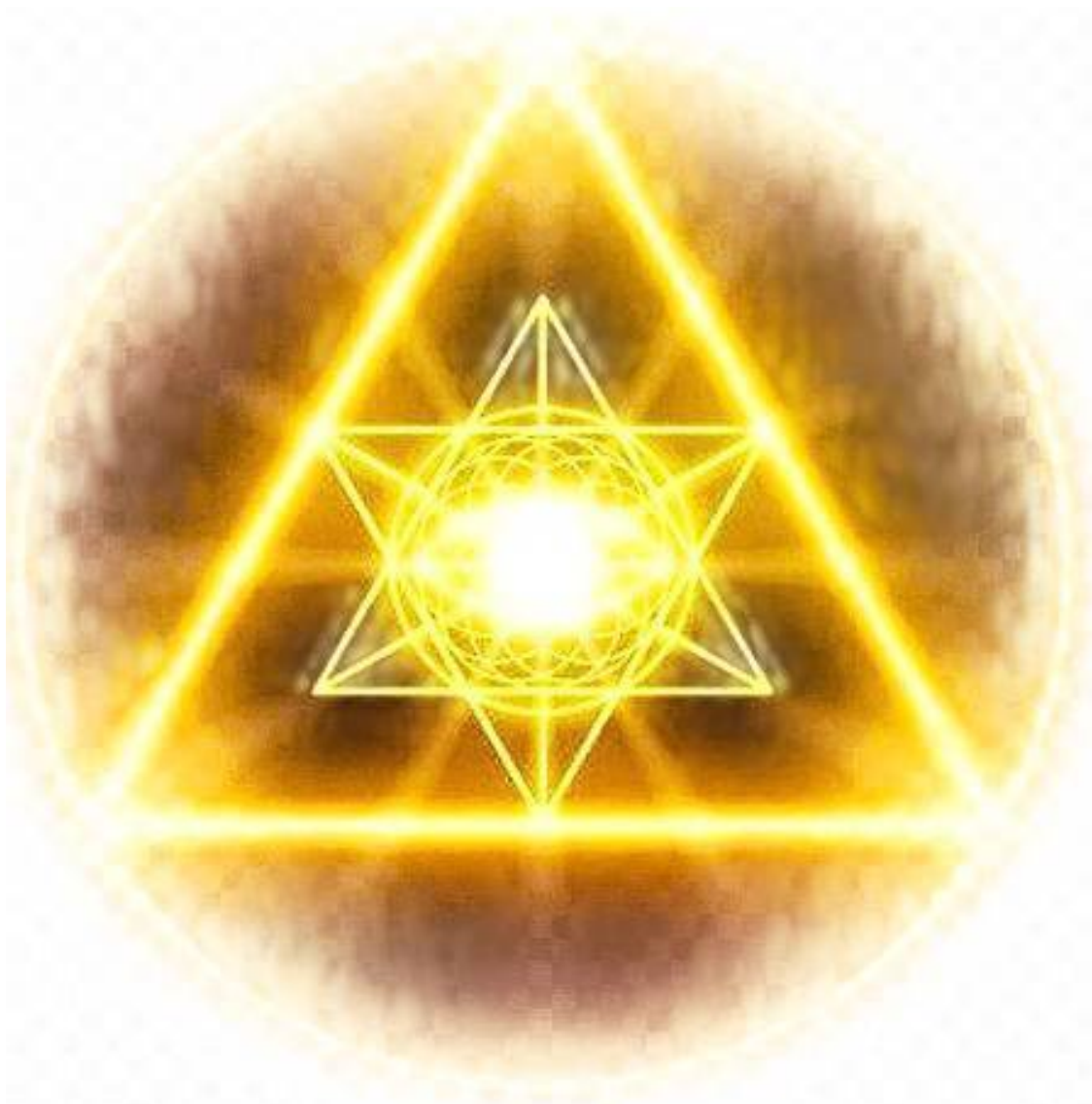
Примерно так выглядел Эквинокс - знак Самого Света