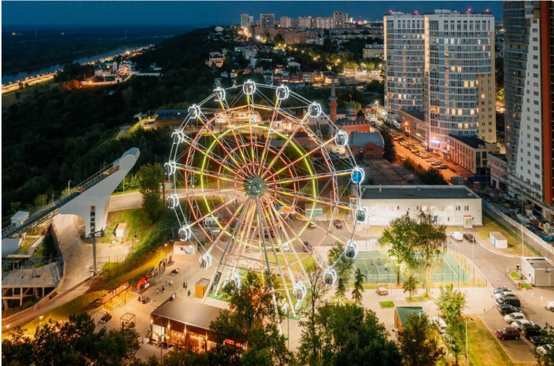
Колесо обозрения НиНо

— Да, - улыбнулась она чуть заметно. — Пойдём гулять. И мороженое я тоже хочу.