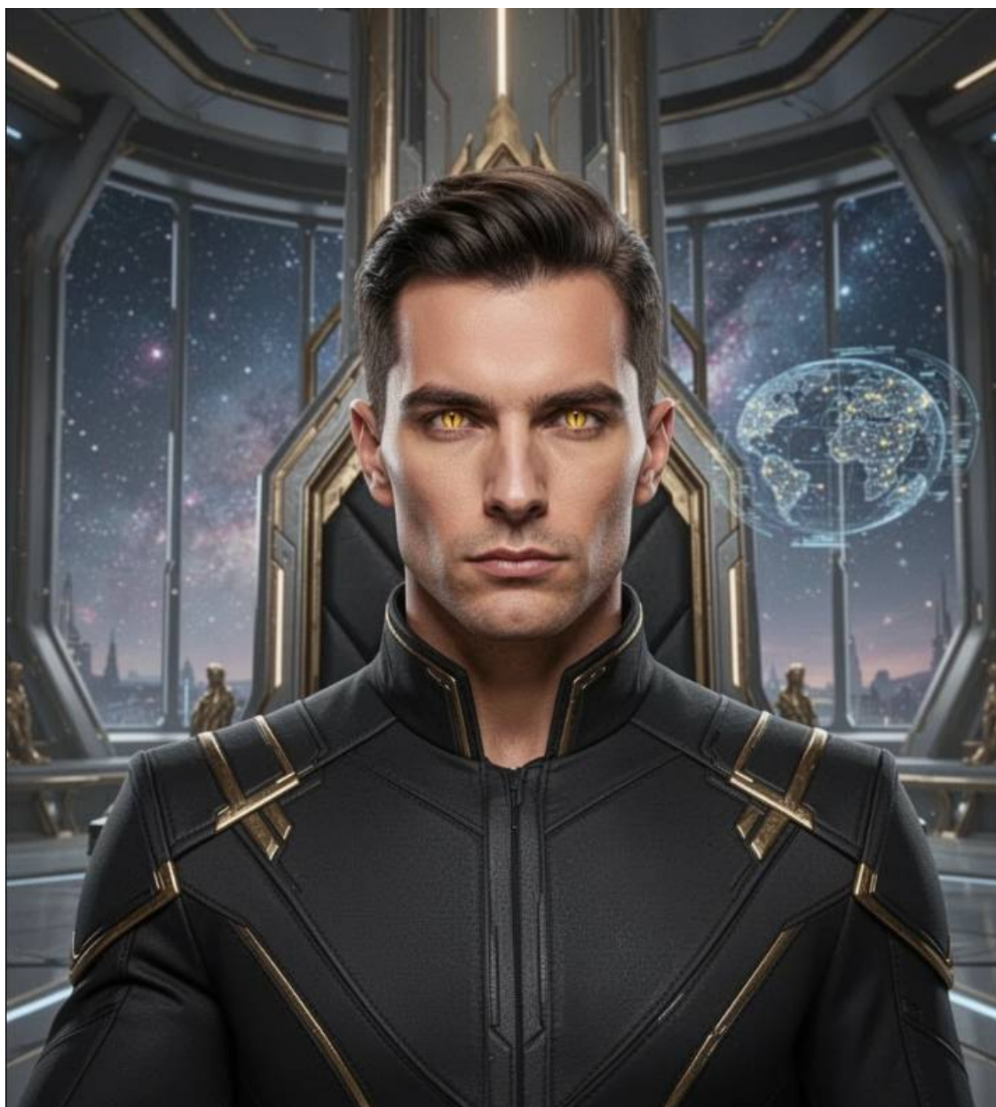
Примерно так выглядел Велимир, когда искал Свету в секторе Люмен Сол