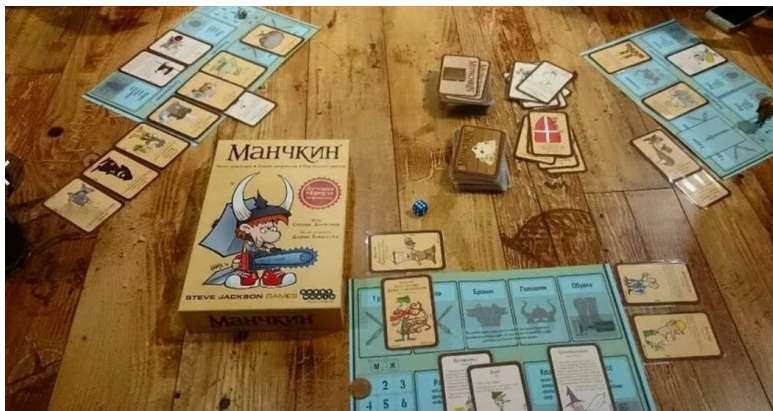
Манчкин - настольная игра