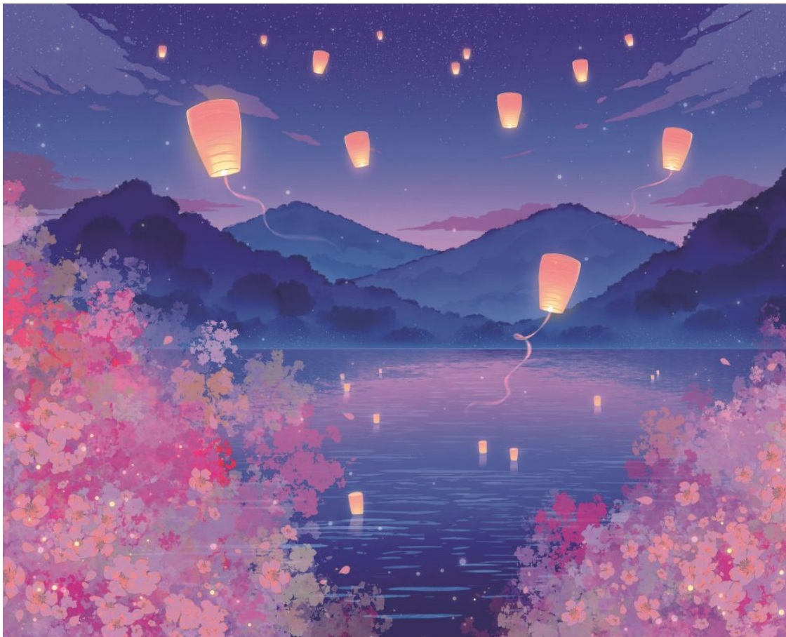
Иллюстрация на обложке от Zialron

Иллюстрации во внутреннем оформлении и на форзацах от JuVi