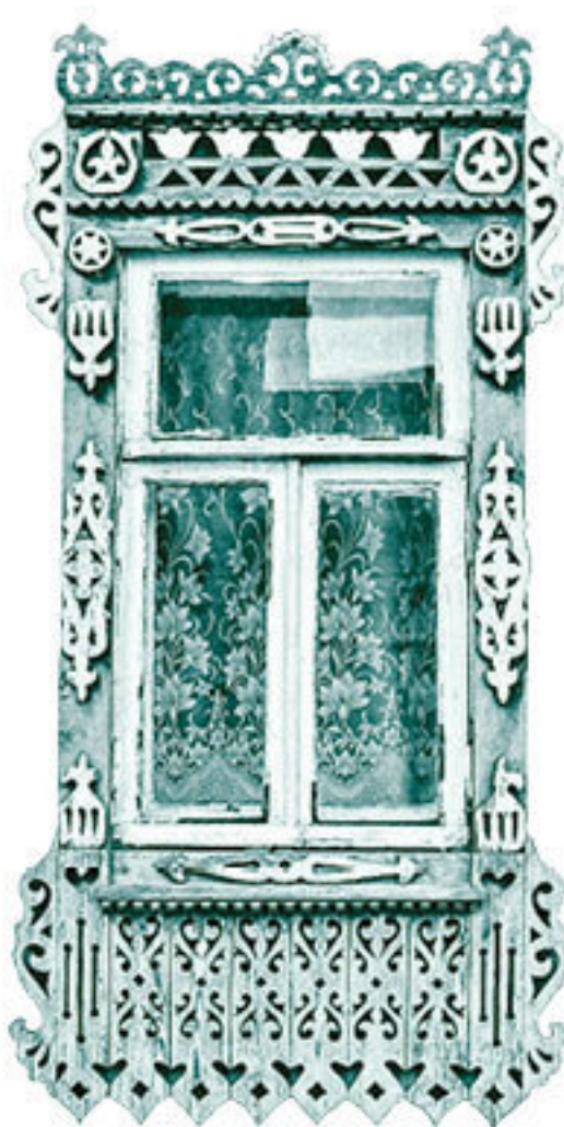
Фото автора. ФАБ: СТ