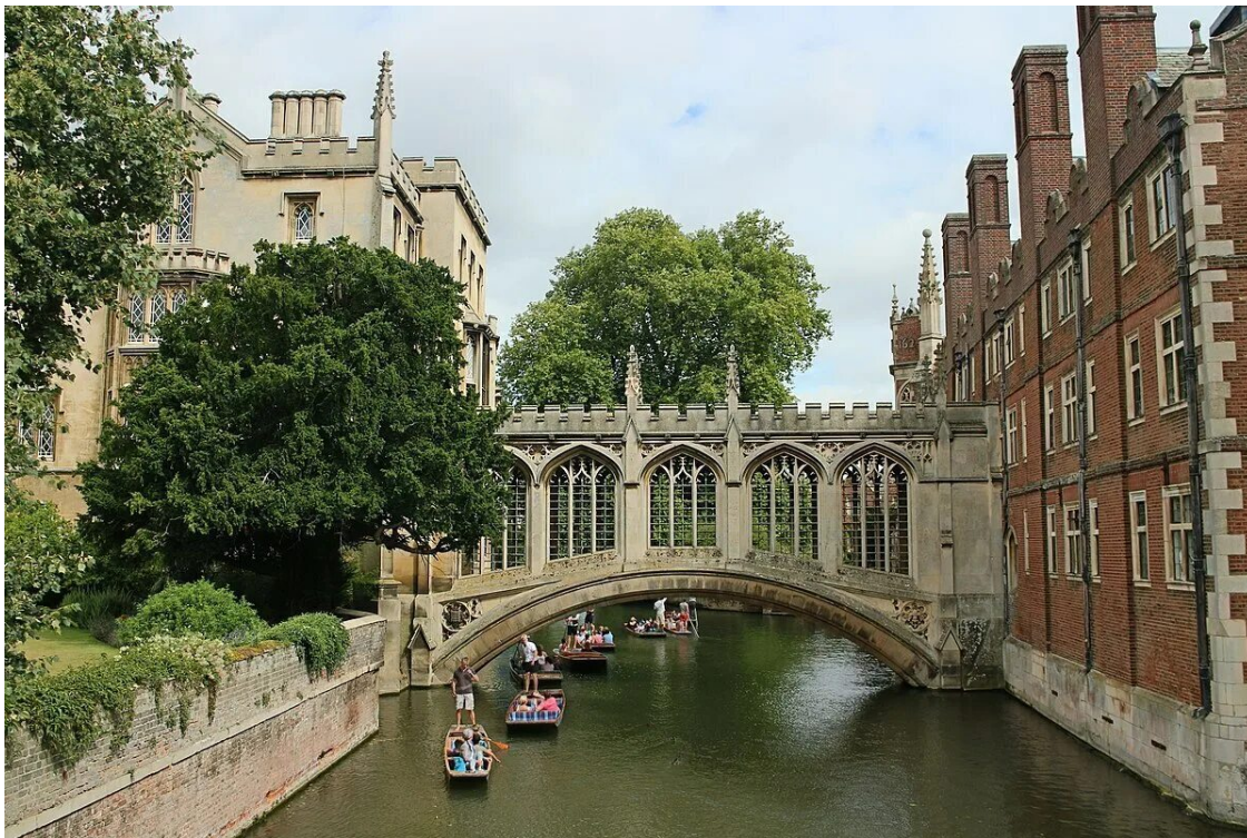
Крытый мост через реку Кэм между Третьим и Новым корпусами колледже Святого Иоанна в Кембриджском университете, Кембридж, Англия (мост Вздохов)

где сбываются мечты. Теперь арки, увитые каплями дождя, выглядели чужими, лишёнными очарования. В глазах больше не было слёз — только холодная ясность и сталь. Улыбка, если она ещё когда-нибудь появится на её лице, никогда не будет прежней. С этого дня в её жизнь не сможет проникнуть ни один обманщик, ни один человек, путающий искренность с игрой.