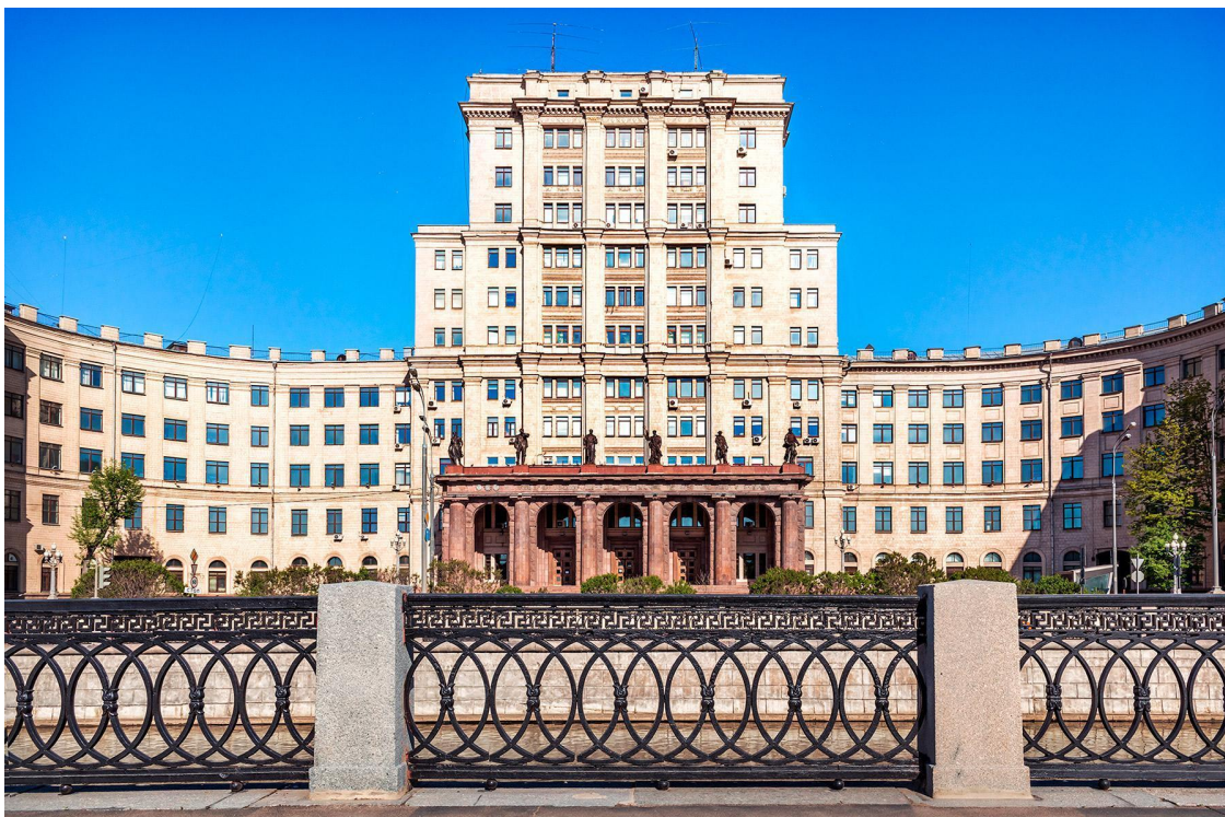
МГТУ им. Н.Э. Баумана