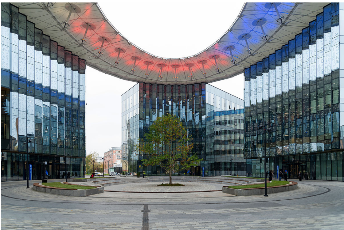
Кампус МГТУ им. Н.Э. Баумана

ЕСКД — Единая система конструкторской документации. Комплекс государственных стандартов, устанавливающих правила и требования к оформлению конструкторских документов (чертежей, схем, и т.д.)