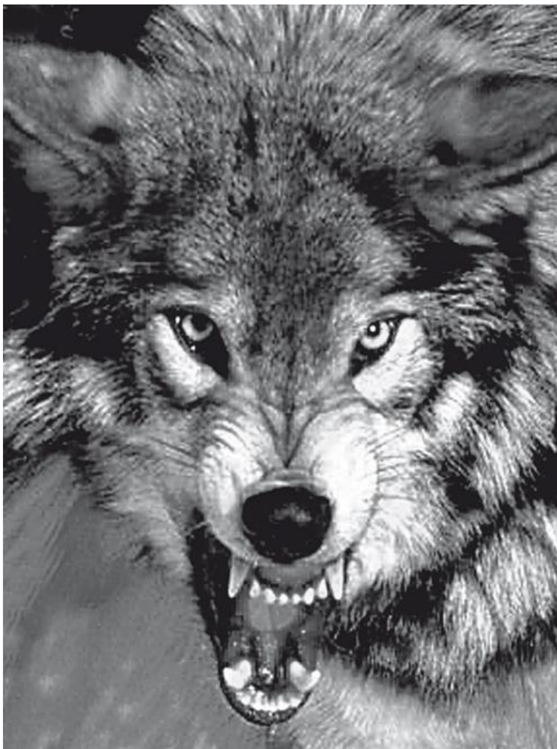
Серия «Экстремальный детектив»