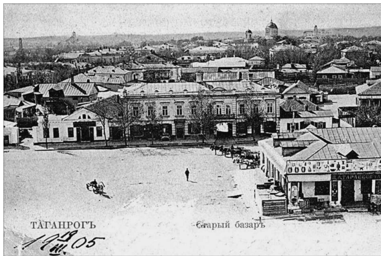
Вид Таганрога. Начало XX в.

Состоятельные горожане, помимо торговли, жили процентами с капиталов, крупными спекуляциями, доходами от сдачи в аренду домов и земли. Не гнушались они и контрабандной торговлей, в которой зачастую деятельное участие принимали сами городские власти.