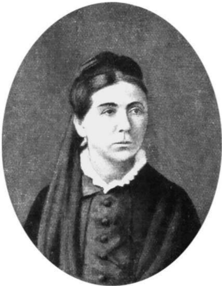
Евгения Яковлевна Чехова. 1881 г.