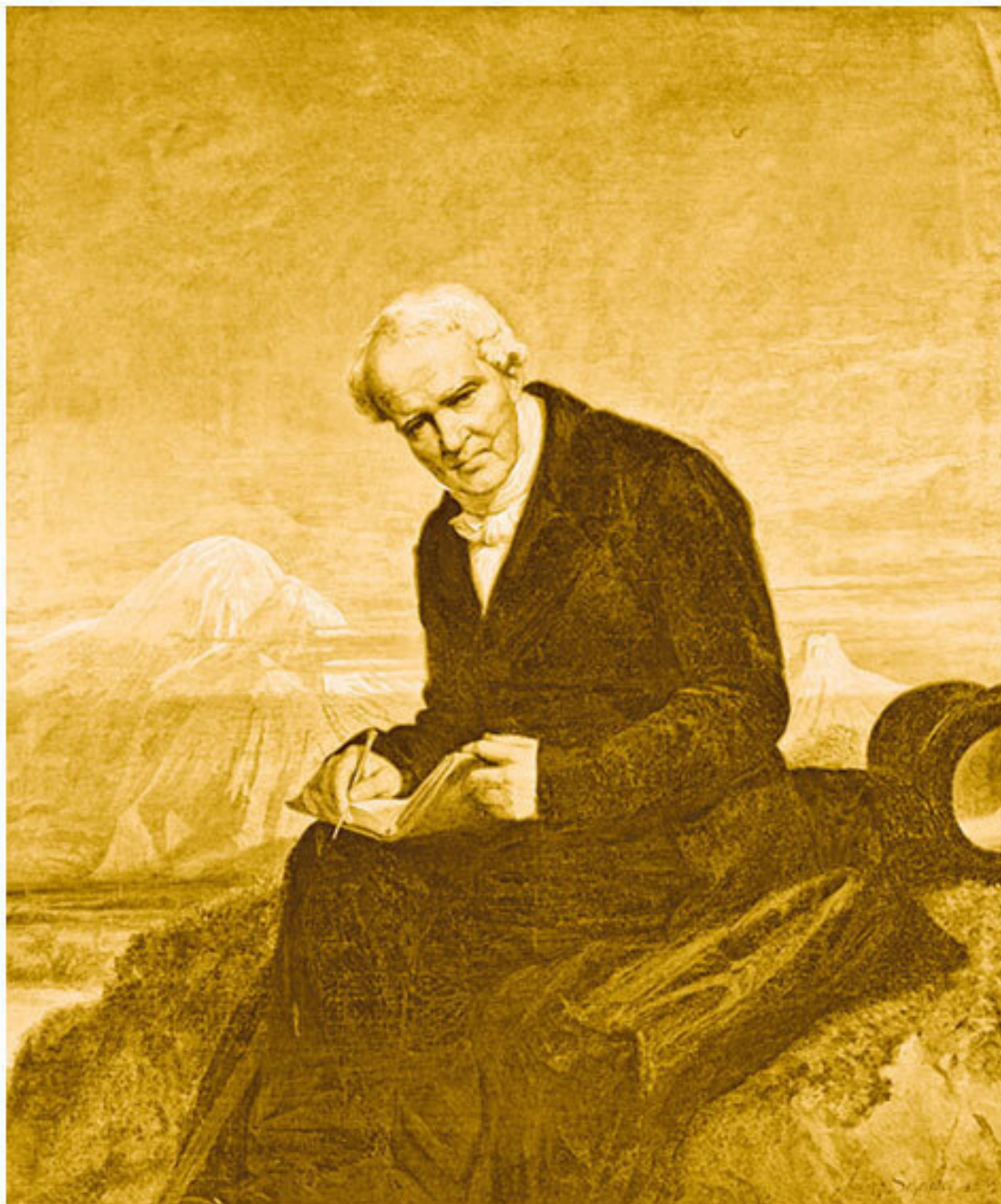
Барон Александр фон Гумбольдт. Картина Юлиуса Шрадера, 1859 г. The Metropolitan Museum of Art

Использование термина «ацтеки» вместо «мешики» можно отчасти объяснить необходимостью различать разные группы населения на территории, которую мы сейчас знаем как Мексику, после обретения страной независимости от Испании в 1821 г. Действительно, новожденное мексиканское государство ощущало необходимость в формировании национальной идентичности, распространяющейся на всех его граждан. В этом контексте слово «мешики» и производное от него «мексиканцы» стали использовать для обозначения всех жителей новой страны. В свою очередь, термин «ацтеки» начал применяться для обозначения жителей древней империи, основавших город Мехико-Теночтитлан, что позволяло проводить различия между коренными народами и метисным и креольским населением страны. Этимологическая связь слова «ацтек» с легендарным Ацтланом придает этому термину дополнительные культурные и мифологические значения, что свидетельствует о стремлении переосмыслить индей-