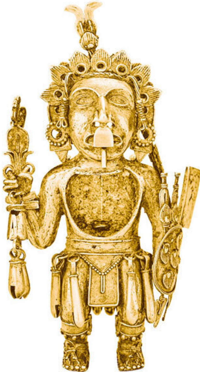
Фигура ацтекского воина. Тескоко, Центральная Мексика, ок. XIV–XVI вв. Cleveland Museum of Art

Поскольку наиболее важными занятиями ацтеков были военное дело и завоевательные кампании, неудивительно, что верхушку знати составляли воины. Особый статус имели те из них, кто принадлежал к ордену Орла, ордену Ягуара и ордену Стрел (так их именуют в некоторых европейских источниках с явной отсылкой к западным рыцарским военно-монашеским