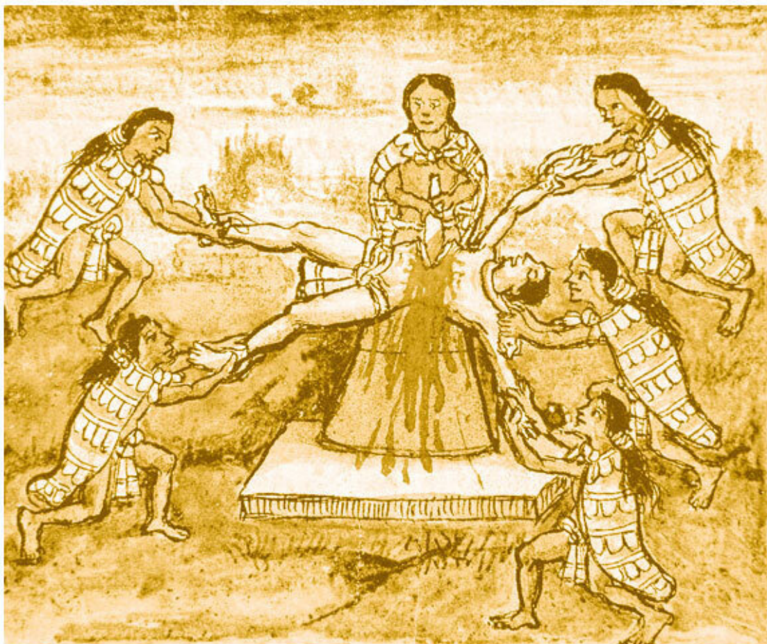
Жертвоприношение. Иллюстрация из книги Диего Дурана «История Индий Новой Испании и островов материка», 1579 г.

Важной концепцией космогонического мифа у ацтеков стала динамика космоса, метафорически представленная в сюжете о битве богов, таких как Кецалькоатль и Тескатлипока, олицетворяющих великие противоположности. Сражение привело к возникновению четырех Солнц, или эпох космоса. Как отмечает Мигель Леон-Портилья, эти божества символизируют силы в состоянии напряжения и неустанной борьбы, что отражает сам процесс творения. В результате друг друга сменяют различные космические циклы Солнца, происходит упорядочение пространства и времени как составных частей единого процесса. Центральная идея заключается в том, что Вселенная была создана богами для жизни человека. Этот процесс циклический, сочетает созидание и разрушение. В результате постепенно возникают важнейшие элементы, каждый из которых связан с космическим порядком: звезды, животные, растения и, наконец, человек как кульминация космогонического процесса, что олицетворяет начало эпохи Пятого Солнца, в которой и жили ацтеки 17 .