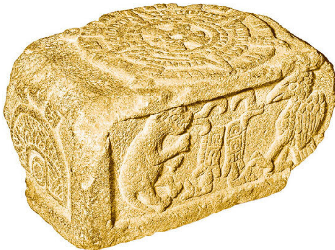
Алтарь воина Солнца. Пуэбла, Мексика, ок. XV–XVI вв.

Вторая эпоха, или Солнце Ветра (Эхекатонатиу, Ehecatonatiuh), была разрушена, согласно своему названию, сильным ураганом, а те люди, которых не унесло ветром, превратились в обезьян. Этот период продлился 364 года.