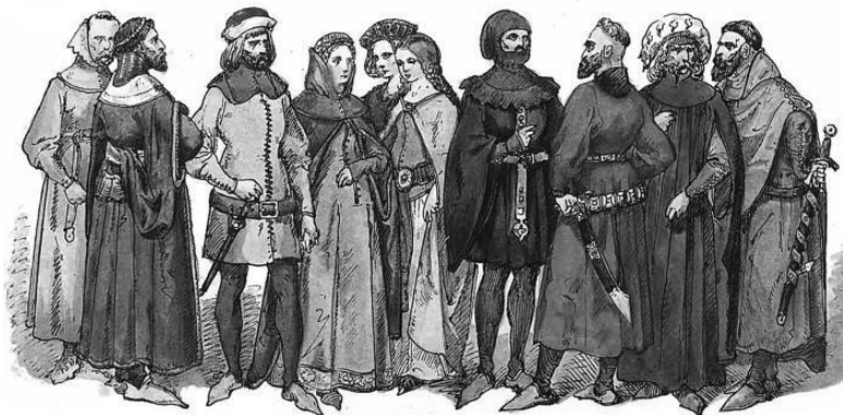
Польская шляхта в 1333–1434 гг. Художник Я. Матейко

менем образовавшее или привилегированное сословие «землян», впоследствии отождествленных со шляхтою, или же полупривилегированное сословие бояр панцирных и путных 8 . Земляне, составлявшие главный контингент войска, отличались замечательною приверженностью к вере и старым традициям, почему и сохраняли дольше князей и панов правослаvie и остатки русской культуры.