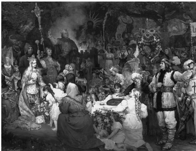
Крещение Литвы. Художник В. Цесельский

кам, но имеют собственные письменна» 16 .