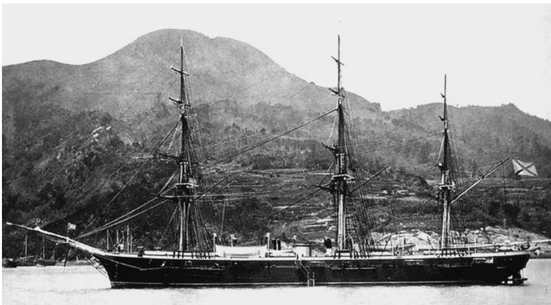
Учебный парусник «Скобелев»