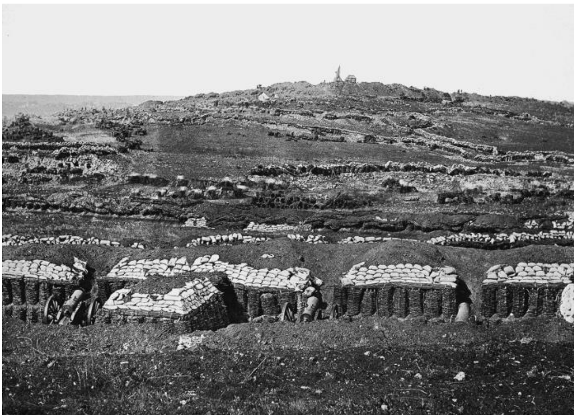
Вид Малахова кургана с форта Мамелон после окончания осады. 1855 г.

За столом, сколоченным из старых, но крепких корабельных досок, накрытых льняной скатеркой, сидели под виноградной сенью гость и хозяин дома. Мальчиков посадили рядом, заставив Степку отмыть руки с мылом. У Саши ладони тоже почему-то оказались в ржавчине, глине, черной смоле... Он с восторгом оглядывал крохотный дворик и домик, как бы нависший над бухтой и городом. К тому же, как пояснил Степка, под черепицей жили белки, воровавшие у деда и у соседей грецкие орехи, а на самой кровле грелись зобастые ящерицы-гекконы, похожие на маленьких китайских дракончиков.