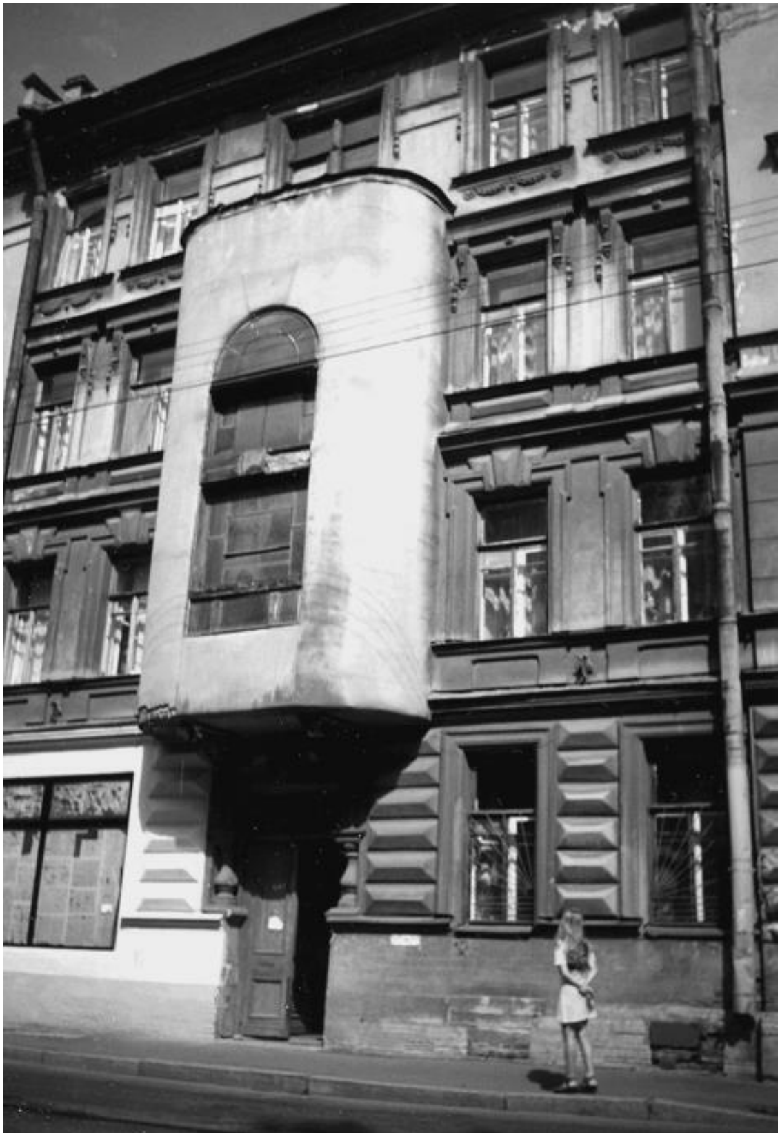
Дом № 3 по ул. Большой Зелениной в Санкт-Петербурге, где квартировала семья А.В. Колчака накануне Первой мировой войны. Фото 2000 г.

Право, доска бы эта смотрелась на этой ветхой стене, как драгоценный орден на жалком рубище.