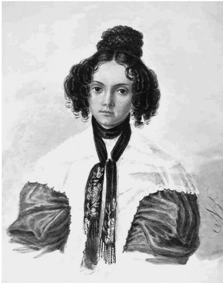
Мария Николаевна Волконская. Акварель Н.А. Бестужева.