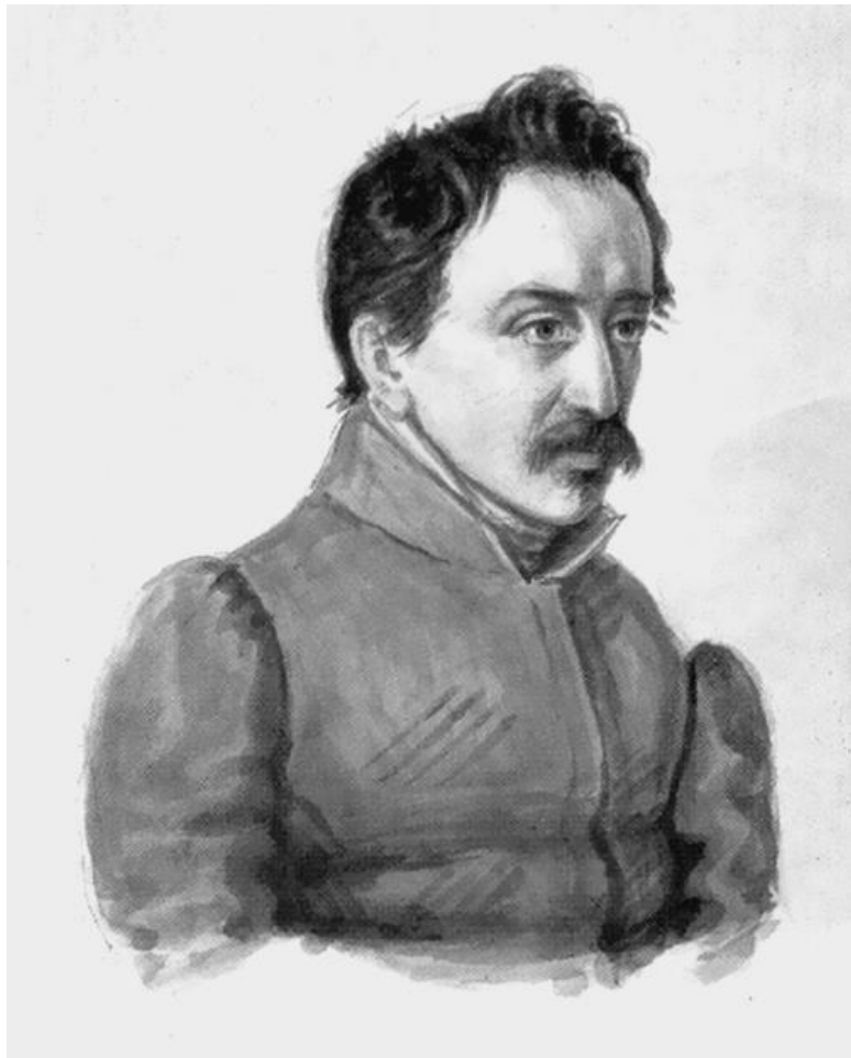
Князь Сергей Григорьевич Волконский. Акварель Н.А. Бестужева