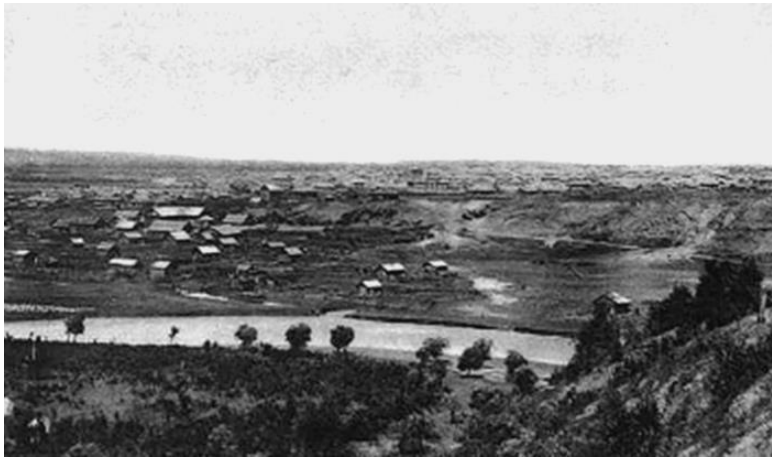
Чита. Часть в которой жили декабристы. Фото конца XIX – начала XX вв.

Осужденные трудились с 6 часов утра до 9 часов и с 17 до 19 часов. Эта работа была значительно легче той, что была на рудниках. Все мужчины были физически сильными. Сергей Григорьевич Волконский, несмотря на ноющие раны, постепенно, как и другие, привыкал к тяжелой каторжной работе, но спокоен не был: что-то ложилось тяжестью на душу. Тяжким было бессмысленное существование, нерастраченные умственные возможности и слабая надежда на избавление – вот что делало жизнь мрачной, бесцельной, беспросветной.