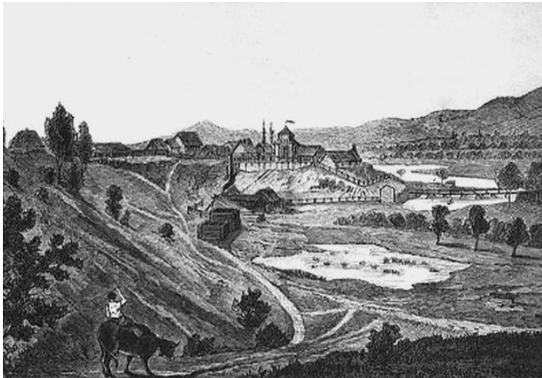
Чита. Вид по дороге в Иркутск. Фото конца XIX – начала XX вв.

Однако исправить сибирский климат женщины были не в силах. Суровые зимы затрудняли общение заключенных с их женами.