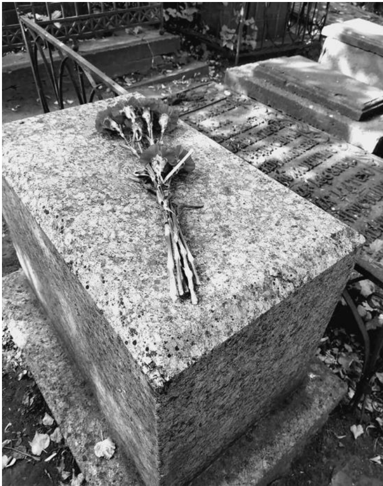
Захоронение Николеньки Волконского, которое удалось отыскать автору этой книги на Лазаревском кладбище в