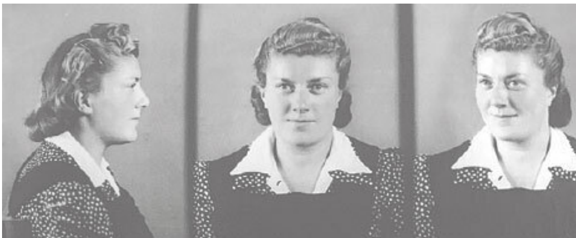
СЕСТРА АНГЕЛА: узница-немка, заключенная в тюрьму за «оскорбление фюрера». Депортирована в Освенцим в марте 1942 года. Кастелянша больницы. Умерла 23 декабря 1944 года.