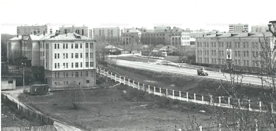
Детский корпус (1972 год)

собственного гаража на несколько десятков машин. Стала функционировать станция скорой помощи с организацией специализированных бригад. Значительно выросла и укрепилась участковая терапевтическая сеть, как основа медицинского обслуживания населения.