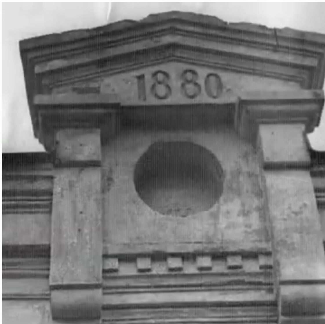
Фронтон старого здания

Вот ещё сведения о первоначальном устройстве: "Верхний этаж больничного здания вмещал две мужские палаты на 24 койки и контору; нижний этаж - женскую палату на 12 коек, две арестантских палаты на 6 коек и кухню. Всего в больнице было 42 кровати".