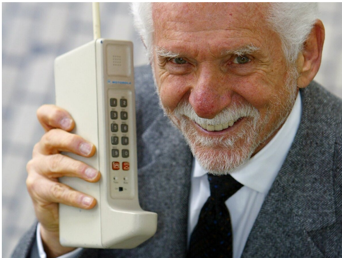
Motorola DynaTAC 1973 год.

А потом производство мобильных телефонов так ускорилось и усовершенствовалось, что люди вынуждены были менять эти телефоны каждые 3-5 лет. И модели, за которыми все гонялись и платили немалые деньги через несколько лет становились старомодными, маломощными и в результате ненужными.