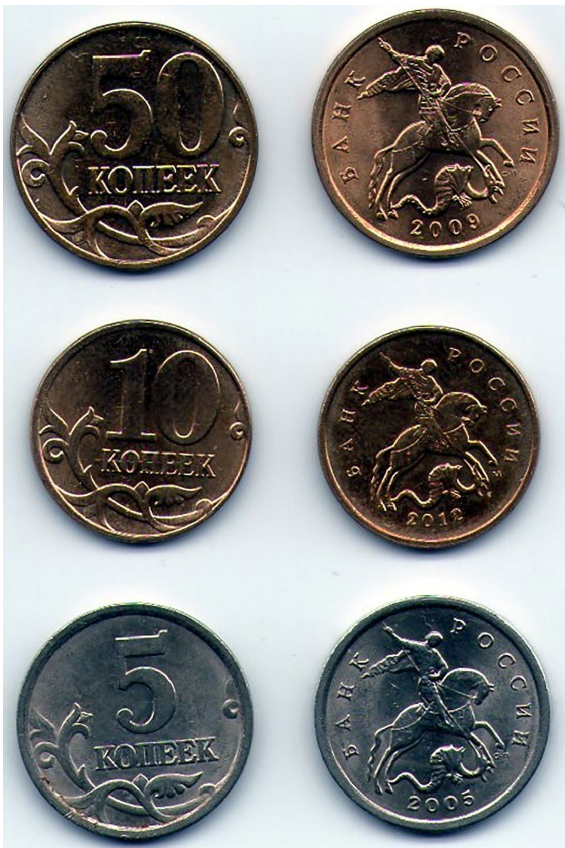
Рис. 2. Изображение Св. Георгия, побеждающего дракона, на монетах Банка России