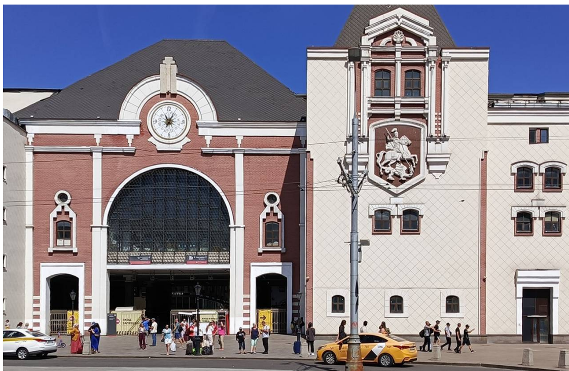
Рис. 4. Герб Москвы на здании Казанского вокзала, Москва

В известном эпическом произведении «Беовульф» описываются многочисленные сражения героя с драконами на территории Дании, Англии и Швеции. Беовульф был исторической личностью, и родился в 502 году от Р. Х.