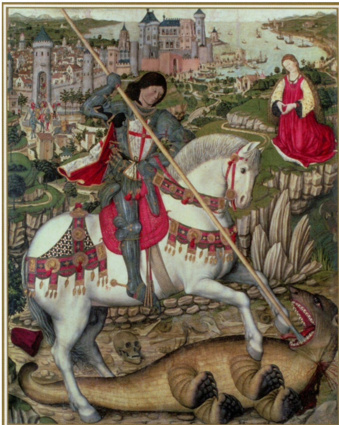
Рис. 3. П. Нисарт. Св. Георгий и дракон. XV в. Епархиальный музей Майорки (Museo Diocesano de Mallorca), Испания