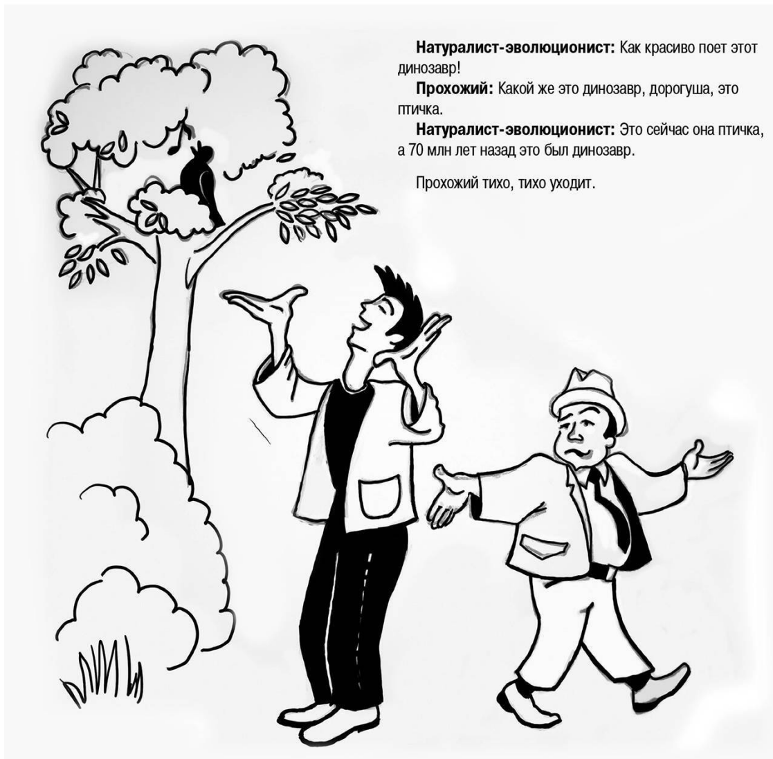
Рис. 1. Поющий динозавр — это не плод моего воображения. Вот цитата из одной популярной книги о динозаврах: «Захватывающая палеонтологическая летопись показывает, как маленькие пернатые хищные динозавры (так называемые тероподы) превратились в птиц около 160 млн лет назад, и сегодня у нас есть неоспоримые доказательства того, что птицы являются динозаврами. То, что птицы являются динозаврами, — важный факт. Он означает, что о вымирании динозавров нужно забыть. Они не вымерли» (курсив мой. — И. С.) [2, с. 6]. И очень современно выглядит этот рисунок с намеком на...

Более того, постоянно проводится мысль, что динозавры — это животные-маркеры, ненавязчиво «доказывающие» своими останками, что Земля стара, что «эволюция» шла постепенно, но уверенно, и на смену динозаврам пришли млекопитающие, а потом уже, спустя несколько миллионов лет, появился и человек. Но так ли это? Обратимся к фактам. Их можно разбить на пять больших групп.