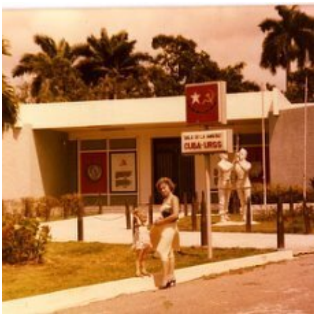
Гавана. Музей кубино – советской дружбы.

- Да очень просто – идёшь по улице, смотришь, а тени нет твоей, поднаклонился, а она внизу под ногами, ха – ха... Значит точно тропики!