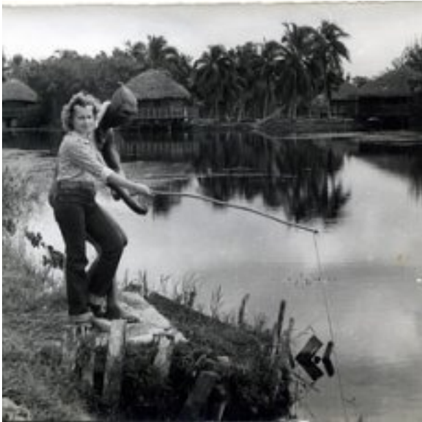
Куба. В индейской деревне.

В начале пятнадцатого столетия, а точнее в 1492 году к острову подошла экспедиция Христофора Колумба и вскоре появляются первые европейские поселенцы. Однако, европейцев на Кубе никто не ждал и их встретил жёсткий отпор со стороны индейцев. Командовал индейцами великий вождь Атуэй, который объединил местные племена и восстал против поселенцев и их командующего Веласкеса де Ку-