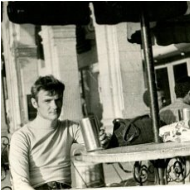
Гавана. Пивной бар у Капитолия.

Да, жара, а вот и спасательный пивной бар, притаившийся впереди, закрытый невысоким бетонным забором и с такими же бетонными столиками внутри. Подойдя к стойке Игорь увидел спасительные трехсот тридцати граммовые бутылочки коричневого стекла тоже в бетонной ванне с водой и большими кусками льда. Игорь с улыбкой на всю ширь произнёс: - Дос, компаньеро, сарбэсо!