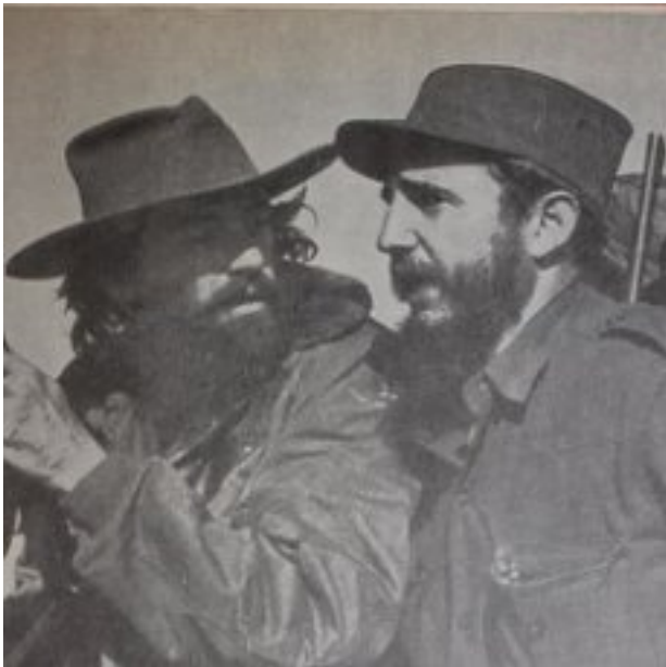
Сьенфуэгос и Кастро.

Где то, так друзья, а дальше нет смысла вас утомлять, так как всё вам знакомо по истории современной Кубы. Многие из вас уже побывали на Кубе будучи туристами, другие собираются поехать или мечтают это сделать. Мы тоже мечтаем побывать ещё раз на острове Зари багровой! Всё, пока!