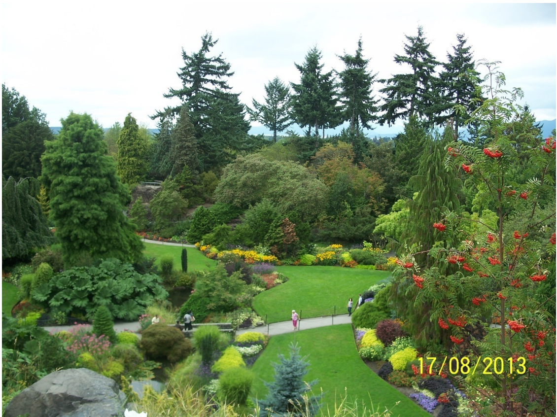
НА ЗЕЛЕННЫХ ГАЗОНАХ ВАНКУВЕРА