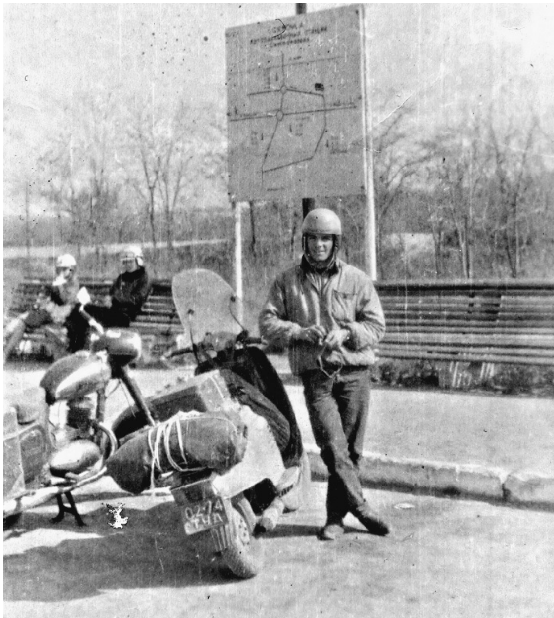
Симферополь, май 1967 года.

Перед Симферополем я остановился в посадке. Ночевать в городе неудобно, ехать ночью по горам не хотелось, я должен был увидеть их при дневном свете. Я надул свой матрасик, поужинал яйцами с луком и хлебом и лёг спать.