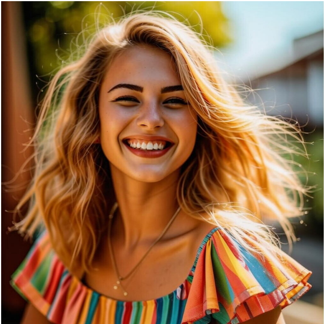
Мажена , литературный псевдоним – Лола Занзер, ведьма Ветров Асгард, цвет: синий.