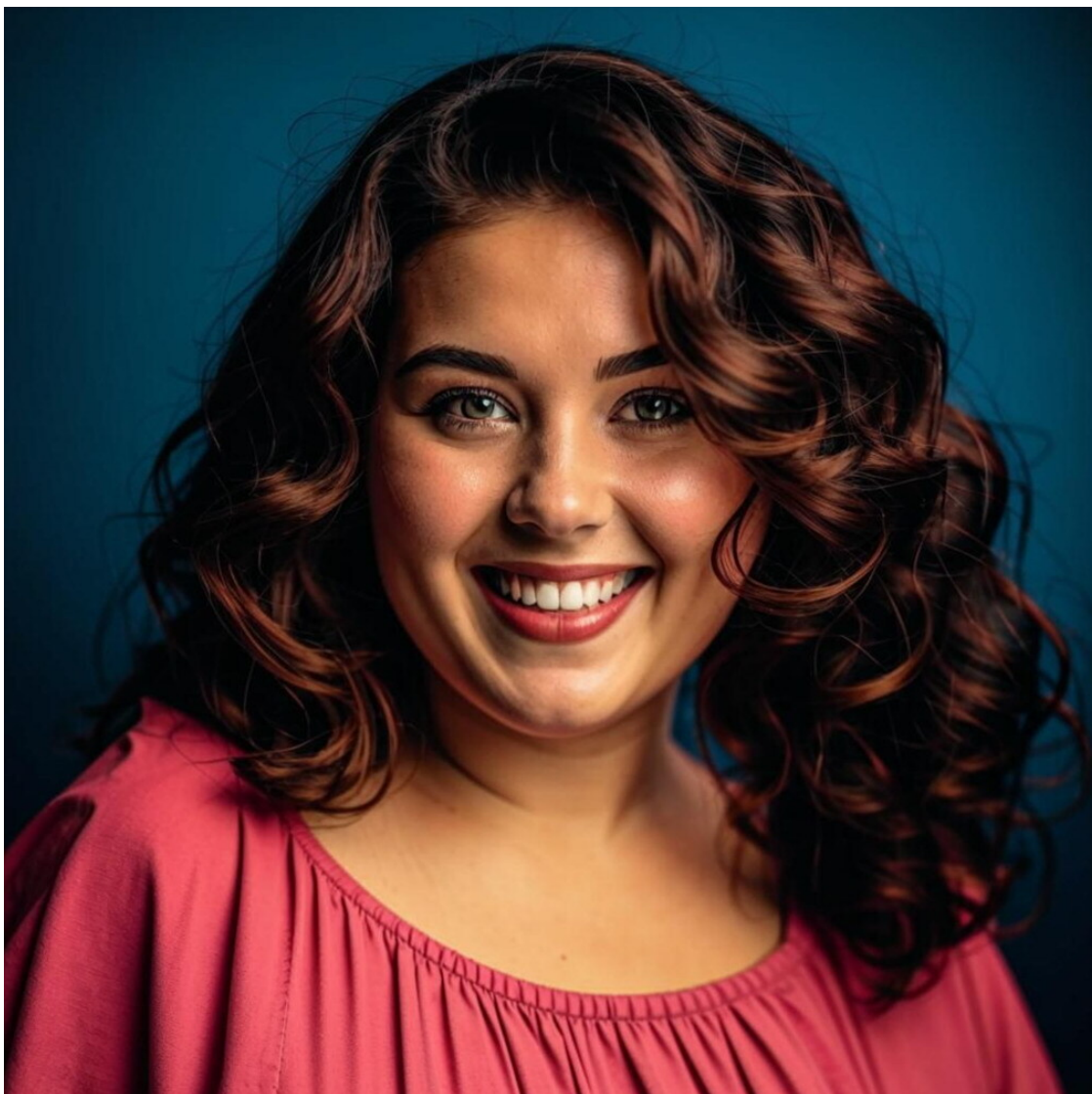
Марта Ланевская , литературный псевдоним – Изольда Макфорлейн, ведьма Заката Лорейн, цвет: фиолетовый.