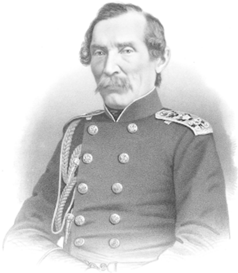
Евфимий Васильевич Путятин

Кавадзи – опасный противник. Гончаров от него в восторге и описал в нескольких корреспонденциях! Высокого ро-