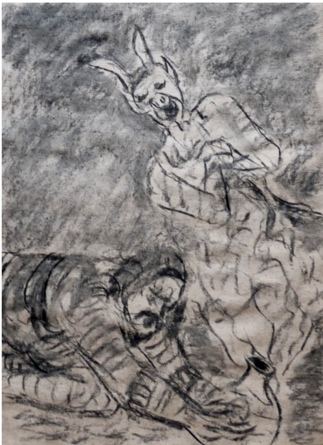
«Хромой бес» лист 2