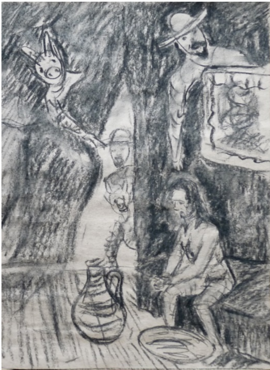
«Хромой бес» лист 3