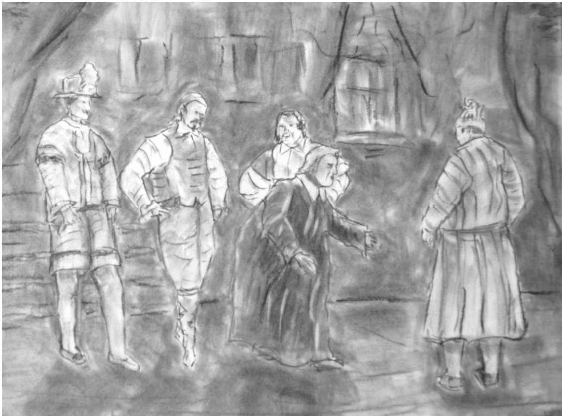
«Мещанин во дворянстве» лист 7