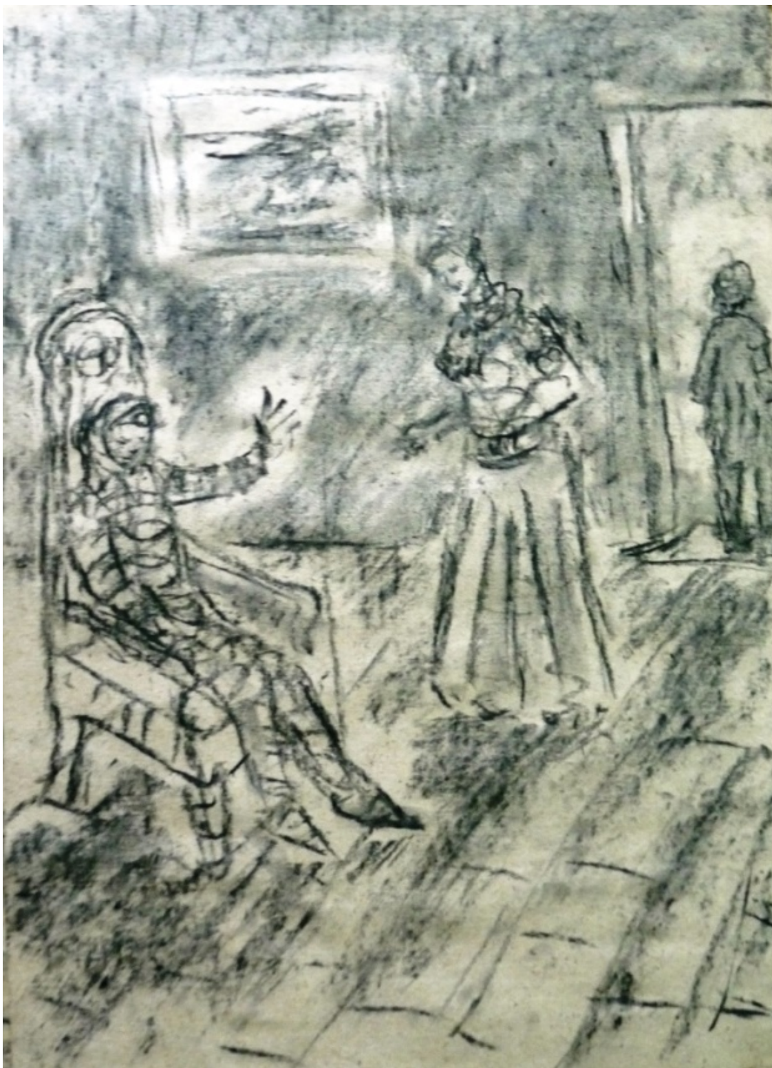
«Кандид» лист 2