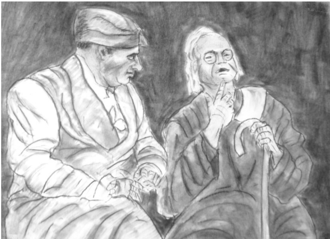
«Мещанин во дворянстве» лист 8