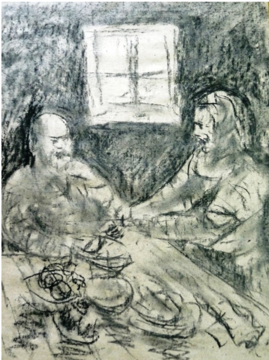
«Кандид» лист 4