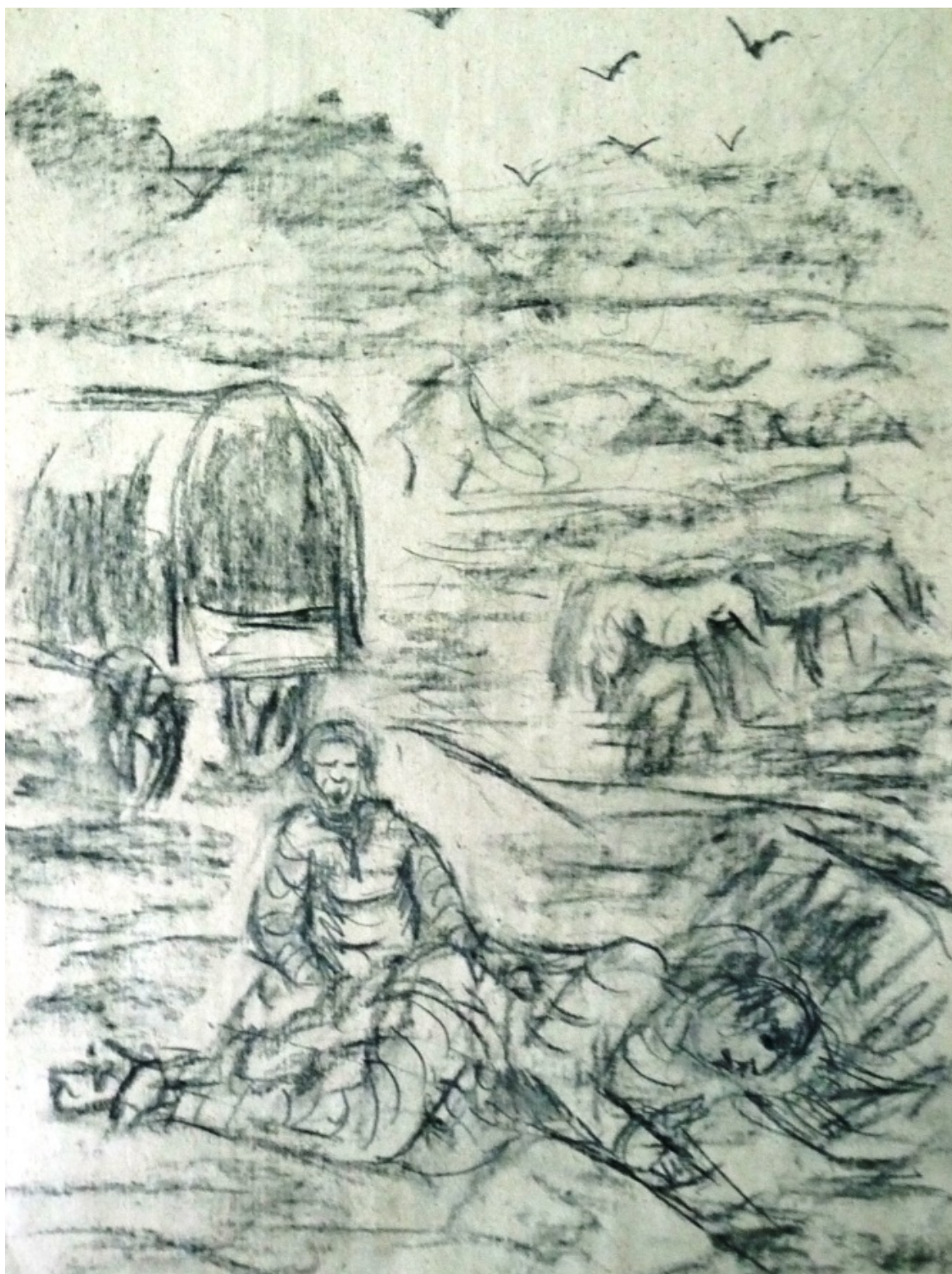
«Манон Леско» лист 4