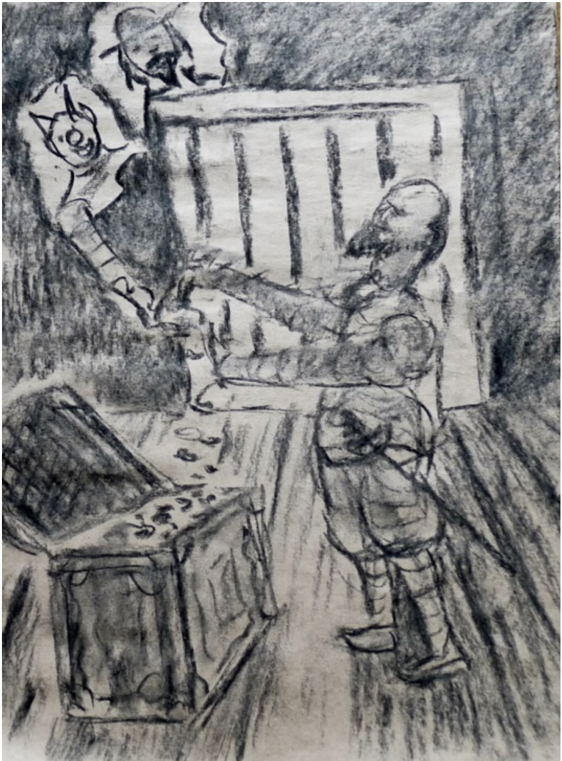
«Хромой бес» лист 4