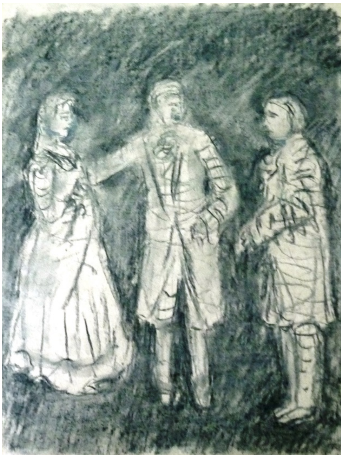
«Манон Леско» лист 1