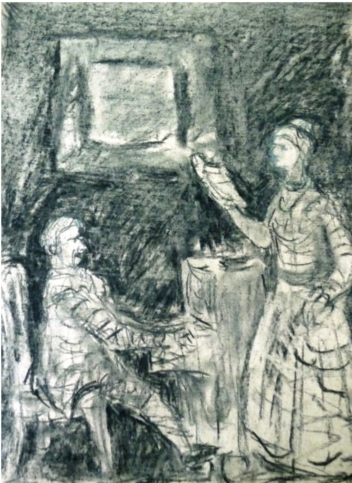
«Манон Леско» лист 2