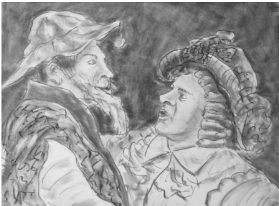
«Мещанин во дворянстве» лист 1