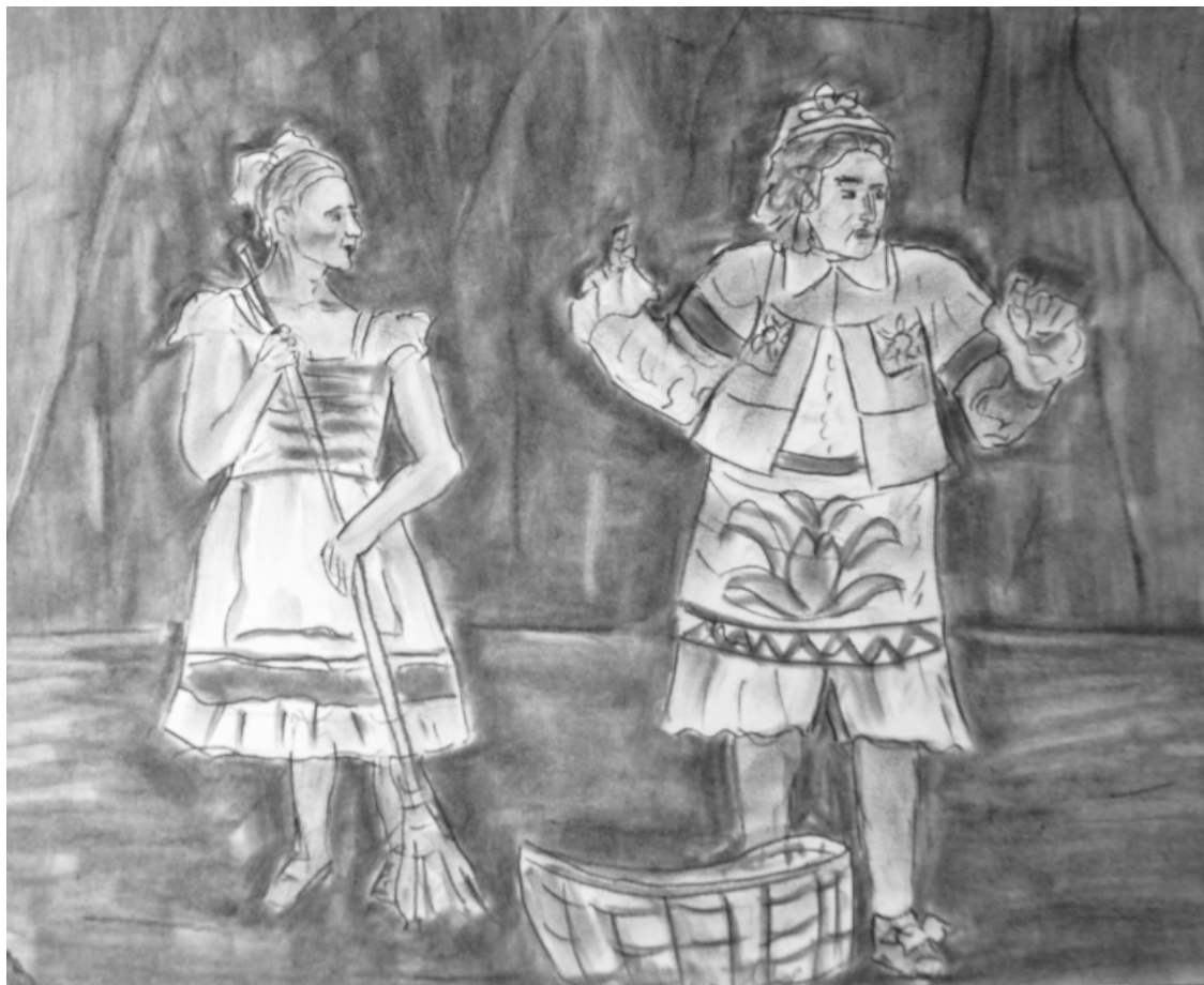
«Мещанин во дворянстве» лист 9