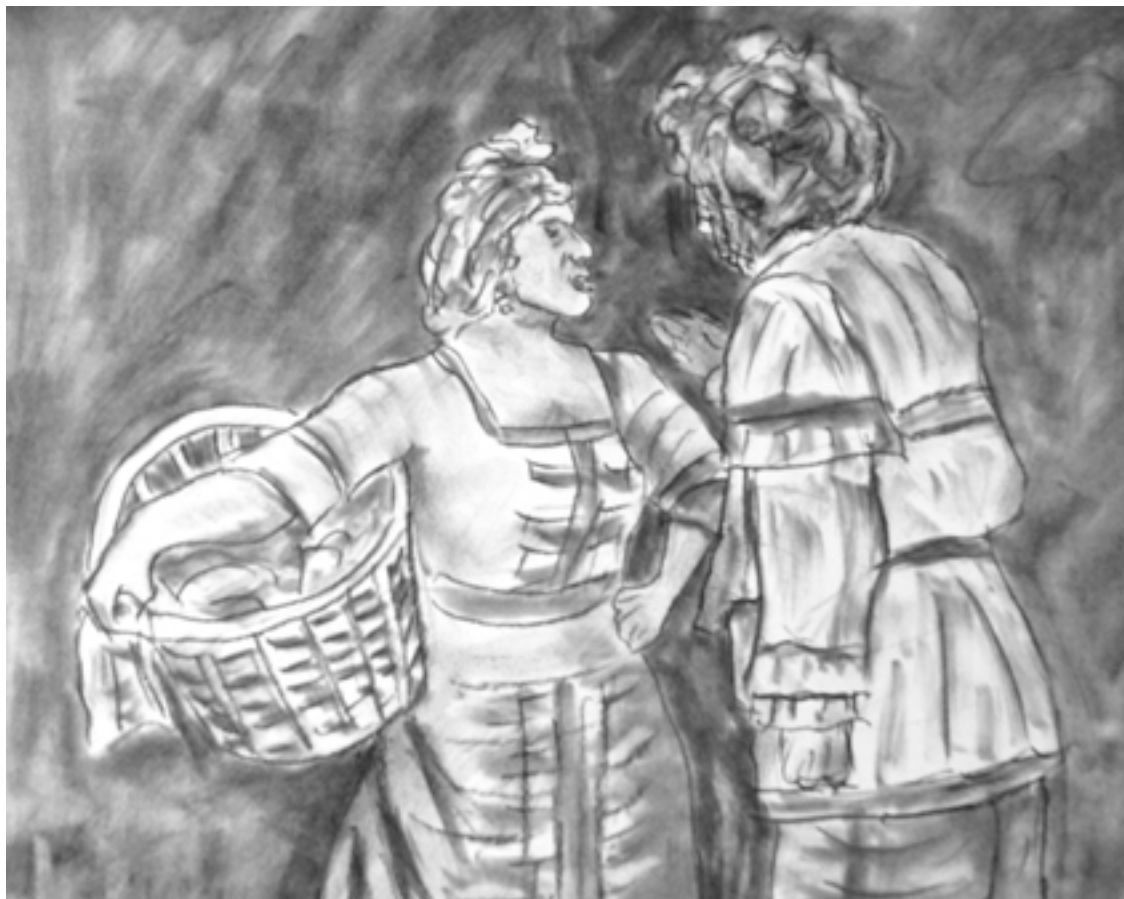
«Мещанин во дворянстве» лист 6