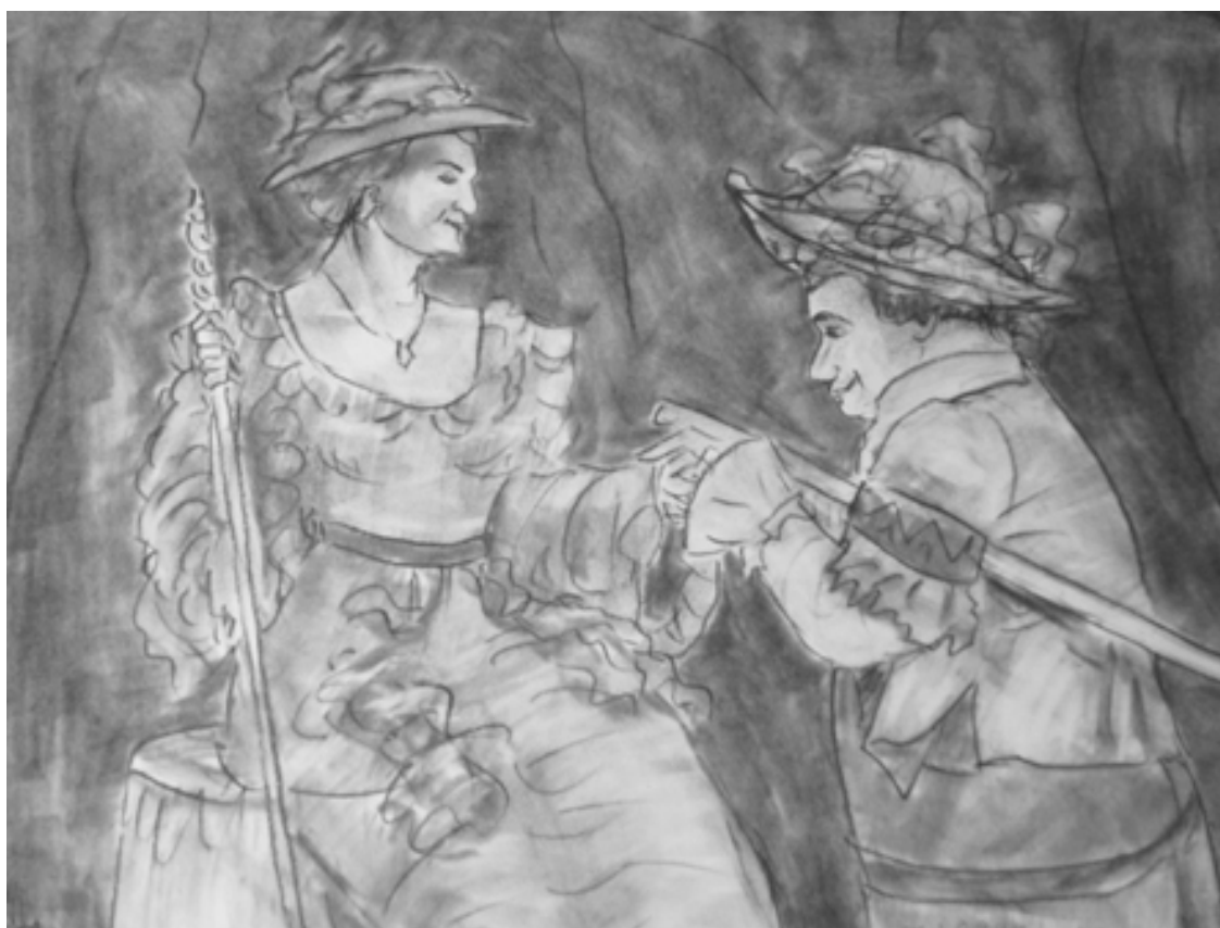
«Мещанин во дворянстве» лист 5