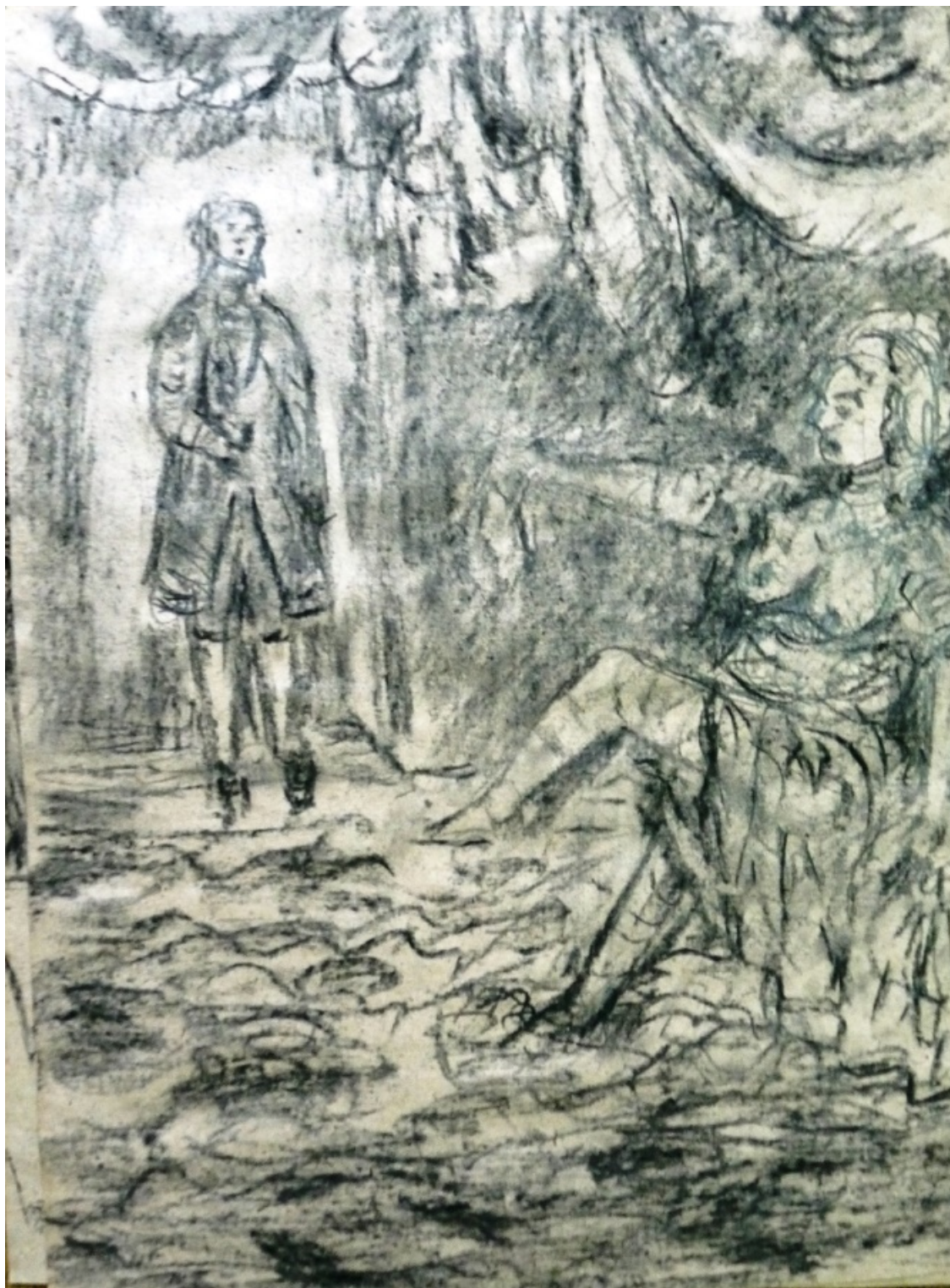
«Кандид» лист 3