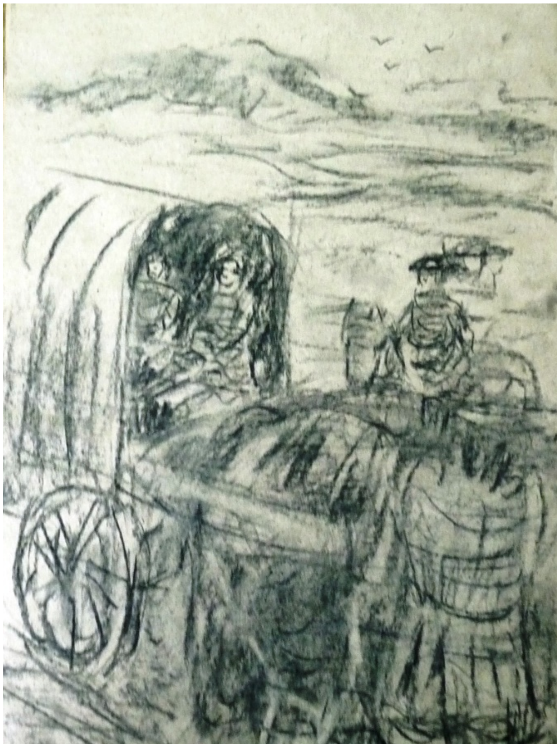
«Манон Леско» лист 3