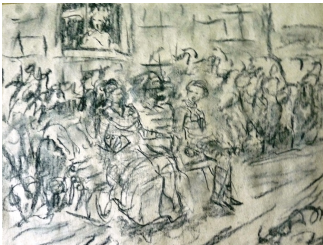
«Кандид» лист 1

– Это вы хорошо сказали, – отвечал Кандид, – но надо возделывать наш сад..."