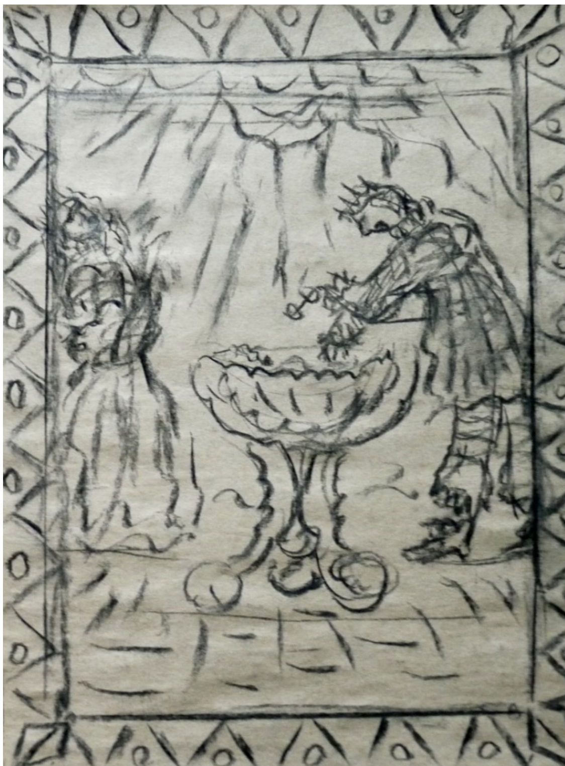
«Рике с хохолком» лист 1