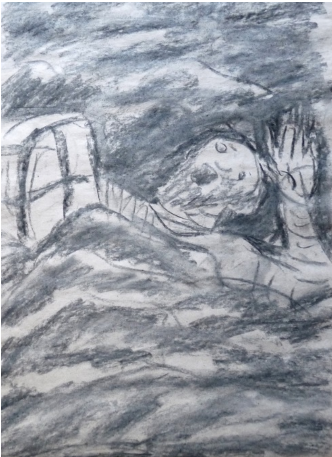
«Старик и море» лист 2