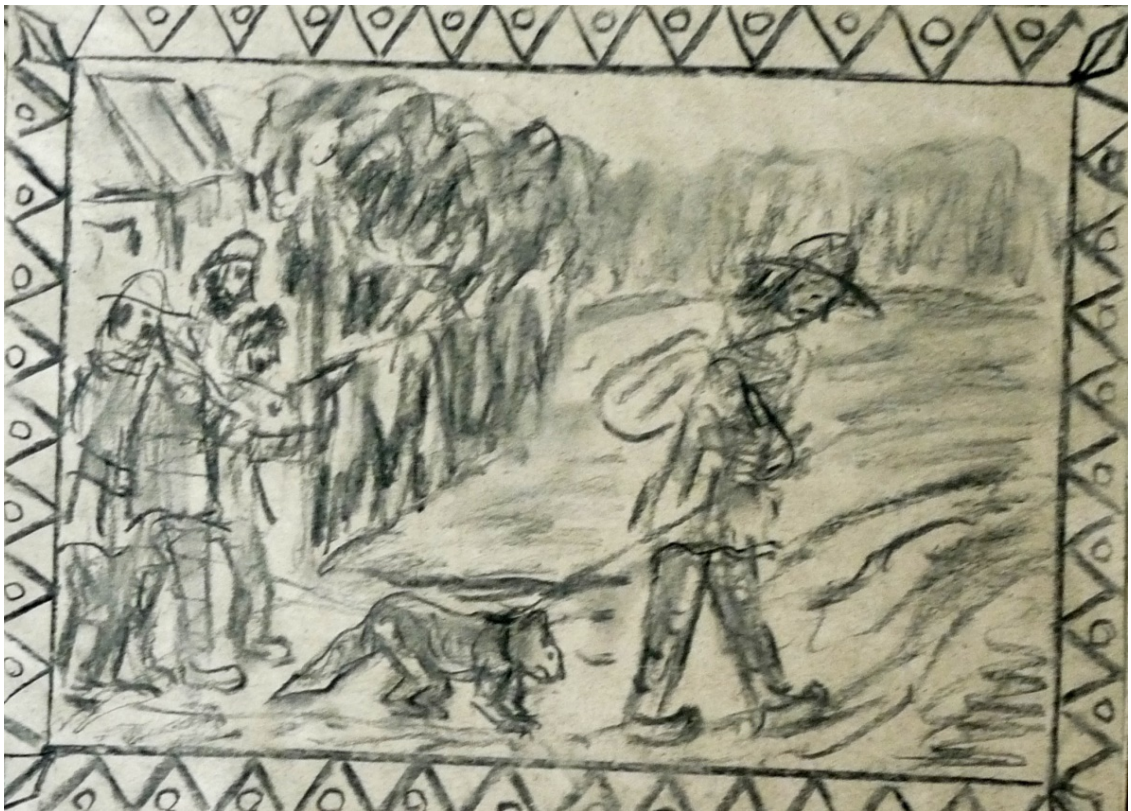
«Кот в сапогах» лист 1