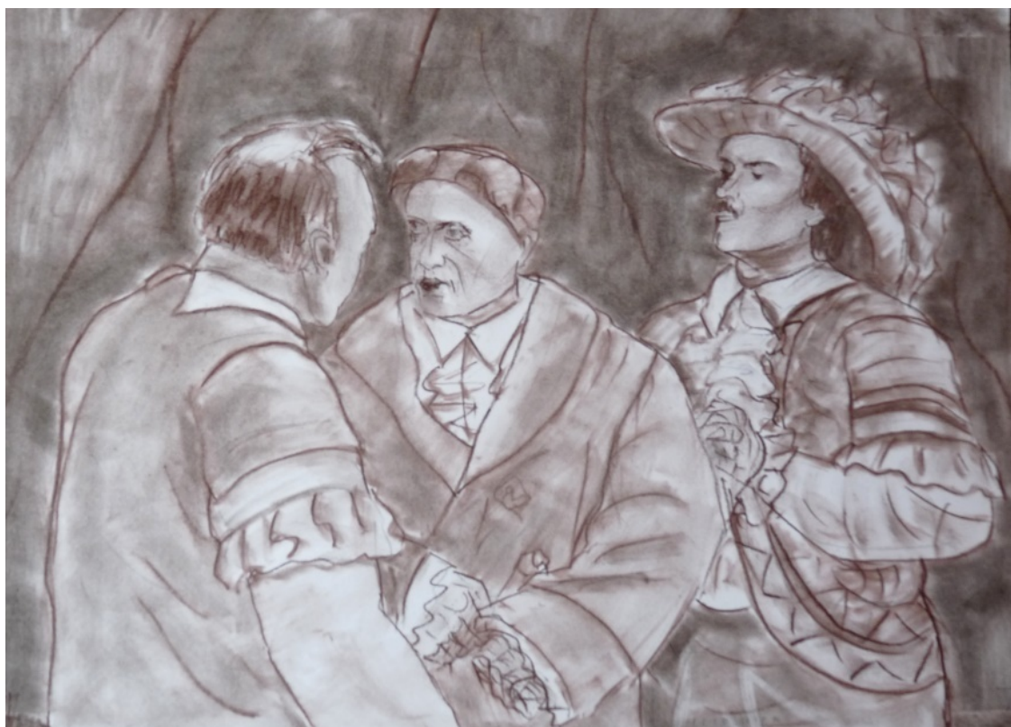
«Мещанин во дворянстве» лист 4