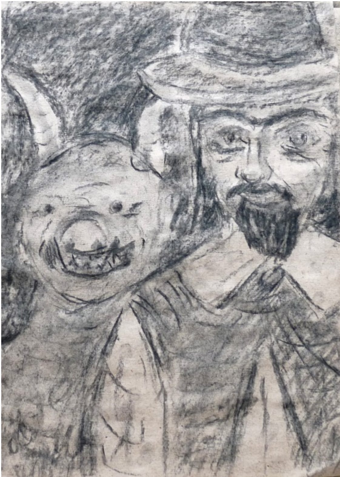
«Хромой бес» лист 1