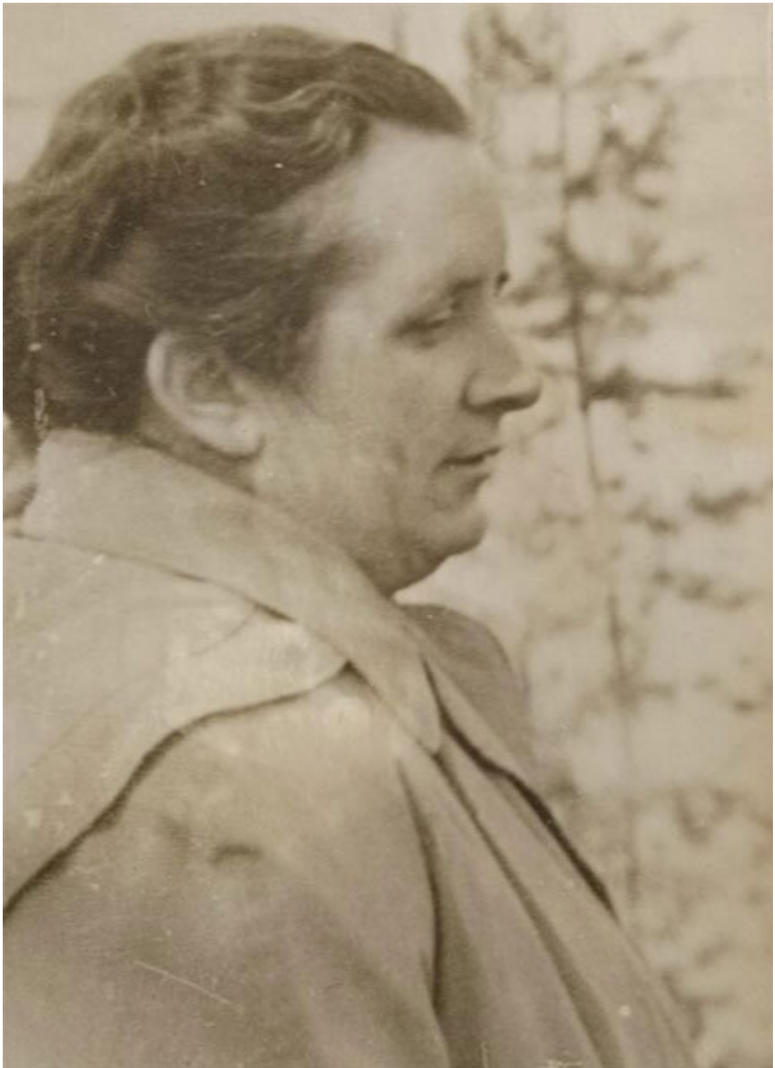
Мама, автор фото: брат Виктор

И вот, Уфа 1950–60-х годов. В основном, город был застроен одно- и двухэтажными домами со своеобразной архитектурой XVIII–XIX веков, с красивыми башенками на втором этаже. Запомнился запах старинных зданий и садов с яблоками и сливами. Казалось, что ранее это был богатый, купеческий город. Мы жили в старом двухэтажном доме с многочисленными соседями. Люди жили закрыто, но детей это не очень касалось.