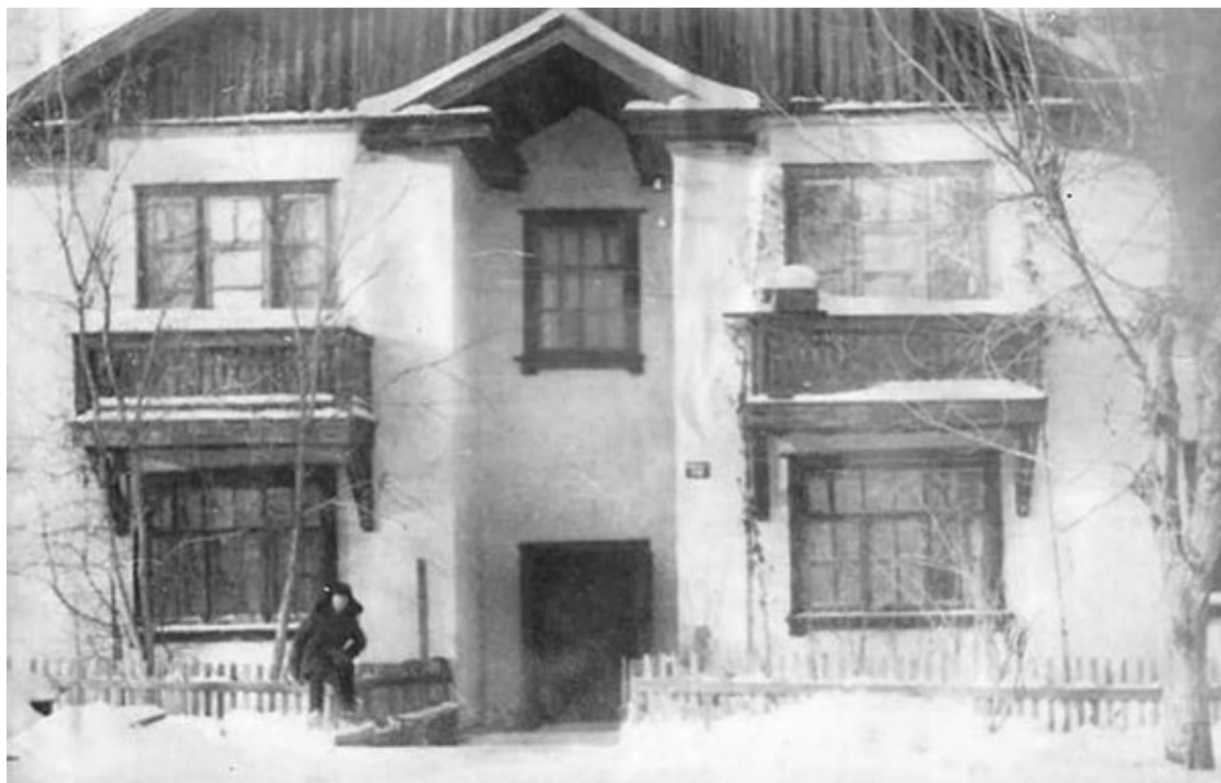
Дом моего детства

А сейчас ненадолго вернёмся в наши дни. Гидролизный завод — это производство технического спирта из опилок после обработки древесины. В 1941–1945 годах шла война и спирт был нужен фронту. Но его производство интересовало не только государство, но и некоторых жителей, что хотели обогатиться за счёт его нелегальной продажи. Спирт воровали и воровали всегда.