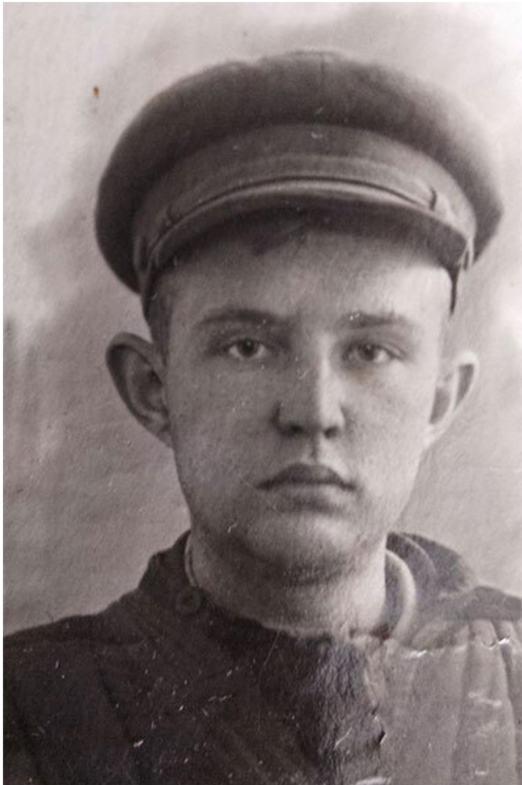
Отец в Ленинграде во время блокады, 1941 г.