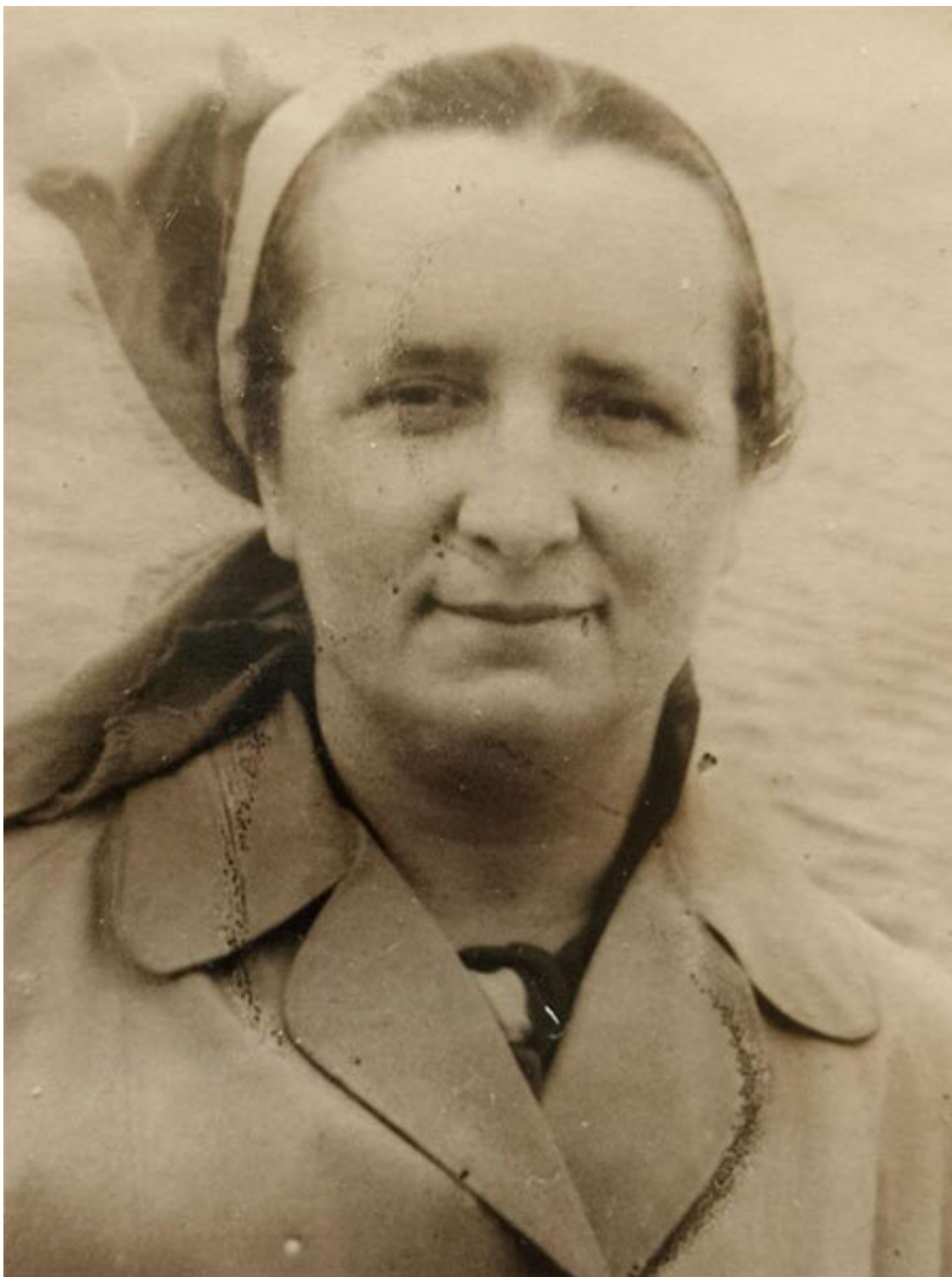
Мама, опыты брата по фотографированию

Что надо было сделать в течение дня нам, детям? Выучить уроки, сходить в магазин, брату, если зима, наносить дров, принести воды, иногда сварить ужин, если родители задерживались, убрать квартиру, что-то погладить, постирать. Сложность задания зависела от нашего возраста. И всегда было задание прочитать ту или иную книгу. Контроль за учёбой был постоянный, но мама не выполняла с нами домашние задания. Это была наша ответственность.