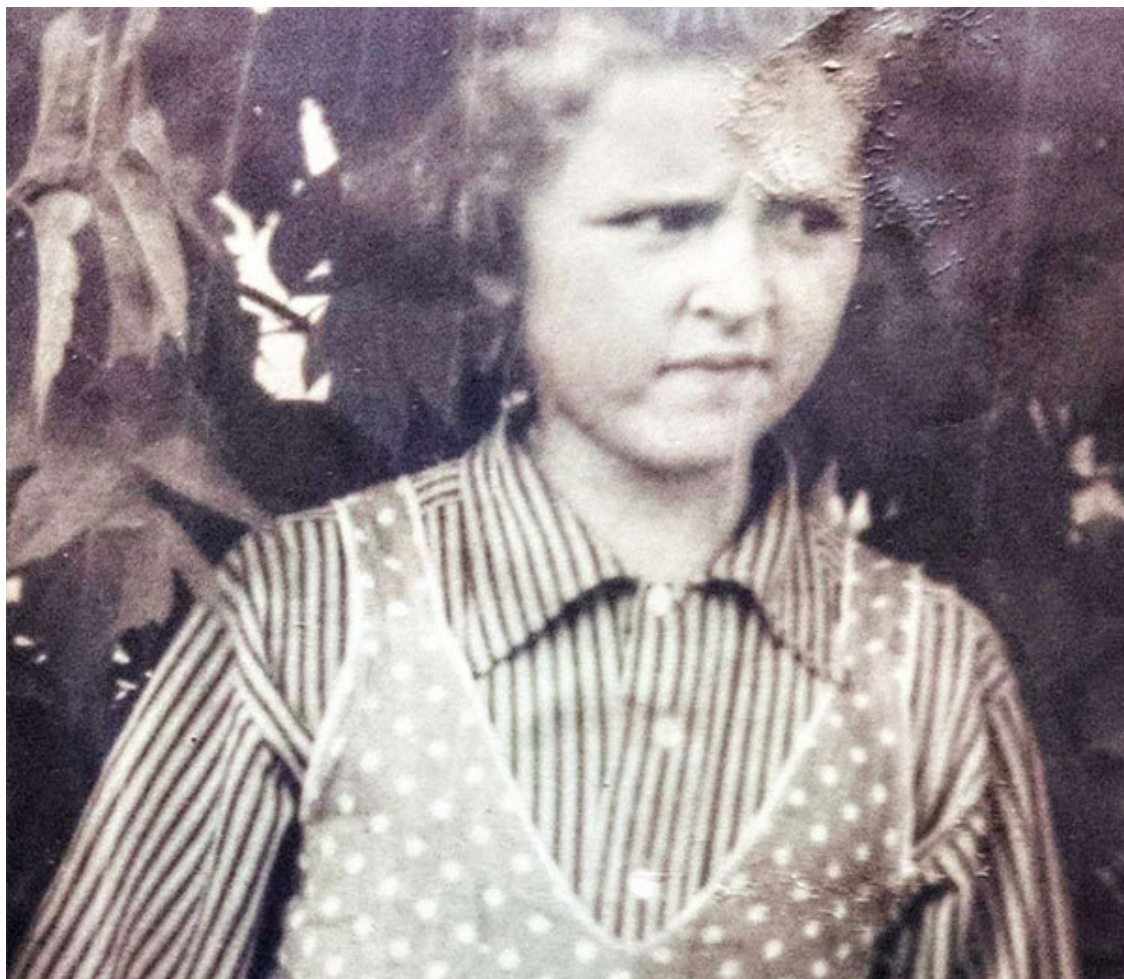
У бабушки на каникулах, Уфа, 1958 г.

Когда же я приехала в 1973 году на преддипломную практику в Башкирский государственный университет, город стал совсем другим. Большое здание университета, оперный театр с аллеей перед зданием из настоящих клёнов с большими жёлтыми осенними листьями в прозрачных лужицах. Завораживающе красиво. Особенно поразил Проспект Октября, очень широкий с небольшими берёзовыми, дубовыми и сосновыми рощицами вдоль дороги. И кругом богатые цветники. Город выстроен с любовью. Это был родной город моего отца.