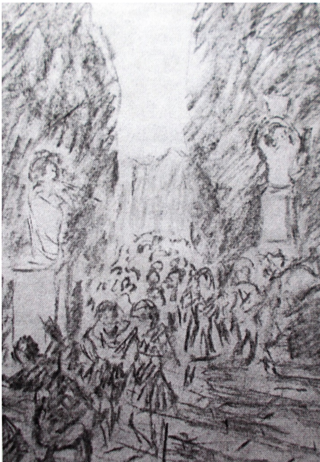
Мазуччо «Новеллино» лист 4