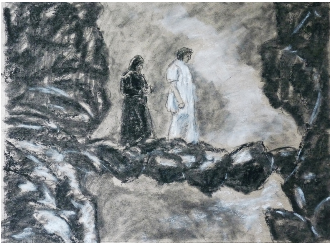
«Божественная комедия» лист4