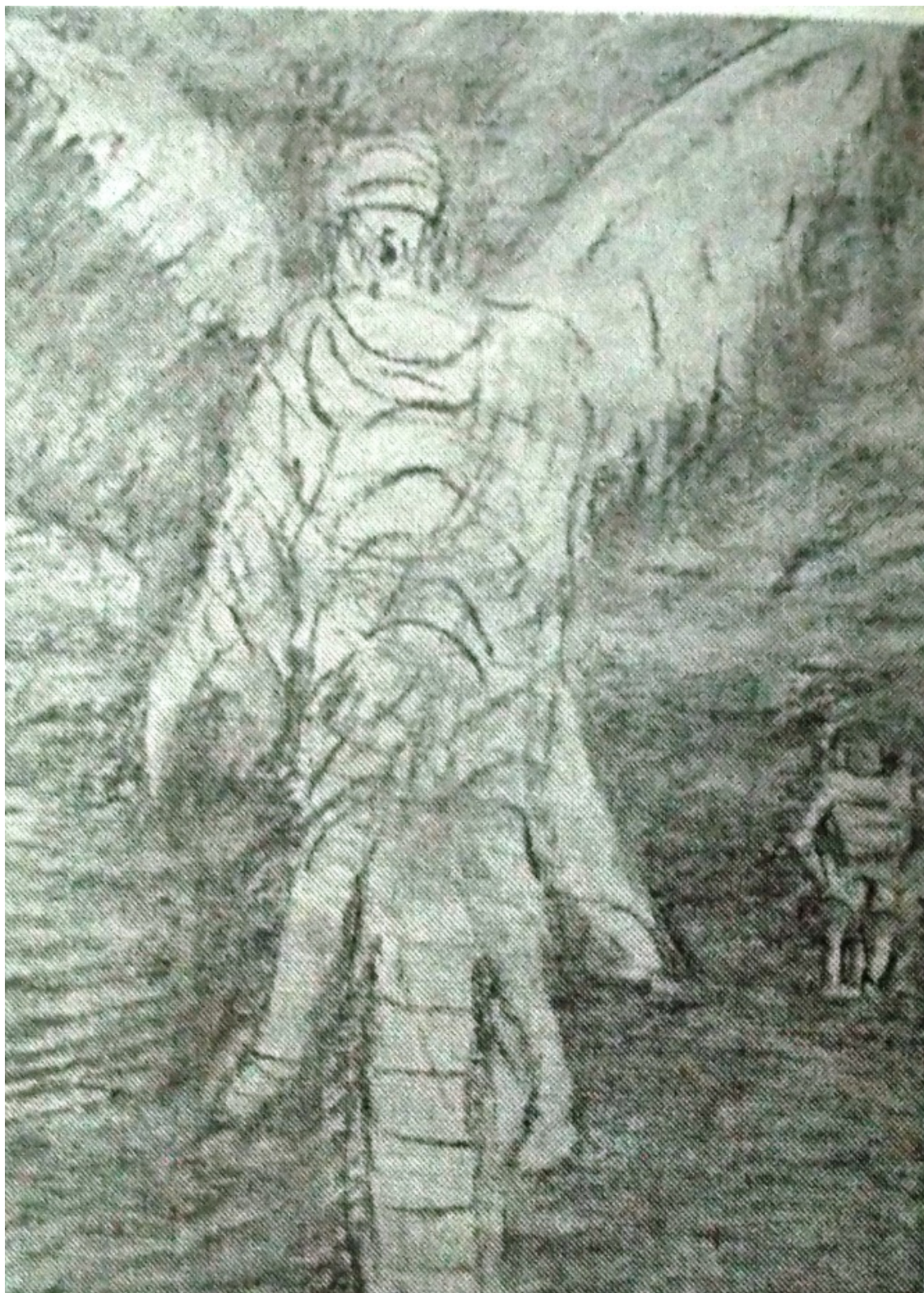
«Неистовый Роланд» лист 3