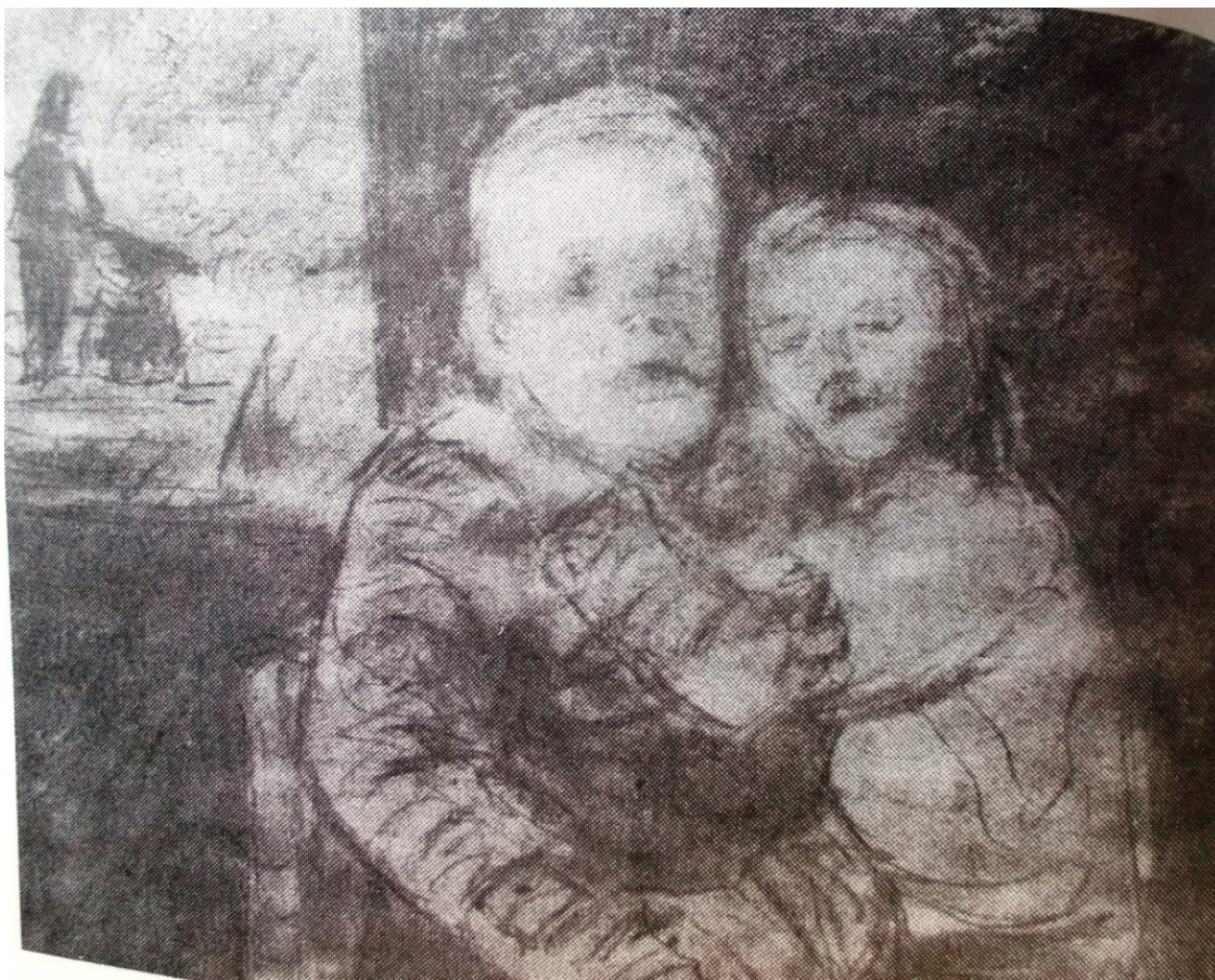
Банделло «Графиня ди Челлан» лист 4 Поэты – петраркисты

Под влиянием П. Бембо в итальянской лирике 16 века утвердился культ Петрарки. Его произведения получают значение универсального образца. Петраркизм становится достоянием множества поэтов, сочиняющих любовные, панегирические, религиозные и политические стихи. Они культивируют мотивы платонической любви, изысканные метафоры, не выходящие за пределы эстетических представлений Петрарки (пламя любви, антитеза снега и огня, уподобление возлюбленной солнцу, которое затмевает блеск небесного светила).