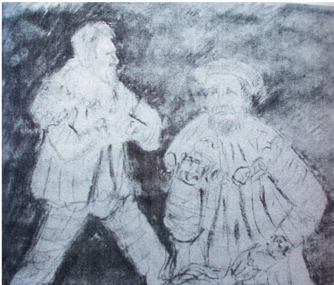
«Мандрагора» лист 1

Молодой Каллимако влюблен в прекрасную Лукрецию, целомудренную жену престарелого правоведа мессера Нича. Последний бездетен и давно мечтает о ребенке. Каллимако выдает себя за знаменитого парижского врача, обладающего верным средством (настойка мандрагоры) излечить мадонну Лукрецию. Однако первый мужчина, с которым она будет иметь дело, умрет. Хитроумный Каллимако подсказывает трусливому мужу выход: как только его жена выпьет этот напиток, к ней надо положить на ночь любого мужчину с улицы. Мессер Нича был согласен, а Лукрецию на этот странный поступок уговорил ее духовник, монах фра Тимотео. Ну, а мужчиной с улицы, конечно, оказался молодой Каллимако. Этот план блестяще осуществляется. Каллимако завоевывает сердце мадонны Лукреции и становится ее любовником.