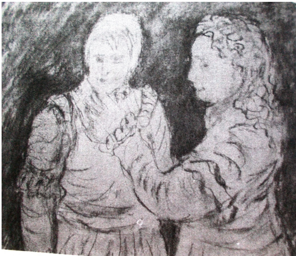
Банделло «Графиня ди Челлан» лист 3