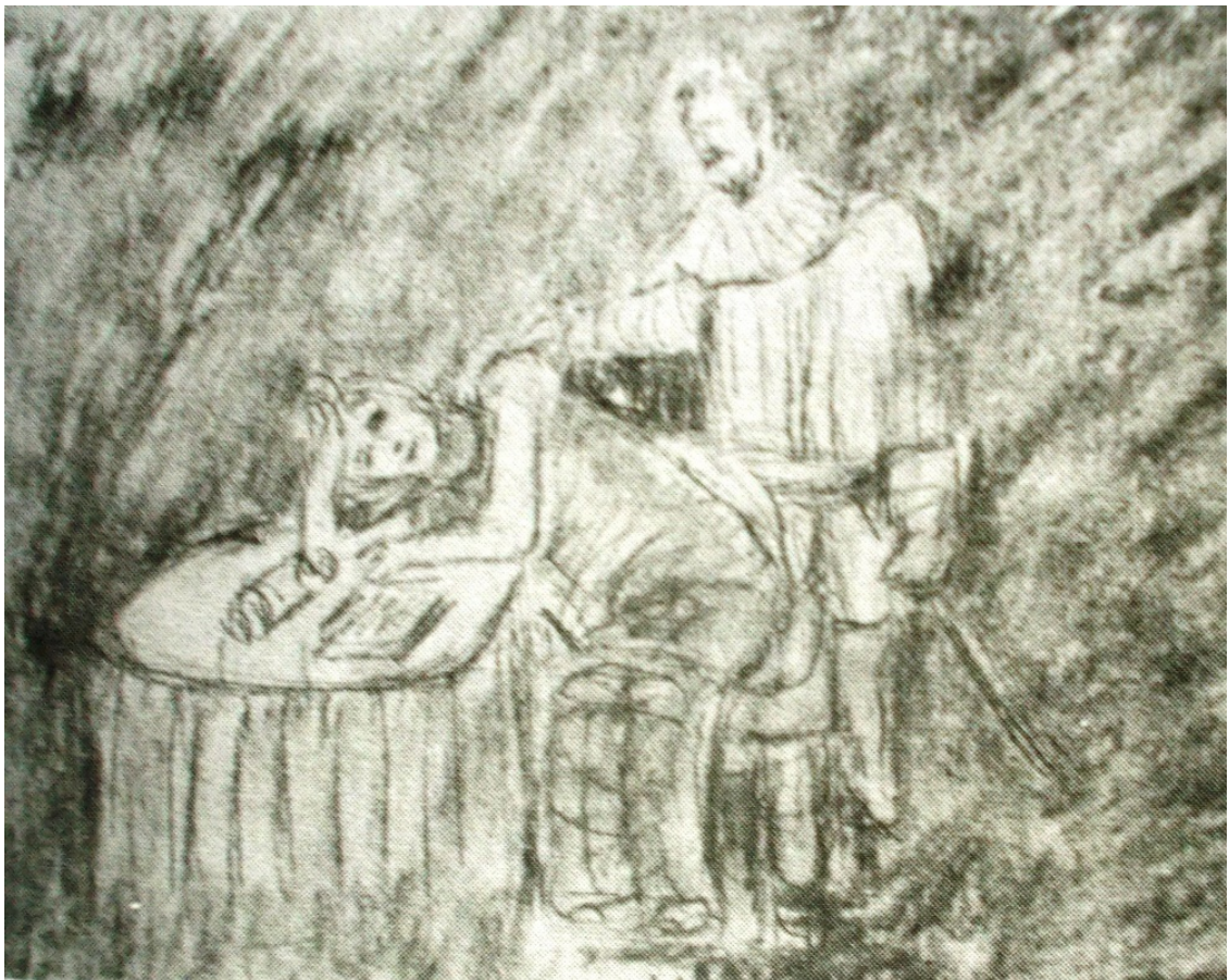
Банделло «Графиня ди Челлан» лист 1

«... Но несчастная молодая женщина, подтвердившая из собственных уст признание своего любовника, была присуждена к обезглавлению. Услышав приговор и не зная, что дон Пьетро избежал суда, она ни как не могла примириться с мыслью о предстоящей смерти...»