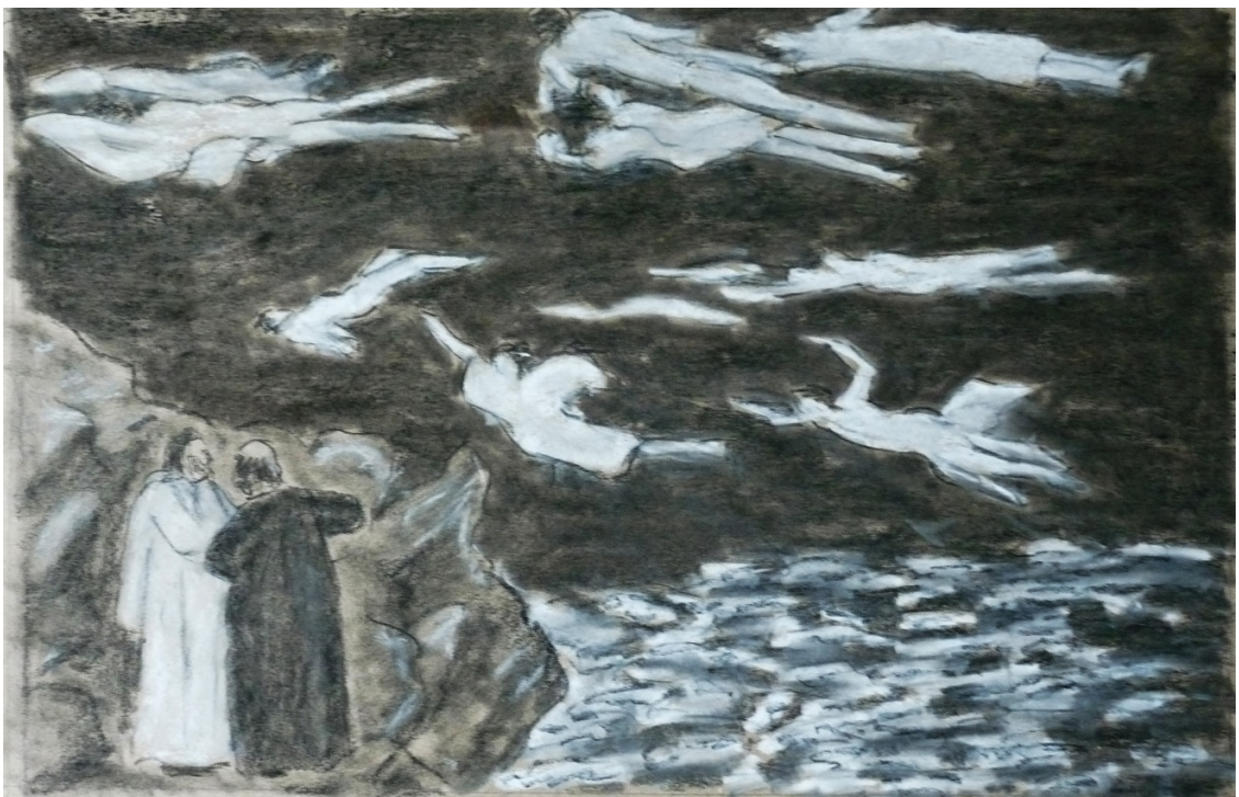
«Божественная комедия» лист3