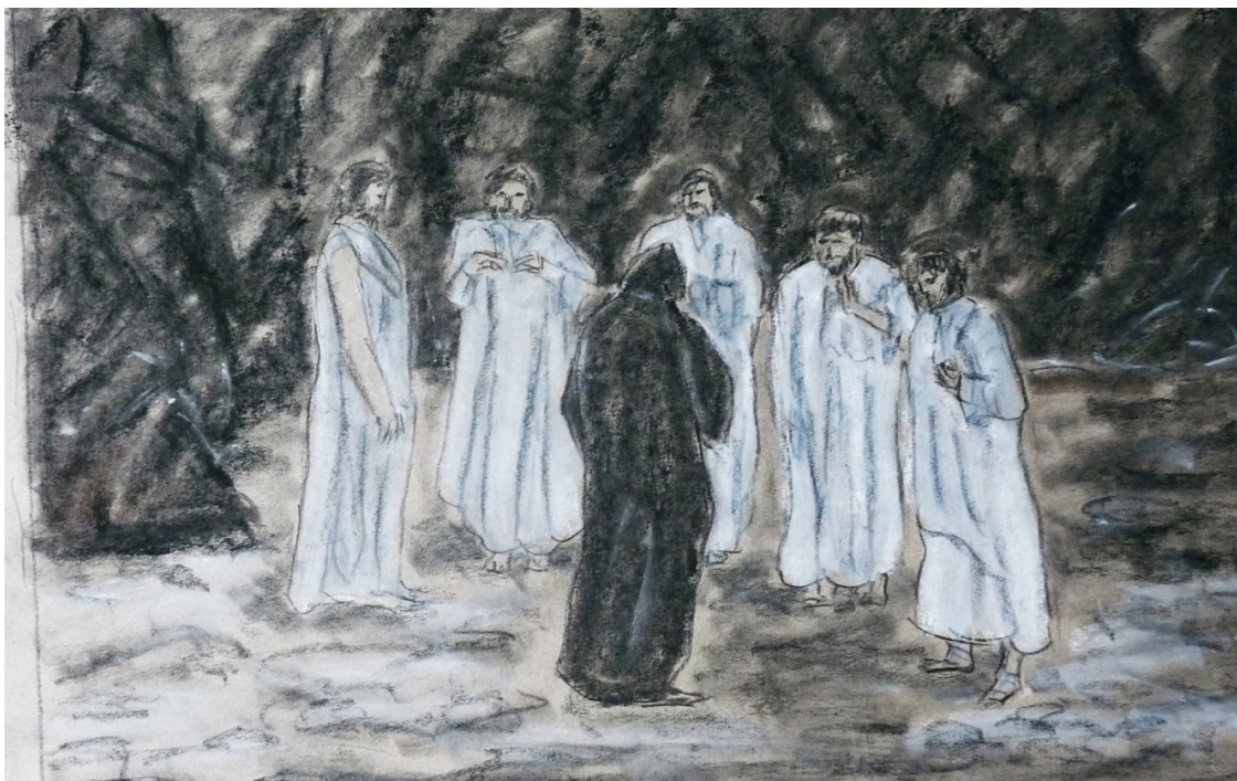
«Божественная комедия» лист 6