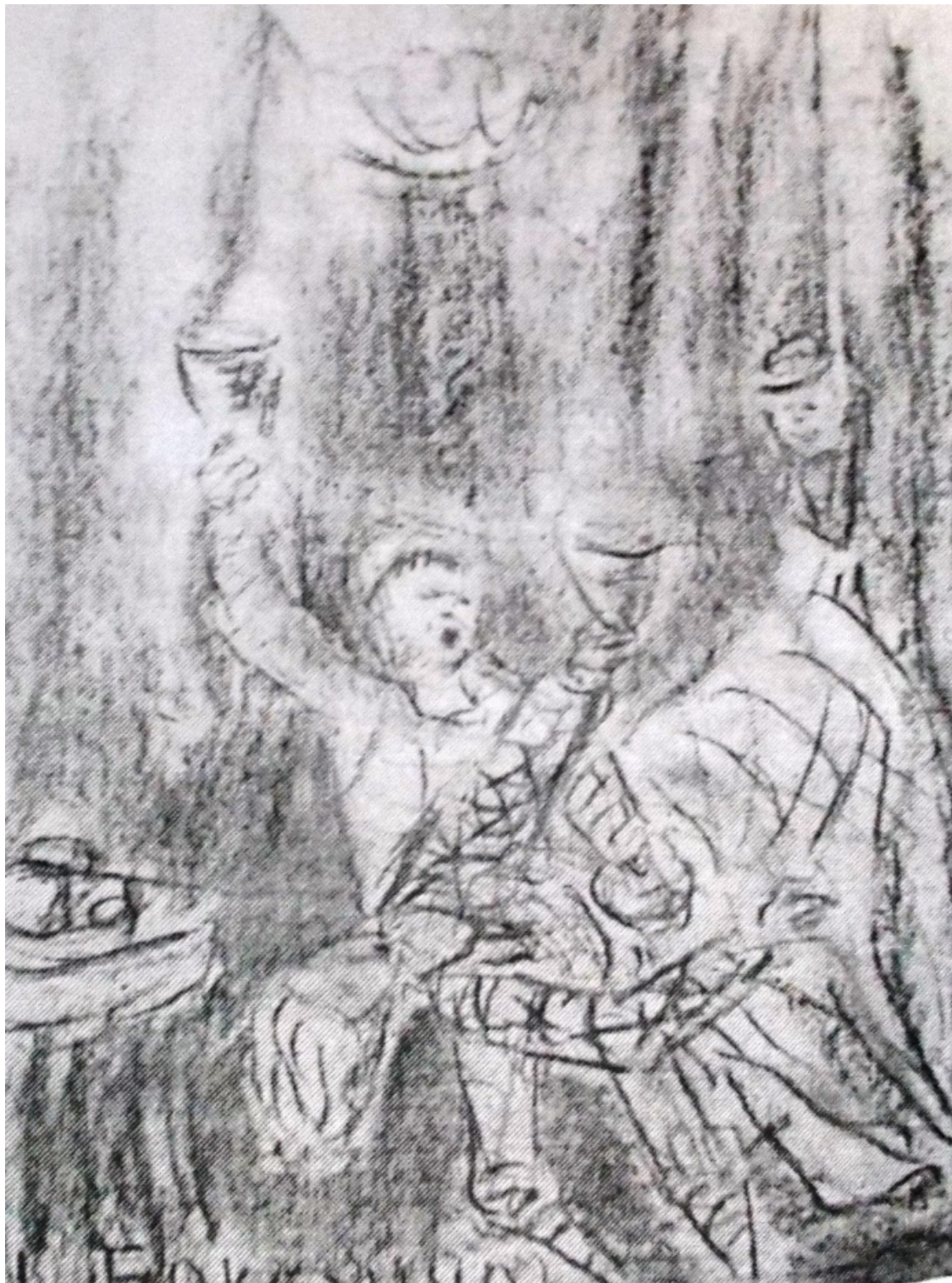
«Декамерон» лист 1

зачумленный город. Они удаляются в одну из загородных вилл, где проводят время в играх, забавах и беседах. В течении десяти дней они занимают друг друга рассказыванием новелл – каждый рассказывает в день по одной новелле (отсюда и греческое название книги «Декамерон», что означает десятидневник).