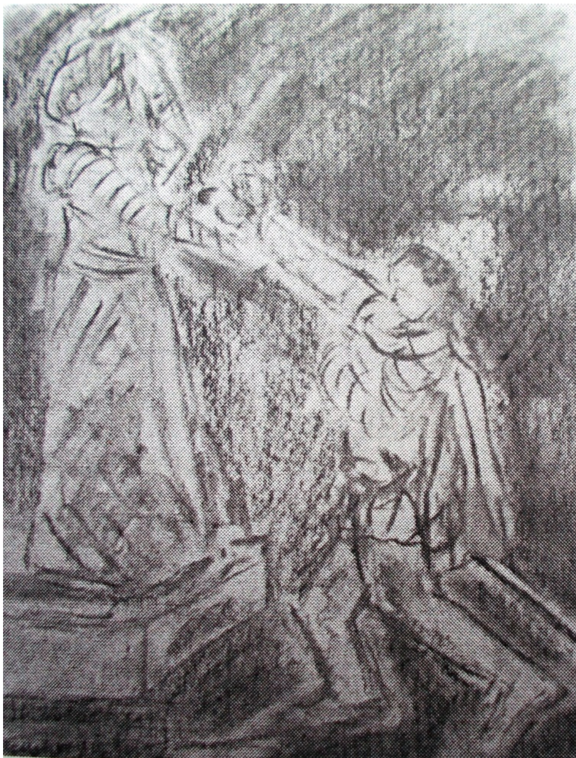
Мазуччо «Новеллино» лист 1