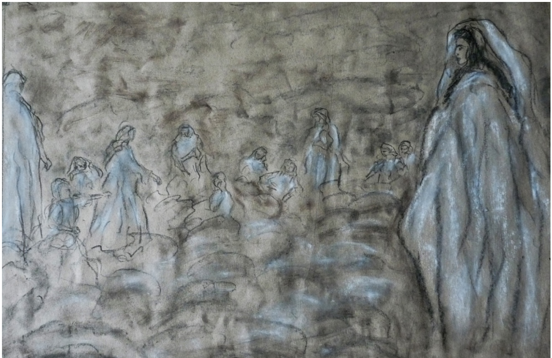
«Божественная комедия» лист 11