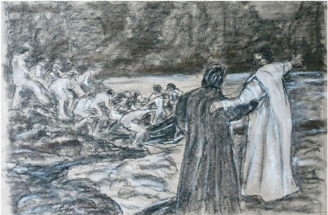
«Божественная комедия» лист 1

Поэма великого итальянского поэта Данте Алигьери «Божественная Комедия» - бессмертный памятник 14 века, который является величайшим вкладом итальянского народа в сокровищницу мировой литературы.