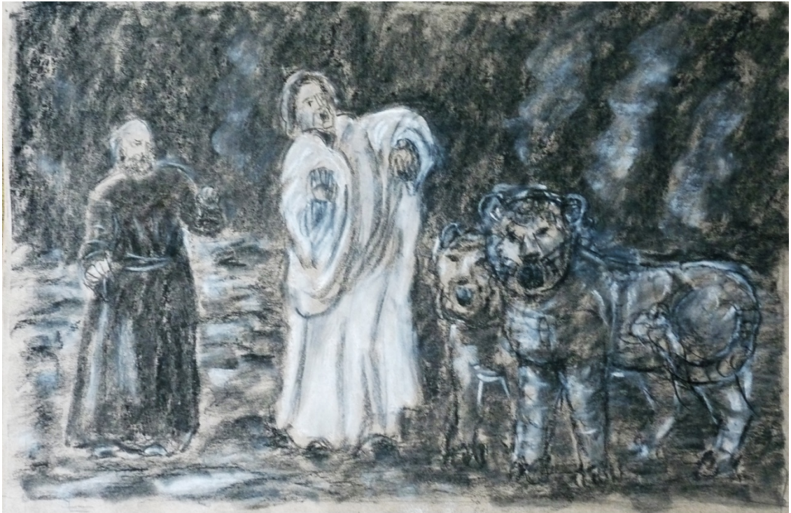
«Божественная комедия» лист2