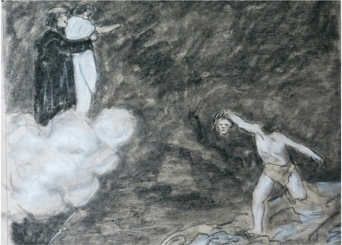
«Божественная комедия» лист 8