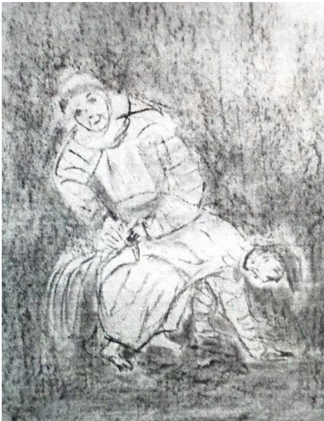
«Декамерон» лист 3