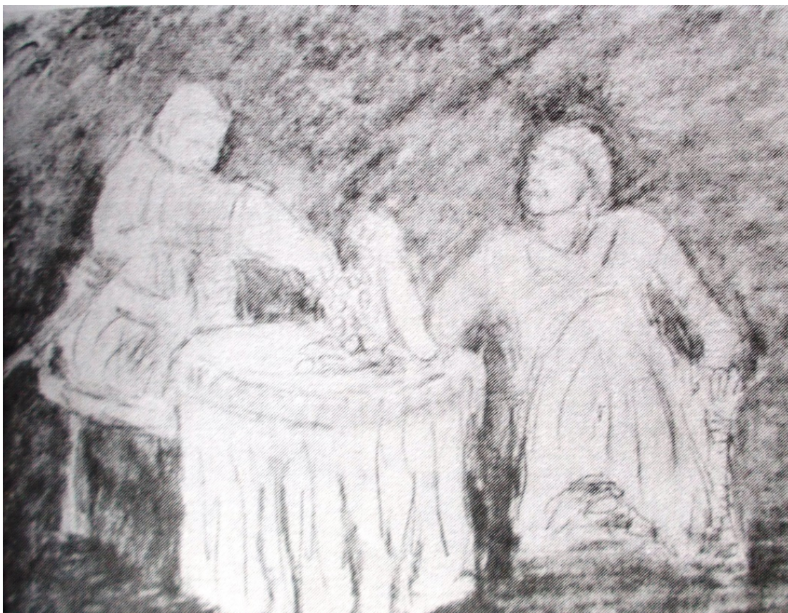
Банделло «Графиня ди Челлан» лист 2