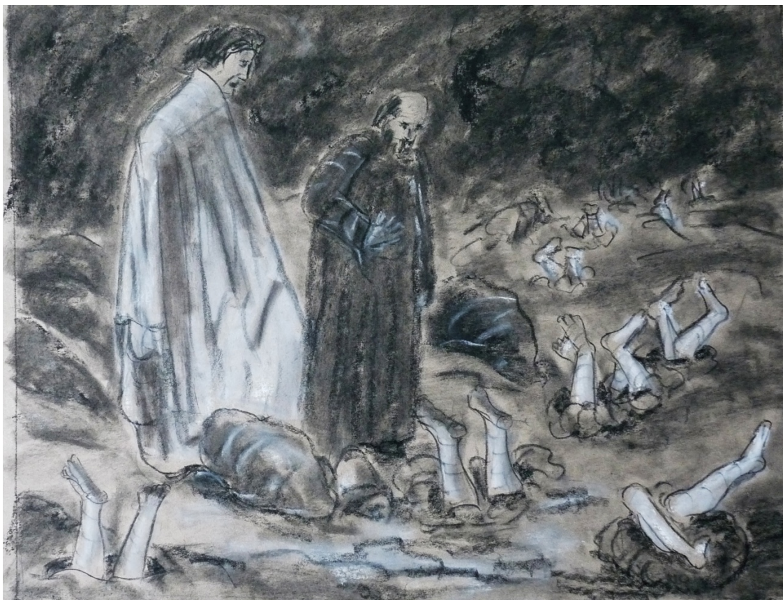
«Божественная комедия» лист 9