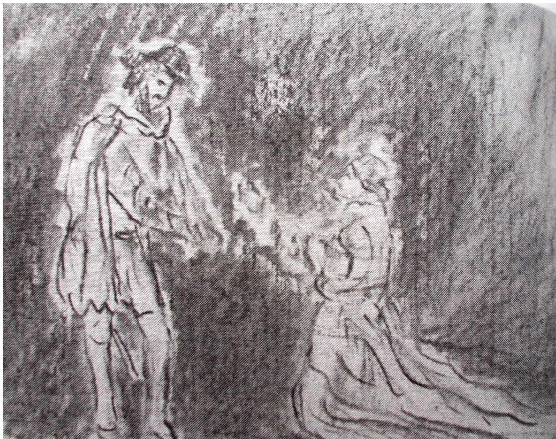
Мазучо «Новеллино» лист 3