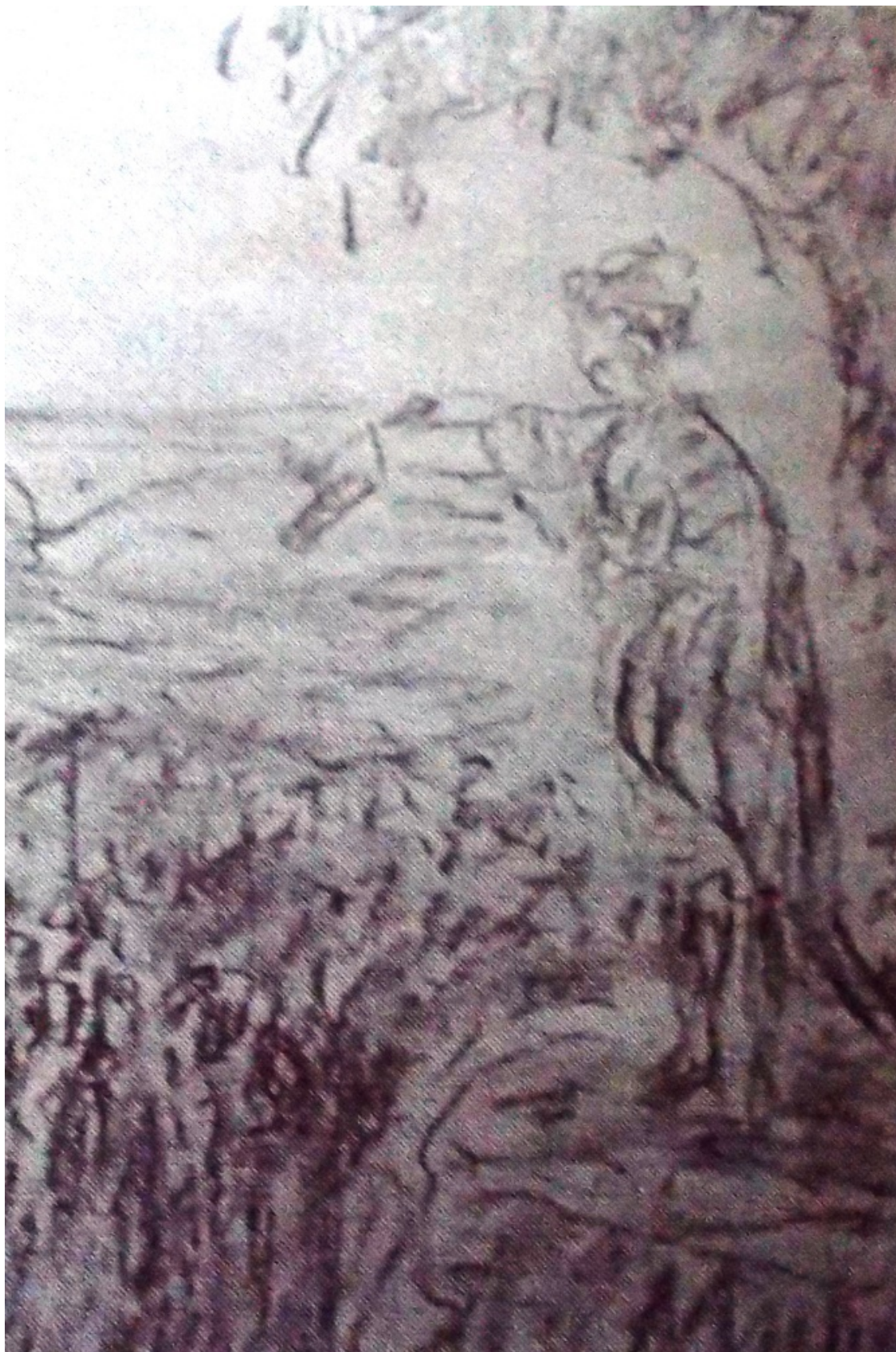
«Неистовый Роланд» лист 4