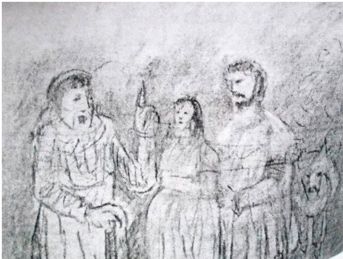
«Декамерон» лист 2