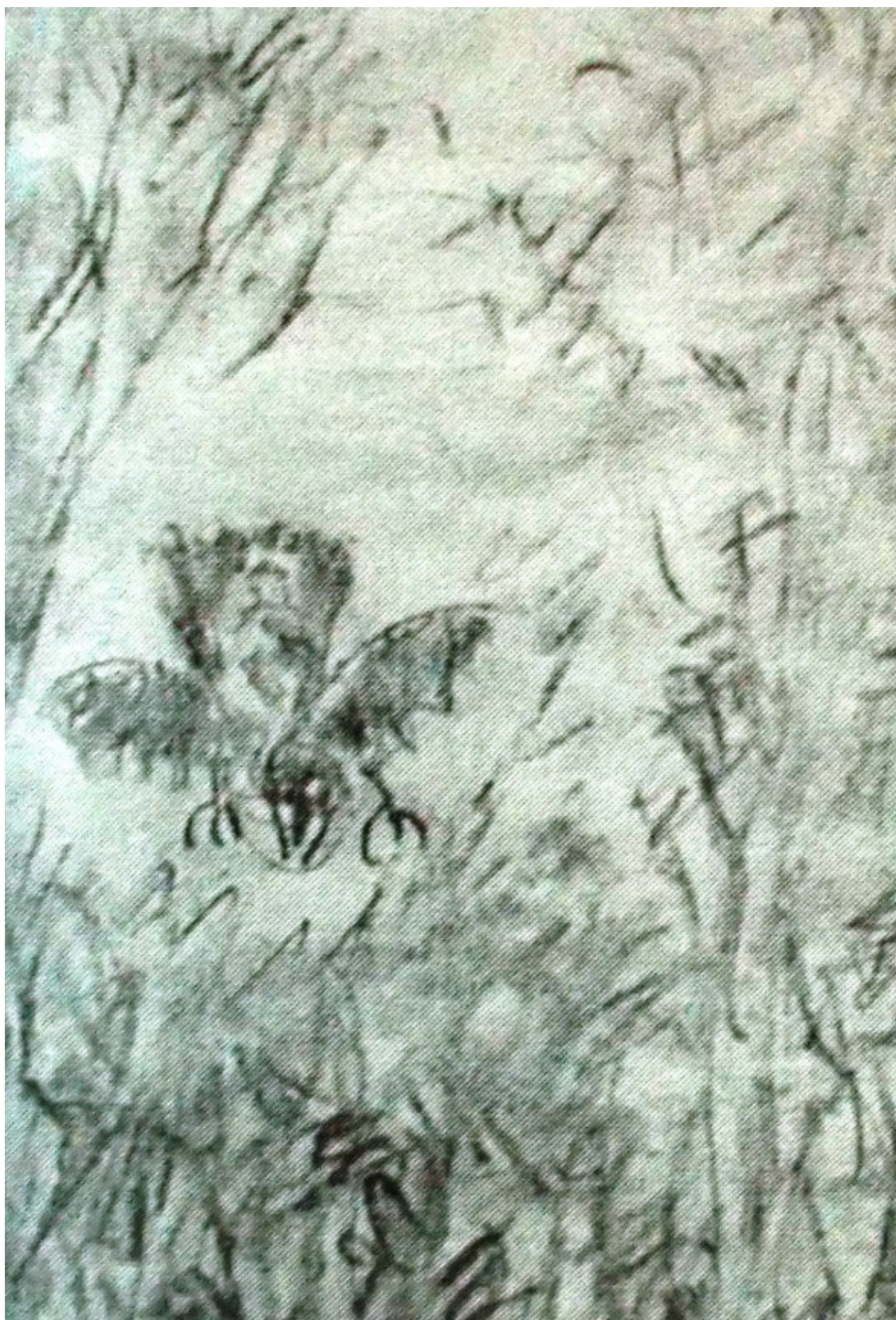
«Неистовый Роланд» лист 2