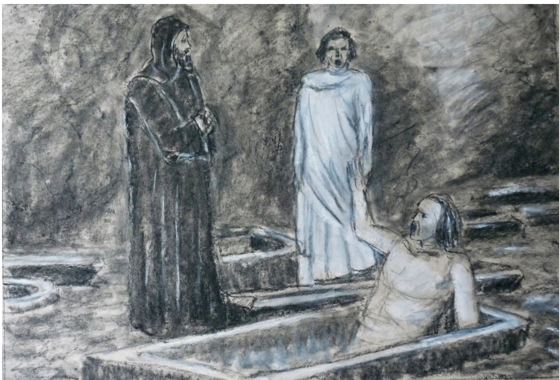
«Божественная комедия» лист 7