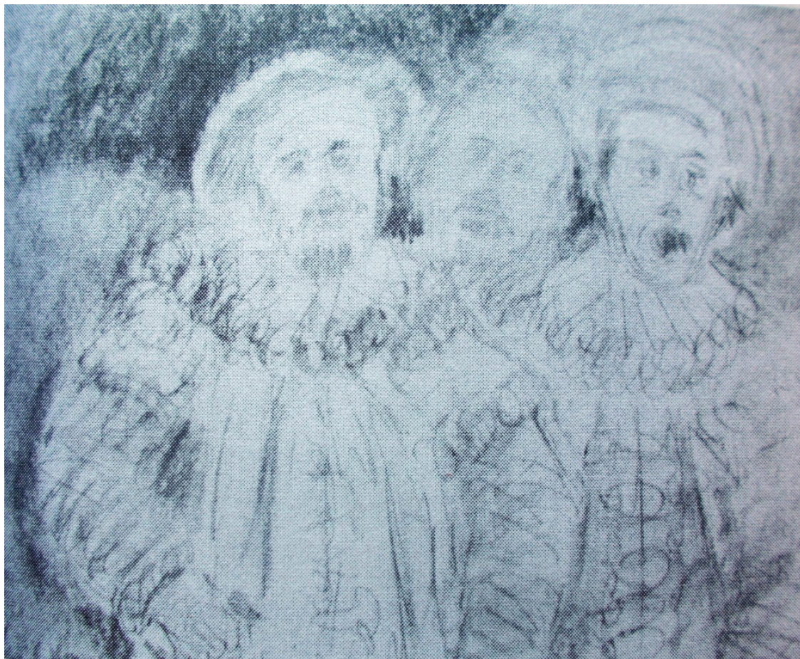
«Мандрагора» лист 2