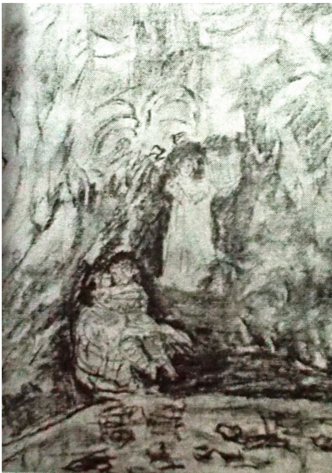
«Неистовый Роланд» лист 1