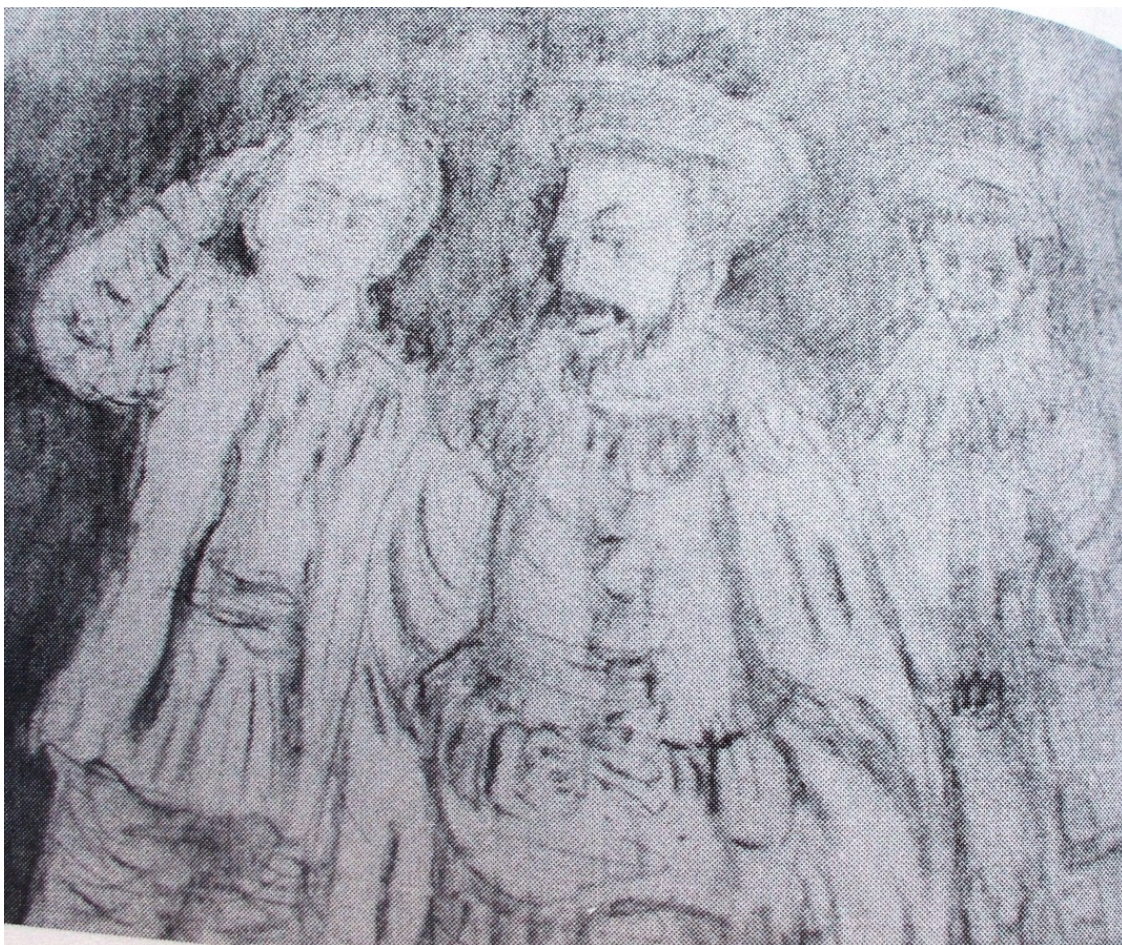
«Мандрагора» лист 3