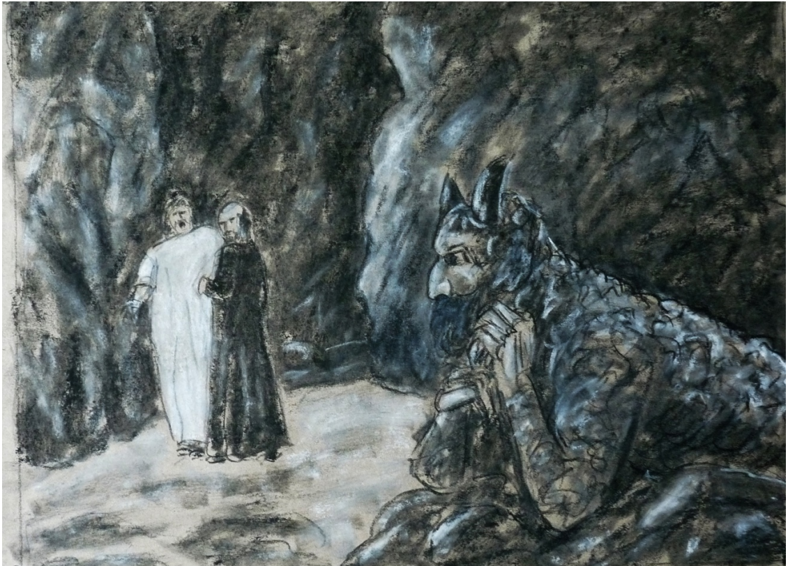
«Божественная комедия» лист 5