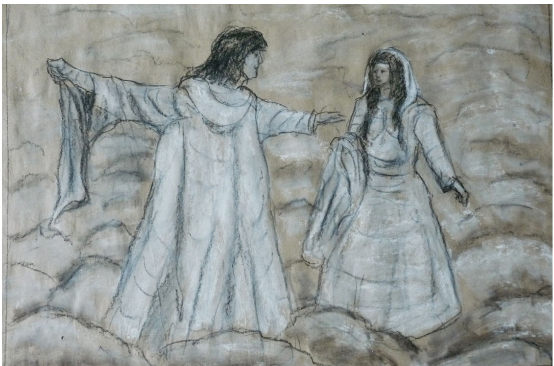
«Божественная комедия» лист 12