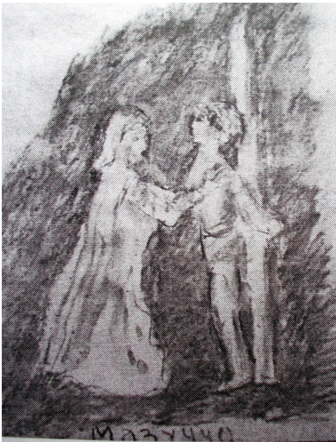
Мазуччо «Новеллино» лист 2