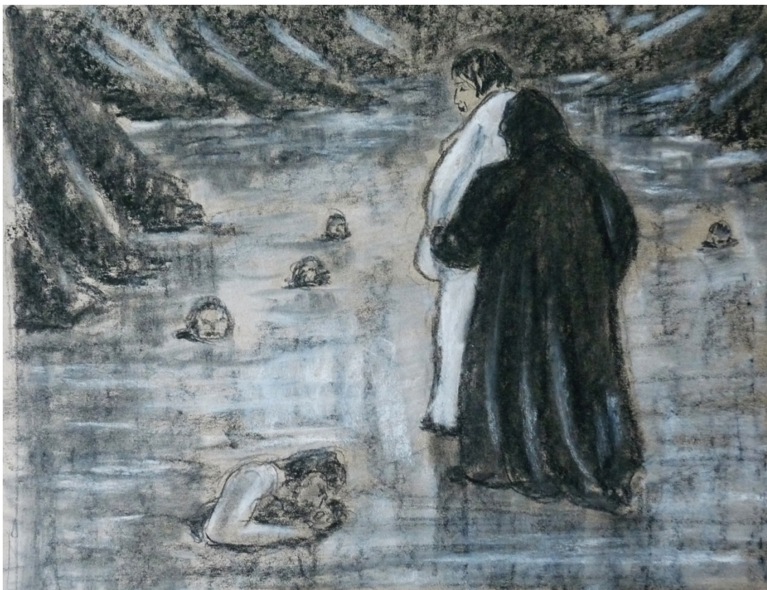
«Божественная комедия» лист 10