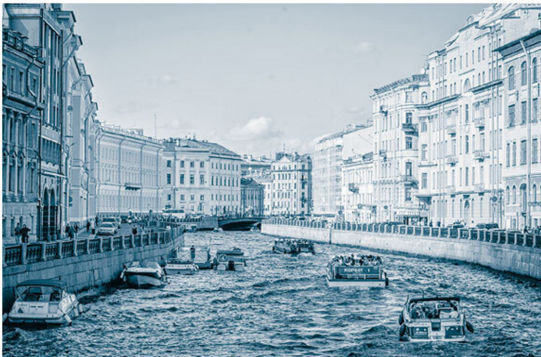
Набережная реки Мойки. Современная фотография.

События такого исторического масштаба не могли не иметь каких-то глубинных оснований, и мифология Петербурга пытается их найти. Петербург – очень неудобный для жизни город. Очень холодный и очень каменный. До второй половины XIX века зелени в нем не хватало, а городские сады были изолированными островками внутри завоеванного у природы городского пространства (Летний сад, например, находится на острове). Само имя Петр означает «камень». Символ Петербурга, гранитные набережные, – грандиозный проект, начатый Екатериной: они сковывают свободное течение Невы, подчеркивая суровую, неземную красоту Петербурга, в основе которой – дисциплина и самопреодоление.