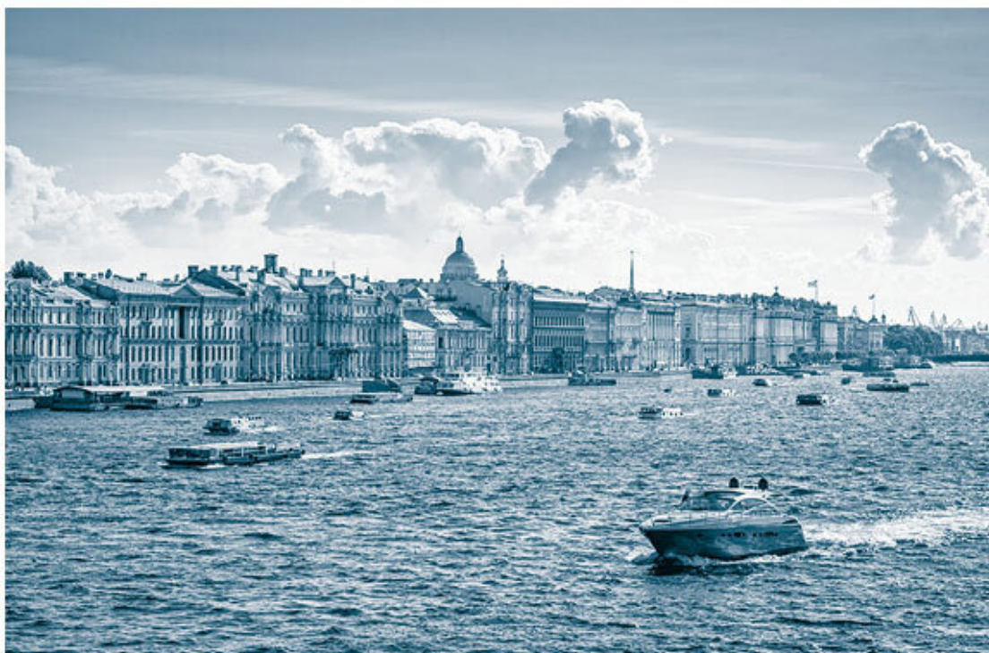
Дворцовая набережная. Современная фотография.

В потоке броской и зачастую поверхностно-сентиментальной информации из виду теряется то существенное, ради чего мы обращаемся к изучению города как такового: город – это живое явление, и у него есть душа. Впервые об этом сказал великий исследователь Петербурга Николай Павлович Анциферов (1889–1958). Его книга «Душа Петербурга» вышла в издательстве «Брокгауз-Ефрон» в 1922 году. Создавалась она в период Гражданской войны. Это время в Петрограде постфактум назовут малой блокадой, сравнивая его с большой блокадой Ленинграда 1941–1944 годов. Из-за коллапса железных дорог и наступательных действий Белой армии и интервентов в городе с 1918 года свирепствовал голод, были введены хлебные карточки, а к 1920-му его население сократилось до 800 тысяч человек (примерно столько же было и в 1945 году). От последствий голода и цинги в 1921-м умирает Александр Блок – поэт, особо ценимый Анциферовым. О том, как выглядел Петроград того времени, красноречиво свидетельствует цикл гравюр Павла Шиллинговского «Руины и возрождение» (Шиллинговский погибнет от голода в 1942 году и будет похоронен в братской могиле на острове Голодай вместе с Билибиным и другими профессорами Академии художеств).