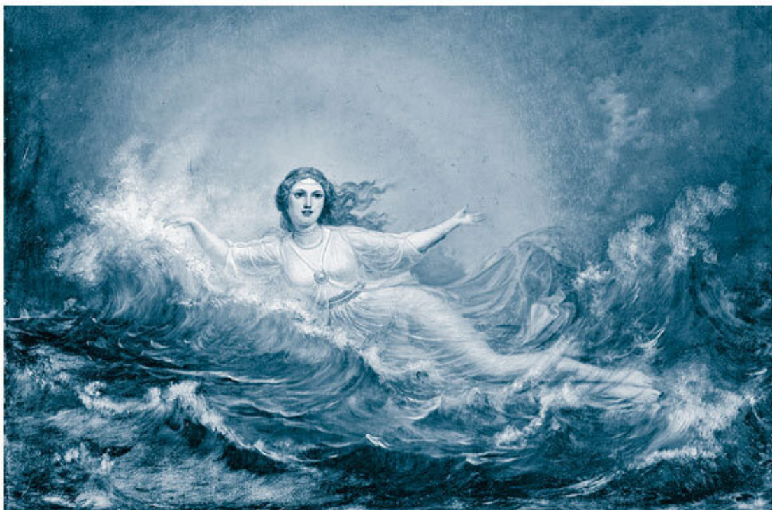
Ильматар. Картина Р. Экмана, 1860 г. Finnish National Gallery Collection / Ateneum Art Museum

В 47-й руне «Калевалы» Вяйнямейнен мастерит лодку. В эпических песнях Карелии фигура старца иногда отождествлялась с Петром Великим, а изготовление лодки – с созданием русского флота. Огонь, потерянный Ильматар и обретенный героями «Калевалы», был высечен верховным богом Укко – богом-громовержцем, аналогом славянского Перуна или скандинавского Тора. Укко катает небесные камни, и раздается гром, и у финнов с культом Укко связано представление о волшебных каменных топорах (аналог молота Тора). Святыщами Укко были рощи: одна из таких, можжевелевая роща Уккола, находилась неподалеку от современных Гостилиц, бывшего имения Кирилла Разумовского, и была уничтожена лютеранскими пасторами в XVIII веке, о чем есть документальные свидетельства. О священной роще ижорцев рассказывает и Михаил Пыляев в «Старом Петербурге»: