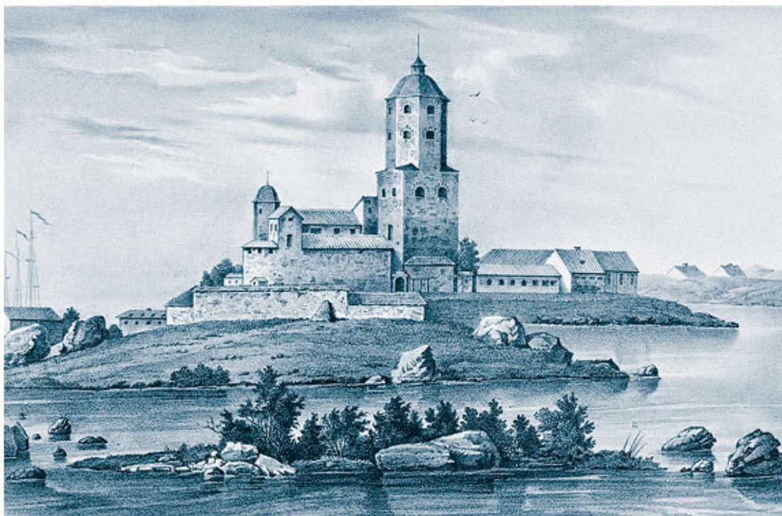
Выборгский замок. Литография Т. Форстена, 1848 г. Finnish National Gallery Collection / Ateneum Art Museum

Стратегическими соперниками новгородцев на северо-западе были шведы. К востоку от современного Петербурга, на южном берегу Ладоги, еще за несколько веков до появления Новгорода находилась и древнейшая колония викингов – Альдейгьюборг (Старая Ладога), с которой связан летописный рассказ о призвании на Русь варягов и которая упомянута в скандинавских сагах. На рубеже XIII и XIV веков шведами во главе с маршалом Торгильсом Кнутссоном были заложены Выборгский замок и крепость Ландскрона («венец земли»). Последняя располагалась прямо напротив современного Смольного собора, в устье реки Охты, и просуществовала всего около двух лет, после чего была разрушена новгородцами и карелами. Для шведов эти земли тоже были фронтиром, и их колонизация воспринималась в терминах привнесения христианской веры, о чем говорят, например, такие строки шведской хроники начала XIV века: