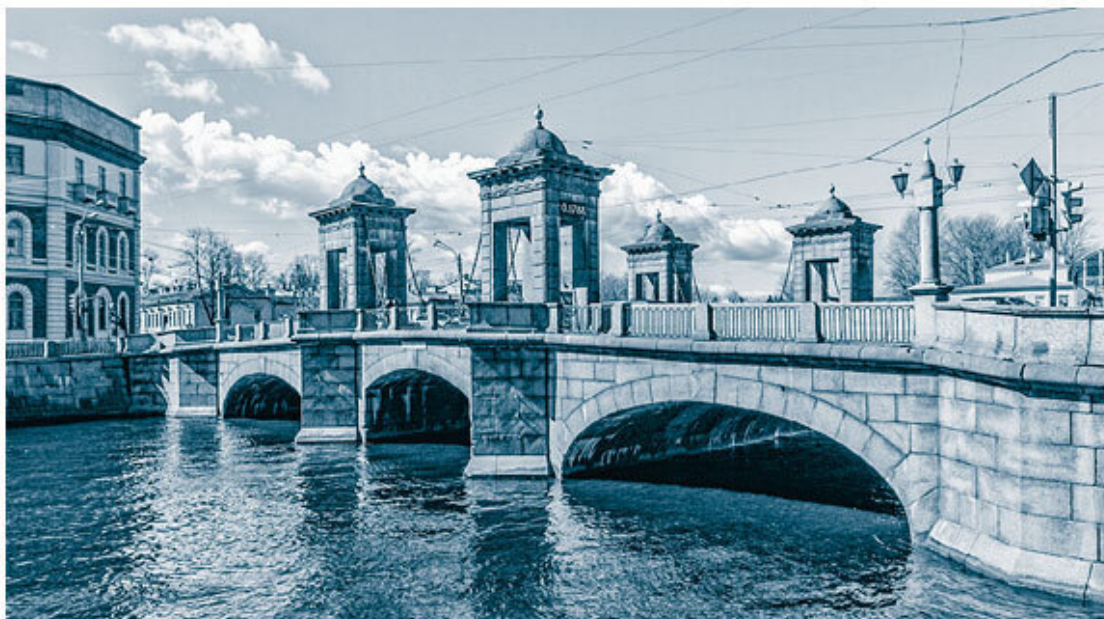
Старо-Калинкин мост в Санкт-Петербурге. Современная фотография.

на территории современной Санкт-Петербургской агломерации, на конец XVII века насчитывалось 904 населенных пункта (а всего в Ингерманландии – 1991 поселение). Шведы сохраняли принципы административного деления новгородских времен – погосты и уезды 9 .