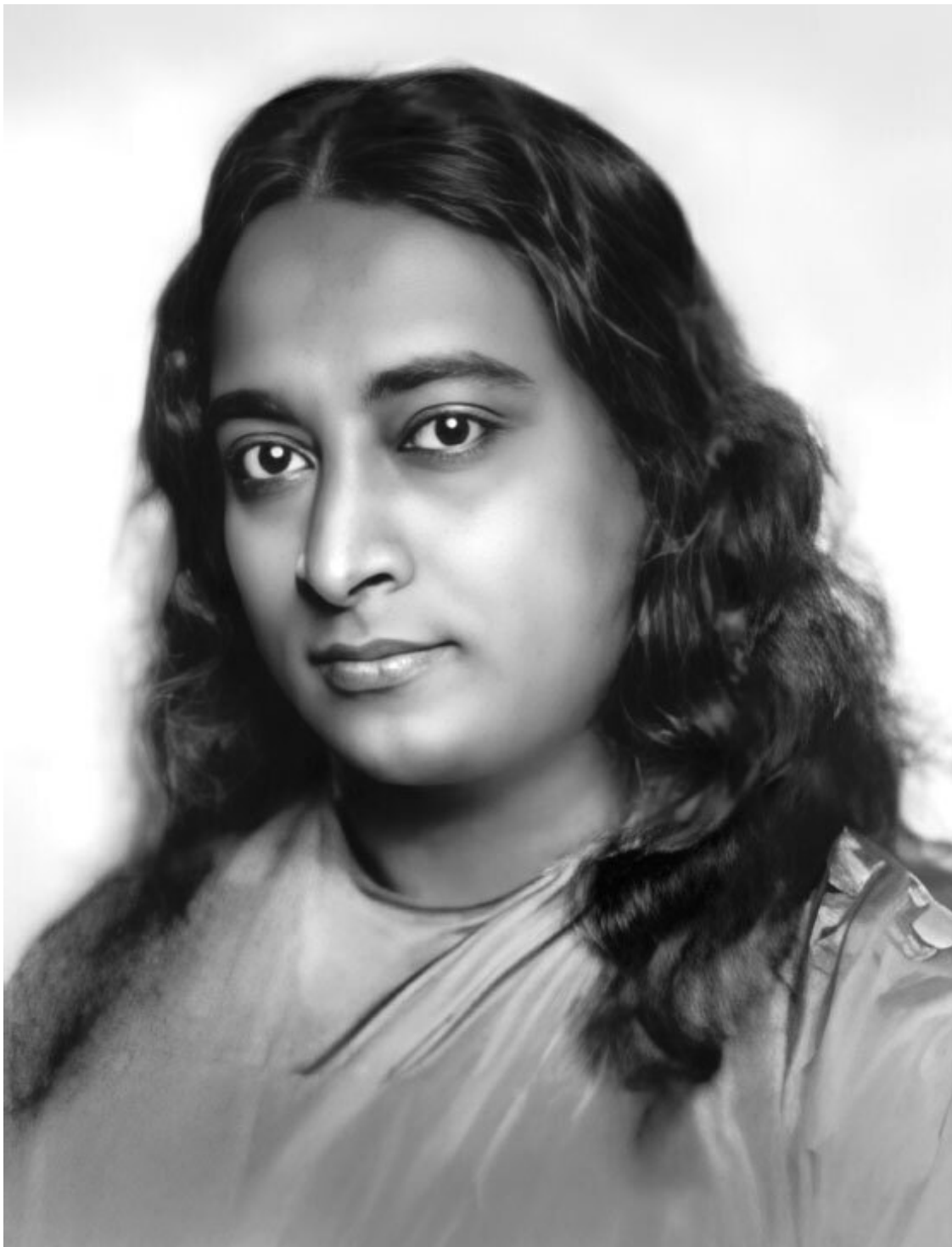
Шри Шри Парамаханса Йогананда (5 января 1893–7 марта 1952)