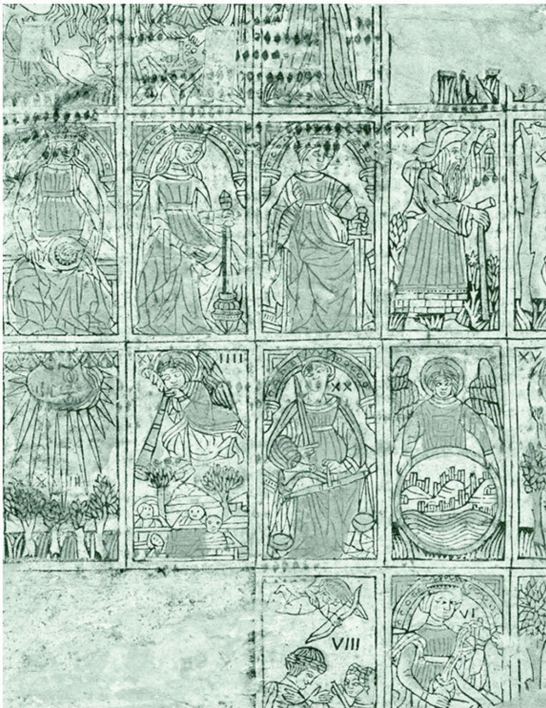
Карты тароччи. The Metropolitan Museum of Art

С достоверностью можно утверждать, что карты Таро появились не ранее 1390-х годов и не позднее середины XV века. Что же касается места их появления, то уже в середине XV столетия в Италии были известны карты тароччи, которые можно назвать прообразом Таро. Они представляли собой листы ручной работы большого формата, выполненные на заказ профессиональными художниками.