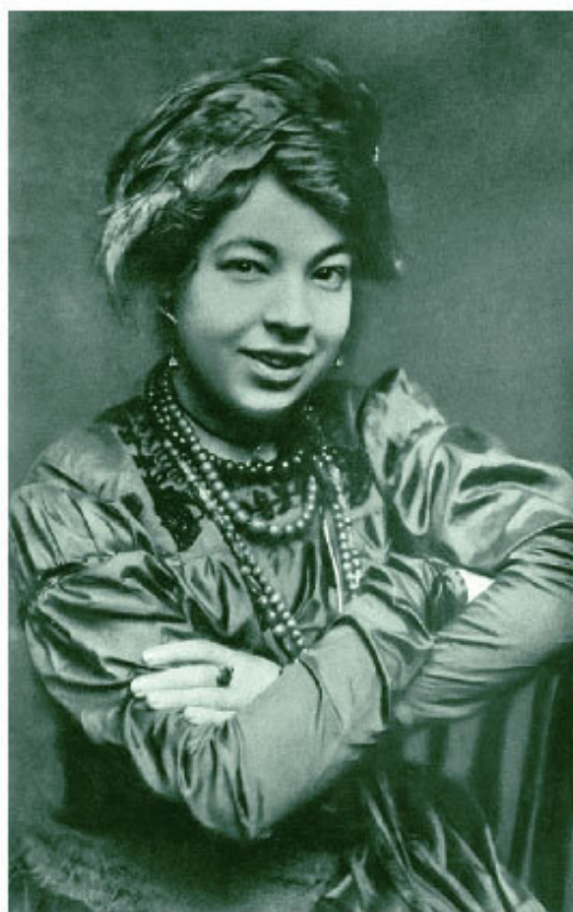
Артур Эдвард Уэйт и Памела Колман Смит.