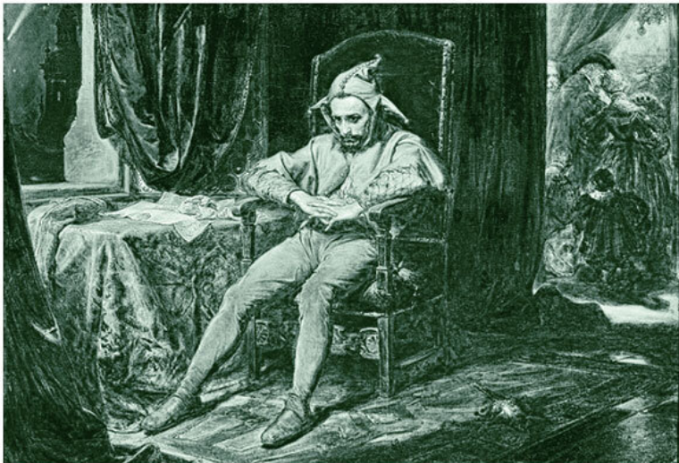
Станчик. Картина. Ян Матейко. National Museum in Warsaw

Амбивалентность, парадоксальность и завораживающая глубина символизма Таро в полной мере раскрывается с самой первой, а вернее, нулевой карты Старших арканов. И хотя эзотерики разных школ до хрипоты и швыряния друг в друга колодами спорят о том, стоит ли помещать Шута, или Дурака, на нулевое или двадцать первое место, едины они в одном: это наиболее могущественный и всеобъемлющий аркан. Недаром это единственный Старший аркан Таро, который в виде джокера остался и в колоде игральных карт.