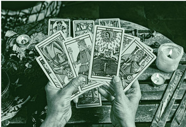
Колода «Марсельского Таро».

Мне хочется не только рассмотреть Таро в культурно-религиозном ключе, но и показать Старшие арканы как систему, где каждый последующий аркан органически связан с остальными. Ведь Таро – это не разрозненный набор символов, а стройная и логичная система путешествия героя. Можно сказать, Старшие арканы буквально нарезают мир на 22 части и представляют собой спиральную лестницу духовного восхождения, доступного для каждого – вне зависимости от религиозных убеждений и веры в предсказания и