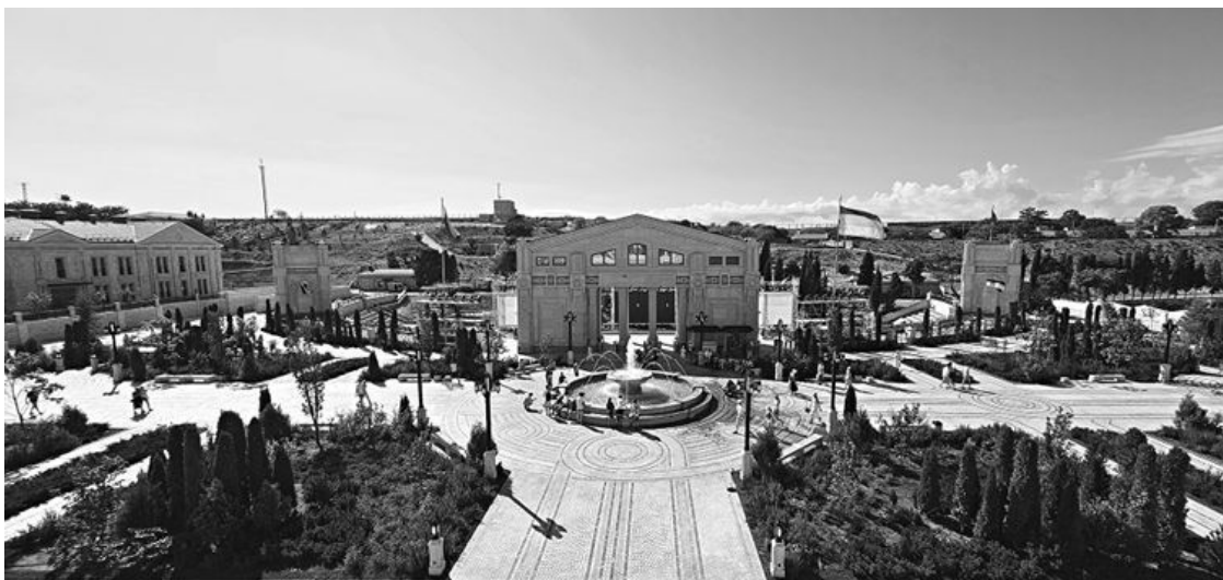
Музейно-храмовый комплекс «Новый Херсонес»