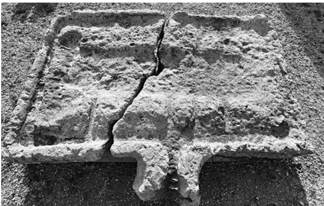
Основание виноградного пресса – тарапана. II век н. э. Гераклейский полуостров (Севастополь)