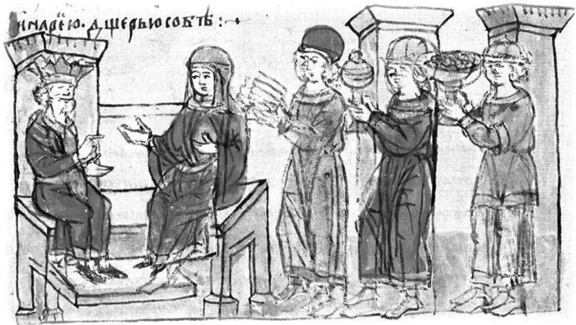
Радзивилловская летопись, конец XV века

Скульптурное изображение княгини Ольги и князя Владимира Святославича. Автор Вячеслав Клыков