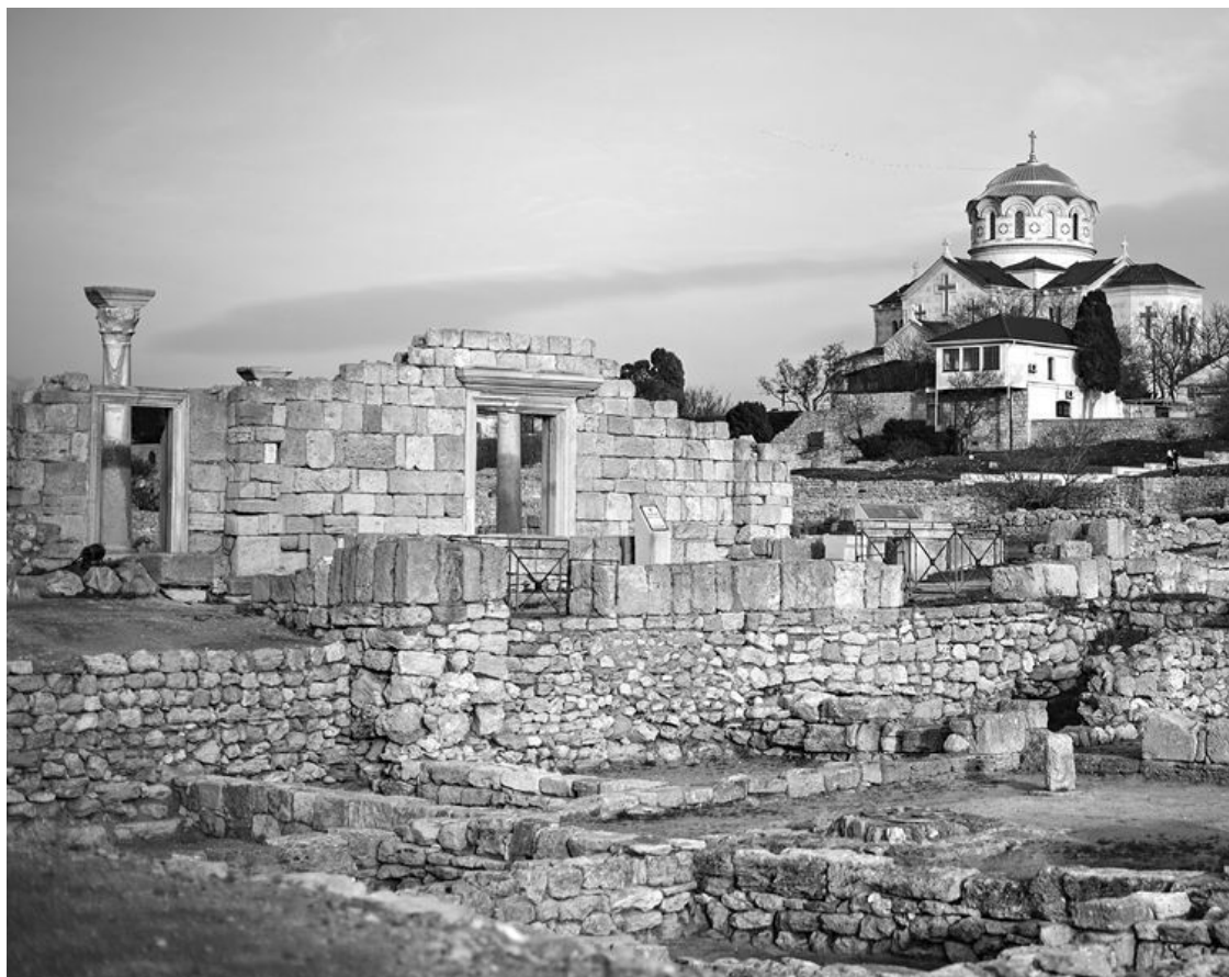
Руины Херсонеса и Свято-Владимирский собор

В XIII веке значение пути из варяг в греки постепенно начинает снижаться, по итогам крестовых походов формируется новое магистральное направление торговли Европы с Востоком. Торговля сложным и долгим маршрутом по русским рекам до Черного моря и далее вдоль его небезопасного побережья приобретает второстепенное значение. Огромное влияние на торговлю оказывает монгольское нашествие на Русь.