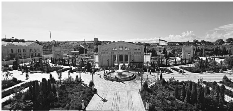
Музейно-храмовый комплекс «Новый Херсонес»

обнаружены приспособления для изготовления и хранения вина. Сейчас она входит в музейно-храмовый комплекс «Новый Херсонес», где можно по реконструкциям проследить весь путь создания вина херсонеситами. Центр музея-заповедника – древняя торговая площадь – агора Херсонеса. На ней, согласно летописям, и стояла базилика, где принял крещение князь Владимир. Версий того, какой именно из храмов древнего города стал местом крещения, несколько. Одна из самых почитаемых херсонесских базилик и наиболее вероятное место нахождения купели сегодня, как куполом, накрыта величественным Владимирским собором.