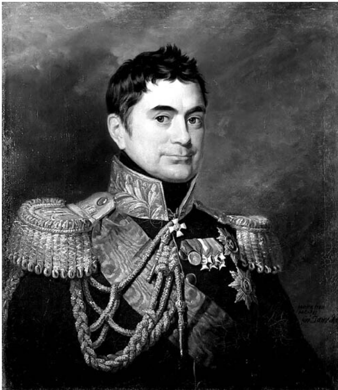
Портрет князя Петра Михайловича Волконского работы Джорджа Доу. Военная галерея Зимнего дворца

Прототип князя Андрея Болконского П.М. Волконский, как мы убедились, сделал успешную военную и придворную карьеру, достиг высшего военного чина и умер своей смертью через 40 лет после Отечественной войны 1812 года. Да и возглавленная контратака в Аустерлицком сражении имеет успех. Восходящий же к П.М. Волконскому персонаж так и остаётся в чине полковника и получает смертельное ранение в Бородинском сражении, а до этого оказывается ранен и попадает в плен в Аустерлицком сражении, и возглавленная им контратака под Аустерлицем терпит неудачу.