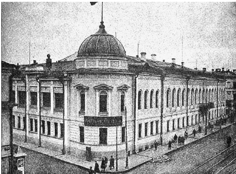
«Дом Болконских» (Воздвиженка, 9). Начало XX века. Дом князя Николая Сергеевича Волконского, прототипа «старого князя» Николая Андреевича Болконского