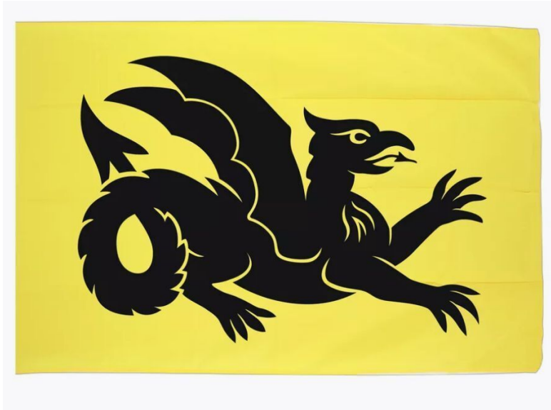
Флаг Великой Тартарии