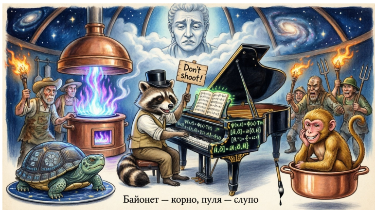
Байонет — корно, пуля — слупо

АУДИО-ОПИСАНИЕ ИЛЛЮСТРАЦИИ: Автор знает, что пишет не идеально, поэтому прячется за пианиста и Бога одновременно. Енот в роли пианиста играет на рояле, но вместо нот — формулы квантовой физики. Перед ним — толпа с вилами и факелами, но он закрывается щитом с надписью "Не стреляйте!". Над ним — Бог с выражением "Прощаю... наверное". Внизу надпись: "Штык молодец, а пуля дура". Это как сказать: "Я не виноват, это муза!" — и тут же процитировать военную мудрость. Рояль и армия в одном флаконе. Обезьяна хихикает сбоку, Черепаха кивает: мол, видела я таких пианистов.