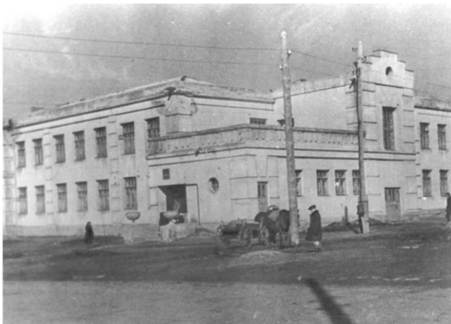
Актюбинск. 1941 г.

В свои 4 года я как добрый горожанин осваивал город. Мать устроилась кочегаром в котельной и сдавала меня на 5-дневку в детский сад. У нас была комнатуха в доме на окраине города. А детский сад находился на другом конце города. Однажды я поразил свою мать, когда сам нашел дорогу домой, сбежав из детского сада посреди недели. Из сада я ушел утром, а добрался до дома только вечером. А в другой раз я чуть не заблудился из-за одного только запаха белого хлеба. Я шел по улице и вдруг увидел человека, который нес подмышкой буханку белого хлеба. Я не помнил, как выглядит белый хлеб, но вид его меня его заворожил. Я пошел вслед за хлебом и его пьянящим ароматом. Опомнился только, когда хозяин зашел в дом. И я не солоно хлебавши побрел восвояси, благо это было не так далеко от дома, как детский сад.