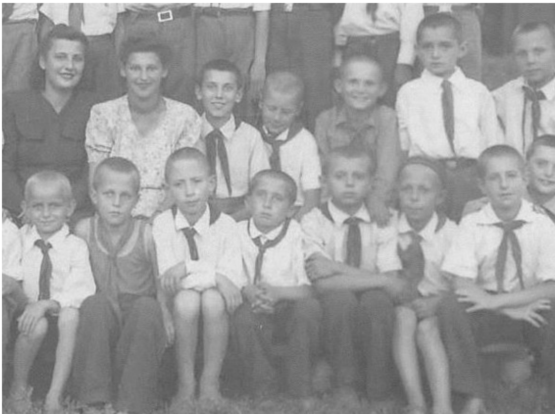
В пионерском лагере. Лето 1948 г. (в центре)