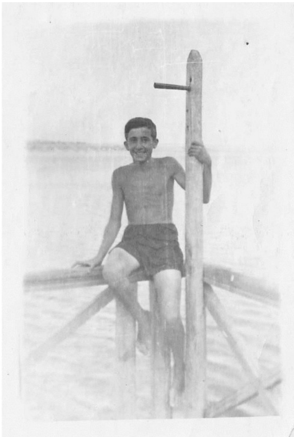
Пионерлагерь 1953 год