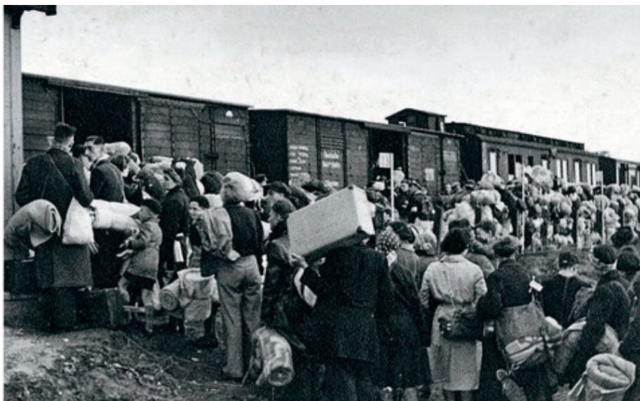
Эвакуация. 1941 г.