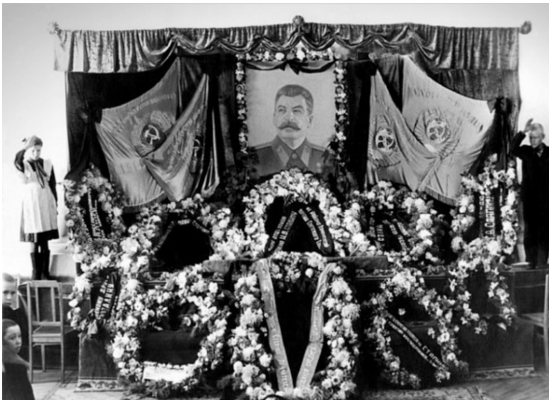
«Траурная линейка в день похорон Сталина»

Для меня — это самый тяжелый удар в жизни. И в этот день, день памяти Сталина, я клянусь еще лучше учиться, еще активней участвовать в общественной жизни.