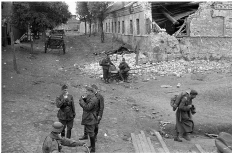
Днепропетровск 1944 г.

Через год мы вернулись в Днепропетровск. На месте своего дома мы обнаружили развалины. Делать было нечего и мы поехали в родную деревню. Дом, где когда-то жили родители, тоже оказался разрушен. Наши соседи успокаивали нас: «Вам еще повезло, вы остались живы». Почти все жители были расстреляны немцами в овраге за селом. Мы поселились в одном из пустующих домов и стали выживать. Мать работала в колхозе с утра до вечера. А мы с братом осваивали новое место жительства. Вместе с местной детворой учились новым способам пропитания: ловили сусликов, шкурки сдавали колхозу, а мясо жарили и ели.