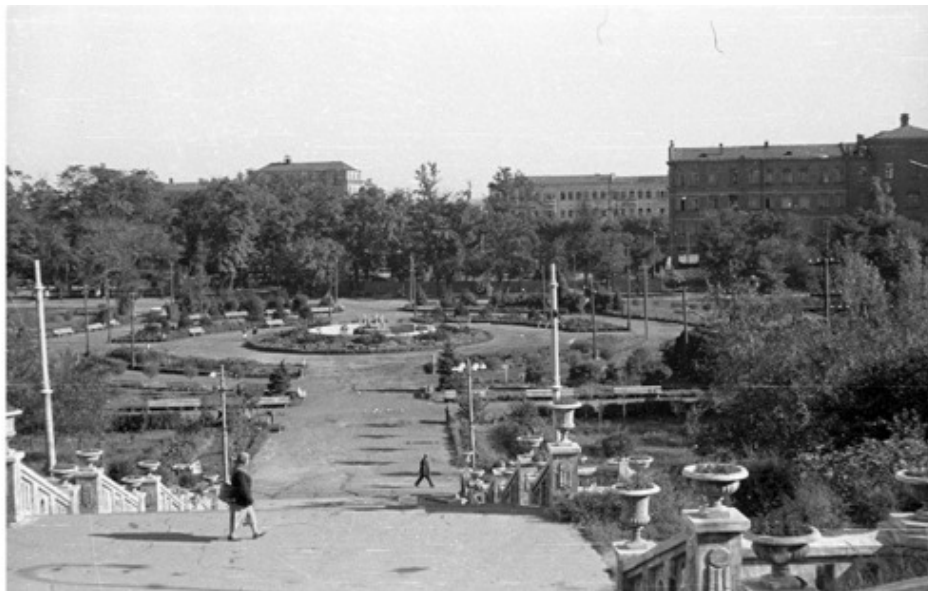
Днепропетровск 1940 г.